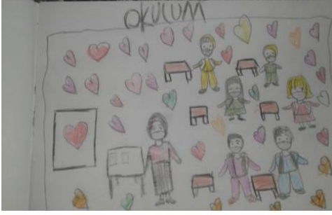
Resim 4. Öğrenci Resimlemeleri (Ö38Ç ve Ö34Ç)