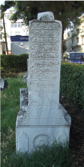
Resim 3: IV. Devlet Geray Han Ramazan 1194 Saray Ayas Paşa Camii haziresi