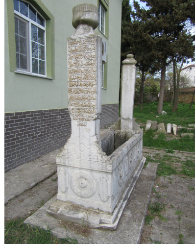
Resim 8: II. Kaplan Geray Han 1185 Subaşı Camii haziresi