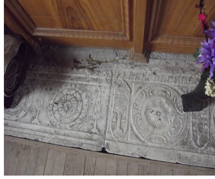
Resim 14: Fındıklı Kilisesi'nin içindeki lahit parçaları (Ağustos 2015)