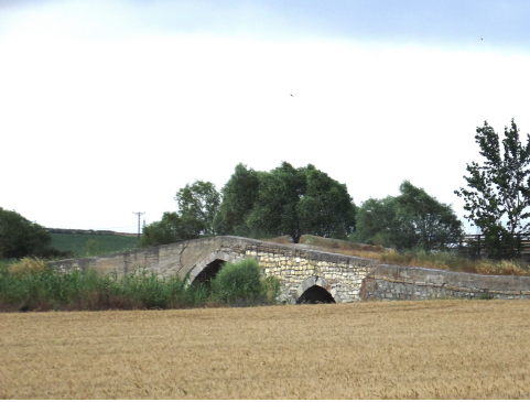
Resim 7: III. Selim Geray Han Köprüsü Karabürçek Köyü (2012)