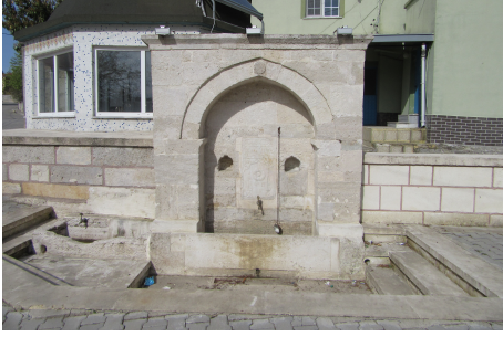
Resim 9: Selim Geray Sultan Çeşmesi Subaşı-Çatalca