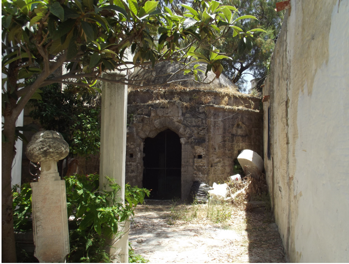
Resim 23: Şahin Geray Sultan ve Fetih Geray Sultan türbesi Murad Reis Mezarlığı Rodos (23.6.2013)