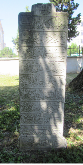
Resim 5: Selim Geray Sultan 1255 Şehit taşı Saray Ayas Paşa Camii haziresi