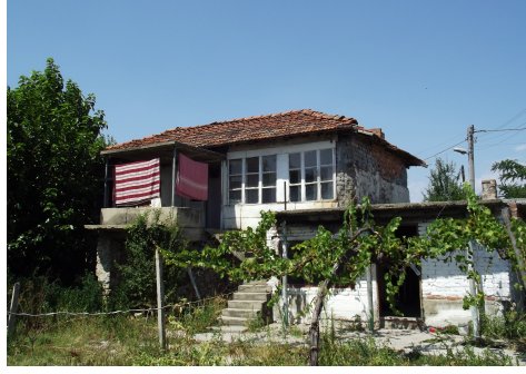
Resim 18: Athoğlu (Konövo) Köyü'ndeki (Yeni Zağra) Geraylara ait konak (2015)