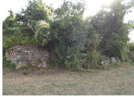
Resim 20: Virbitsa Kasabası, Gerayların Sarayından geriye kalanlar (ikinci avludan görünüş) (2015)