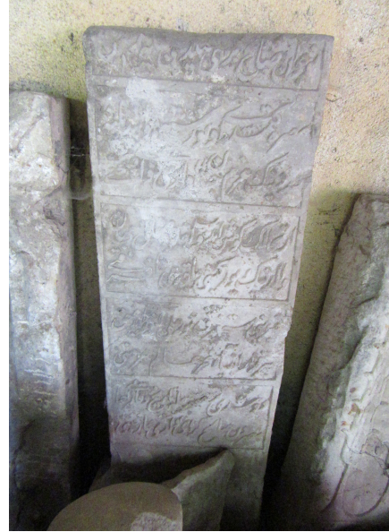
Resim 16: Salih Geray Sultan'ın mezar taşı (İslimye Bölge Tarih Müzesi, 2016)