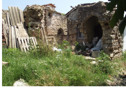
Resim 10: Hamam kalıntısı Subaşı Köyü 15 Haziran 2013