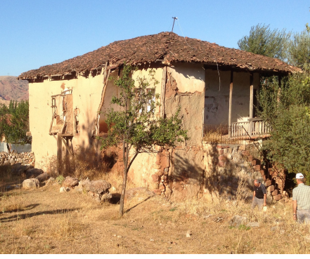
Resim 13: Gerayların konağı-Güzelbeyli Kasabası-Zile