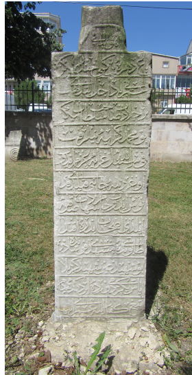
Resim 4: Mehmed Geray Sultan 12. Şehit taşı Saray Ayas Paşa Camii haziresi