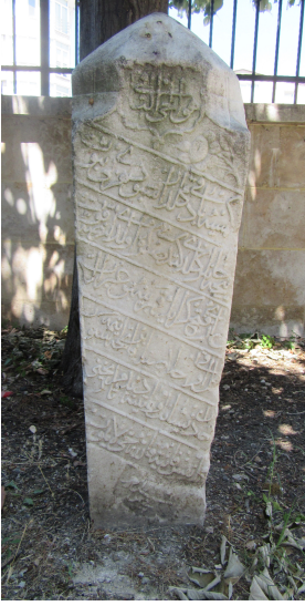
Resim 1: II. Fetih Geray Han 22 Şaban 1159 Saray Ayas Paşa Camii haziresi