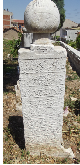
Resim 6: Kalgay Mübarek Geray Sultan (Arslan Geray Han'ın oğlu) 1203 Çelebi Sultan Mehmed Camii (Paşa Camii) haziresi