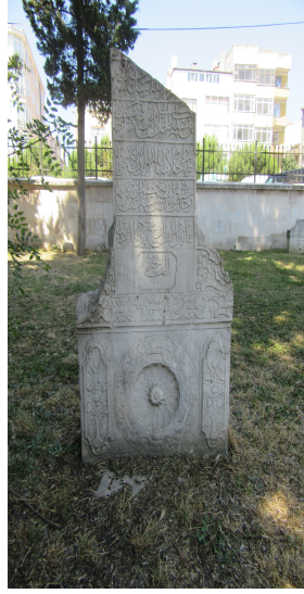
Resim 2: II. Selim Geray Han 1200 Saray Ayas Paşa Camii haziresi