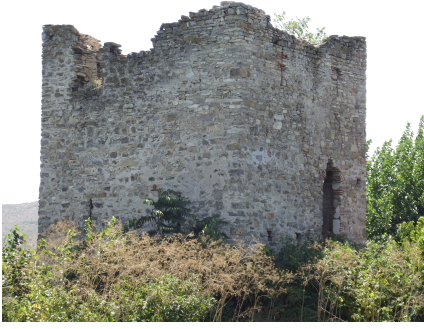
Resim 17: Kule-Athoğlu (Konövo) Köyü (Yeni Zağra)