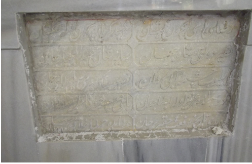
Resim 11: Selim Geray Sultan'ın kızı Fatma Sultan'ın çeşme kitabesi Oklalı köyü camii gasilhanelerinin içinde