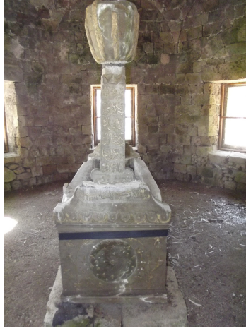
Resim 22: Camibek Geray Han Murat Reis Mezarlığı Rodos (23.6.2013)