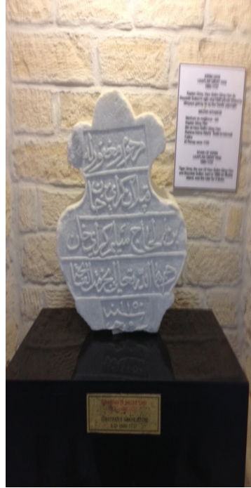
Resim 12: I. Kaplan Geray Han'ın baştaşı- Çeşme Kalesi müzesi