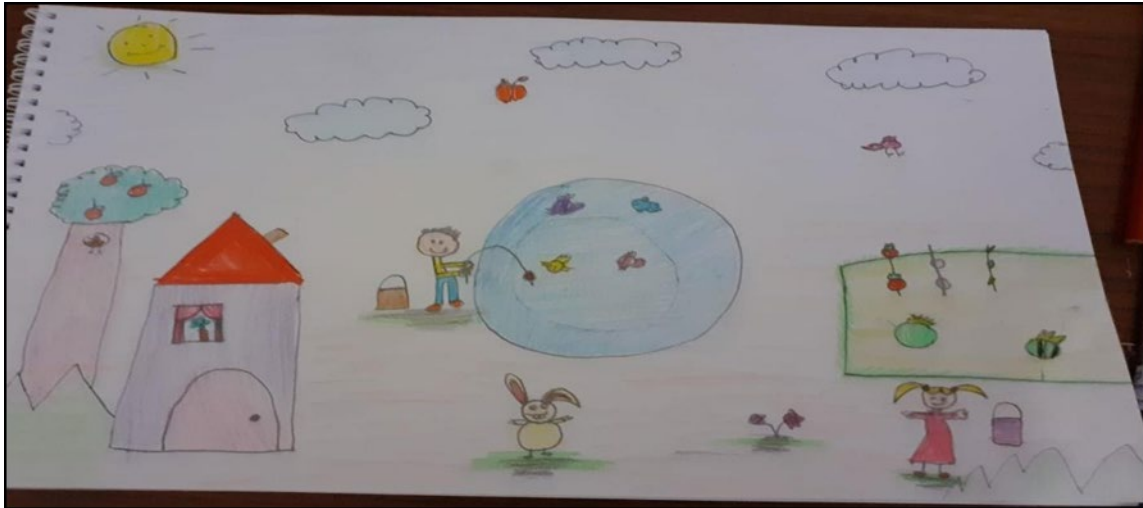
Resim 3.1. 2. Sınıf Öğrencisine Ait Resim

Örneklerden de anlaşılacağı üzere çocuklara yaşadıkları çevreye karşı farkındalık yaratmak, sevgi aşılanmak istenmiştir. Doğal kaynakların kullanımı konusunda detaylı bilgilendirmeler yapılmış ve doğal kaynak tüketiminde azaltma gidilmesi gerekliliği üzerinde tüm ders kitaplarında durulmuştur. Diğer üzerinde durulan konu ise, geri dönüşümdür. “Sıfır Atık Projesi” çocuklara detaylı bir şekilde tanıtılmıştır ve sadece atıkları ayırmak değil tüketimi azaltmak gerekliliği üzerinde durulmuştur. Bu sayede çocuklarda çevre bilincinin oluşturulması istenmiştir. Çevre bilincinin oluşumunda en az değinilen konu ise ulaşımdır. Ulaşım konusunda toplu taşımaya yönelik bilgilendirmeler yer almamaktadır ya da öneminden bahsedilmemektedir. Kitaplarda yer alan trafik temalı fotoğraflarda da genel olarak bireysel araçların kullanıldığı toplu taşıma araçlarına çok yer verilmediği görülmektedir.