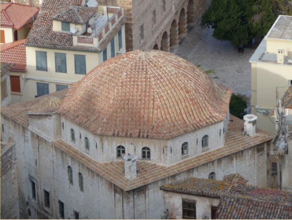
Resim-11 Anabolu (Nafplion) Ağa Camii üst örtüsü genel görünüşü