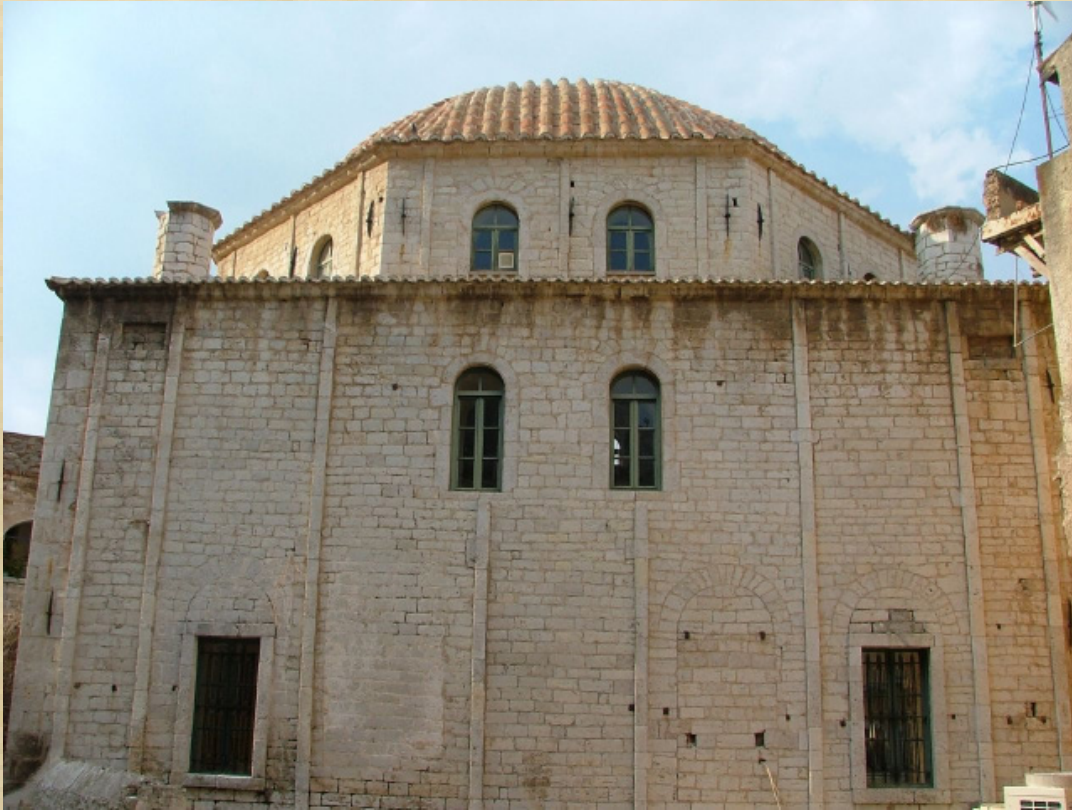
Resim-10 Anabolu (Nafplion) Ağa Caminin batı cephesi