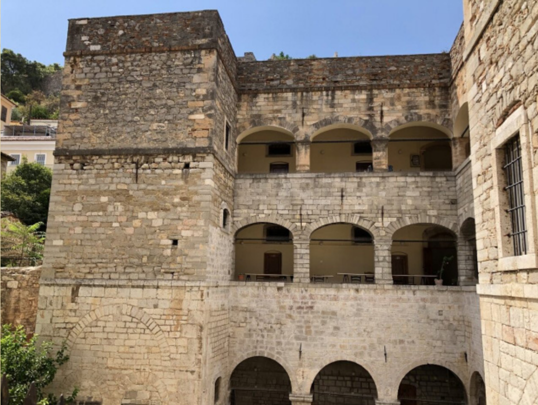
Resim-12 Anabolu (Nafplion) Ağa Camiye bitişik Medrese cephesi