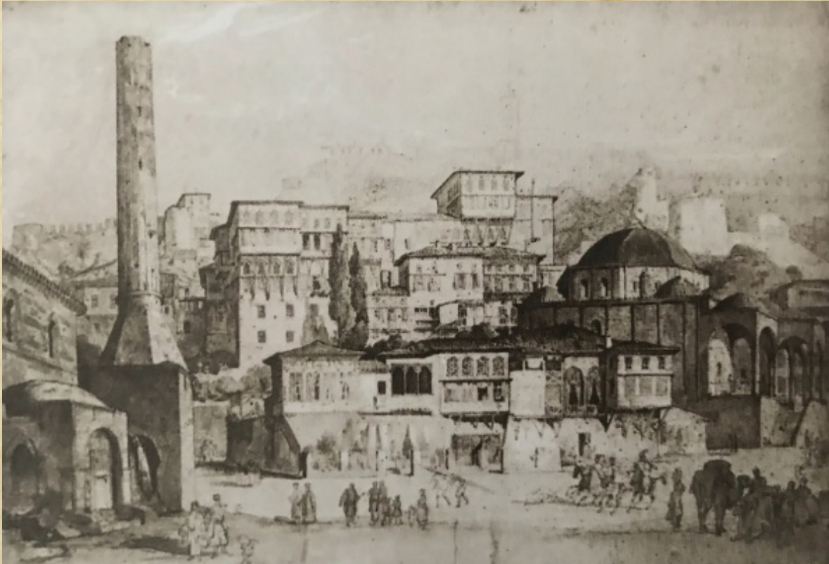
Resim-2 Mora Paşası'nın Sarayı ve Cami. Alman mimar Ludwig Lange'nin Alman ressam Carl Anton Joseph Rottmann'a eşlik ettiği ilk ziyareti-1834