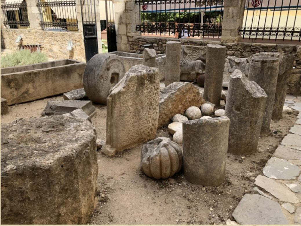
Resim-13 Anabolu (Nafplion) Ağa Caminin haziresinden kalma kallavi kavuklu bir mezartaşı başlığı