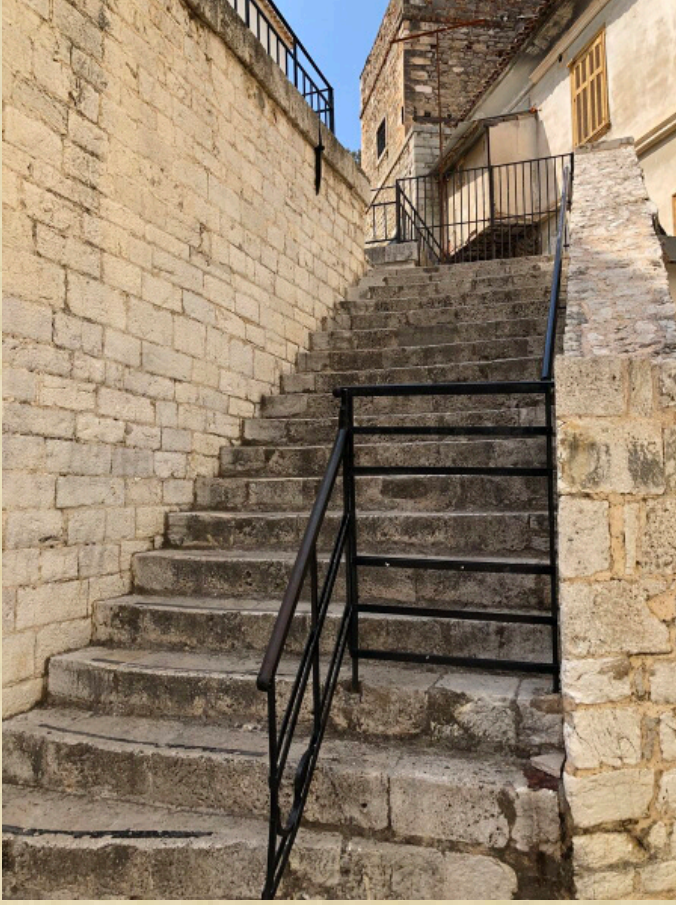
Resim-5 Anabolu (Nafplion) Ağa Caminin son cemaat yerine çıkış merdivenleri