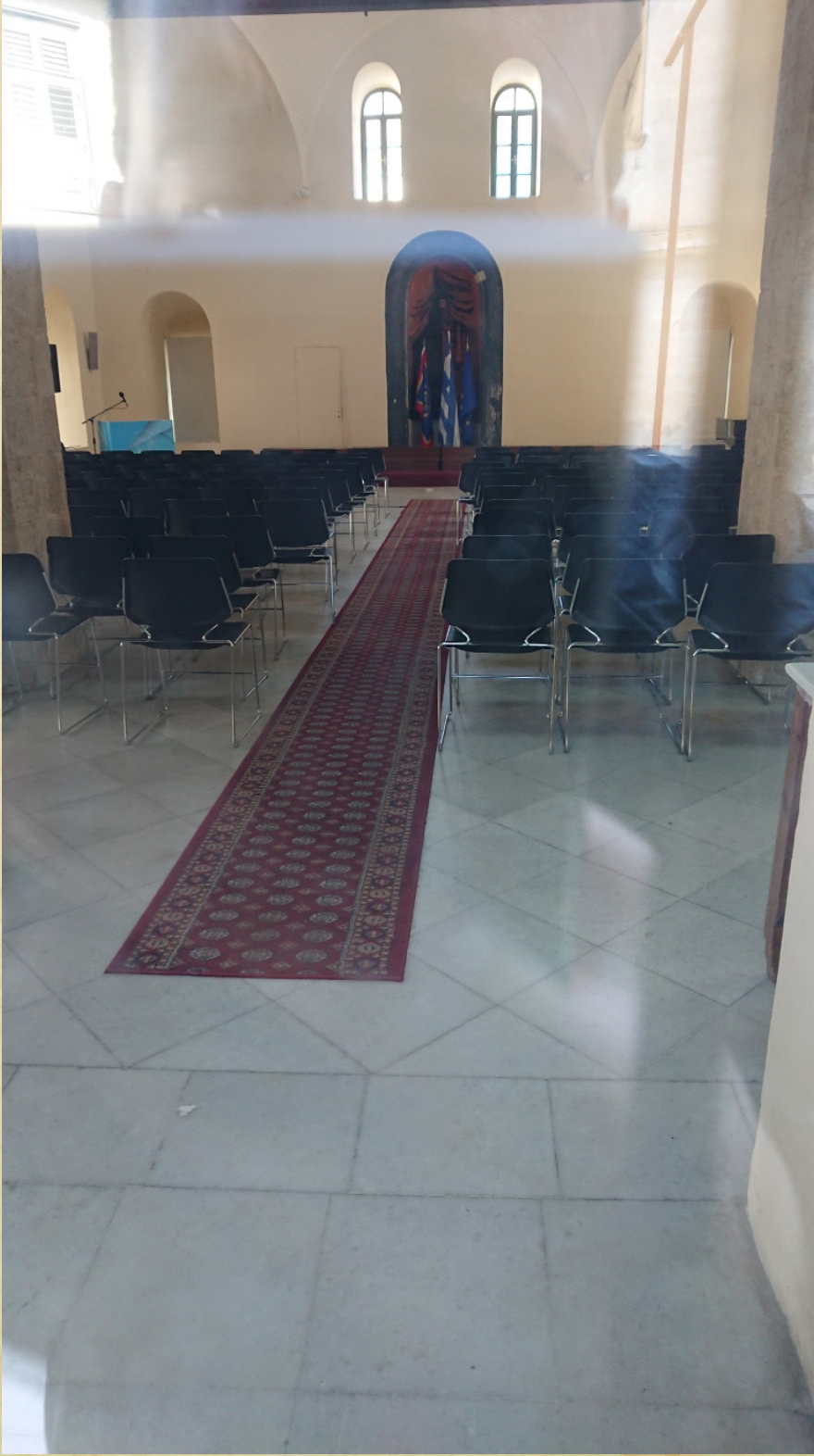
Resim-8 Anabolu (Nafplion) Ağa Caminin iç mekânı