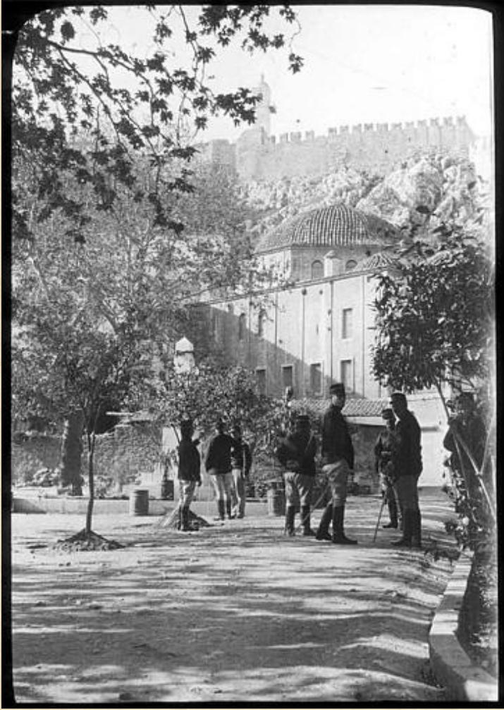
Resim-3 Anabolu (Nafplion) Ağa Caminin genel görünüşü, Mimar Lucien Roy 1908