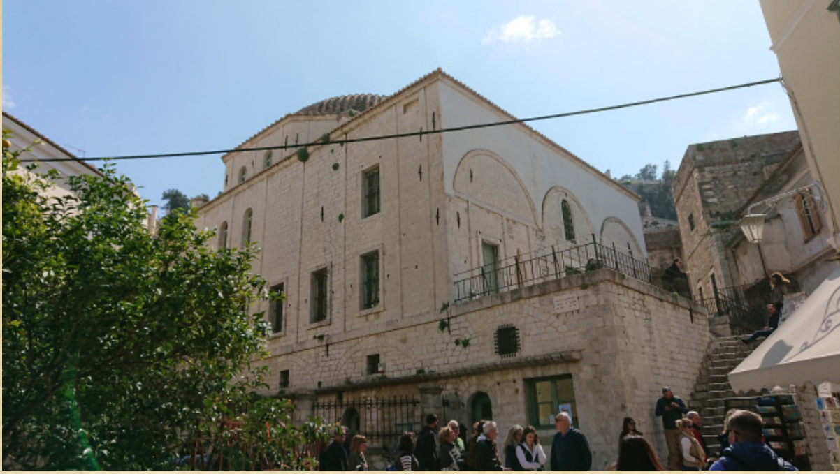
Resim-9 Anabolu (Nafplion) Ağa Caminin doğu cephesi