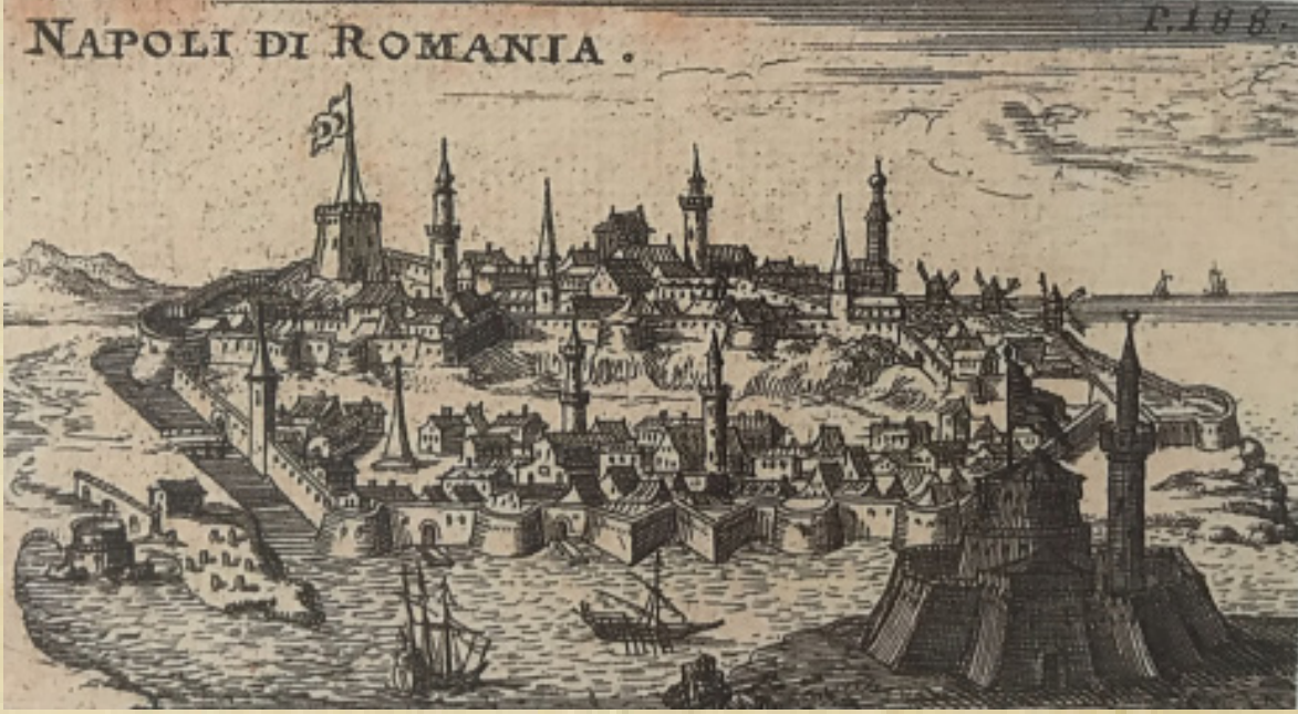
Resim-1 Anabolu şehri, J.Sandart, 1687