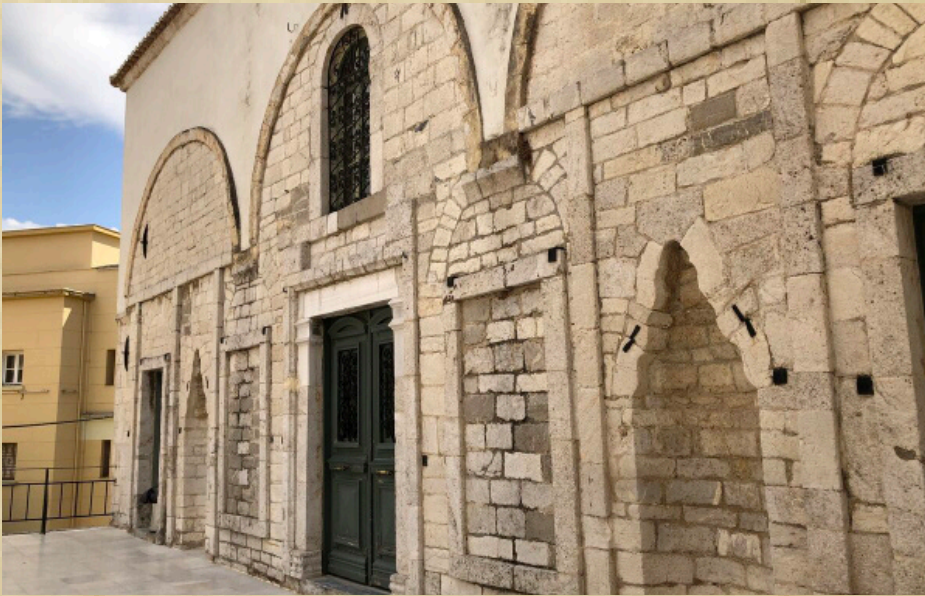
Resim-6 Anabolu (Nafplion) Ağa Caminin son cemaat (kuzey) cephesi