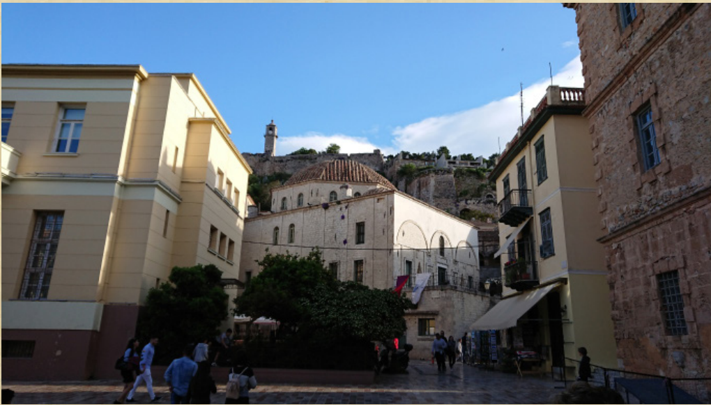
Resim-4 Anabolu (Nafplion) Eski Çınar (Sintagma) Meydanı'nda Ağa Caminin görünüşü