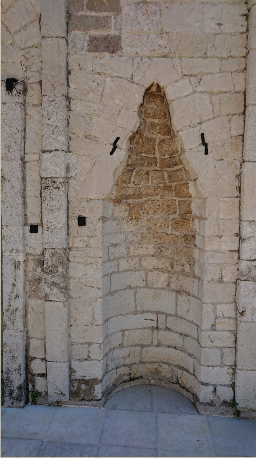
Resim-7 Anabolu (Nafplion) Ağa Caminin kuzey (giriş) cephesi duvarında mihrabiye