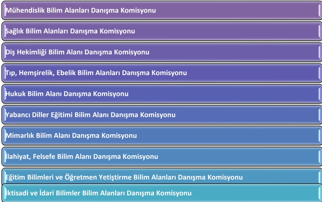
Şekil 1. Bilim Alanı Danışma Komisyonları

Yönetmeliğin her bir dosya üzerinden münferiden incelenmesi ve değerlendirilmesi amacıyla alanında uzman ve bağımsız akademisyenler tarafından Bilim Alanı Danışma Komisyonları oluşturulmuştur. Bilim Alanı Danışma Komisyonları belirli dönemlerde toplanmakta ve denklik başvurularının münferiden incelenmesini sağlamaktadır. Müzik ve müzik eğitimi alanına ait denklik başvuruları Eğitim Bilimleri ve Öğretmen Yetiştirme Bilim Alanları Danışma Komisyonunca değerlendirilmekte olup diğer Bilim Alanı Danışma Komisyonları Şekil 1’de gösterilmiştir.