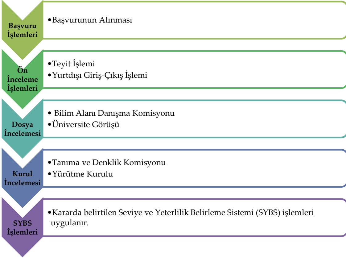
Şekil 2.Denklik Süreçleri

Şekil 2 incelendiğinde denklik başvuru süreçleri görülmektedir. Öncelikle Başvuru İşlemleri aşamasında ilgilinin başvuru evrakı eksiksiz teslim alınır. Daha sonra Ön İnceleme İşlemleri aşamasına geçilir ve mezun olunan yurt dışı yükseköğretim kurumuna ait diplomanın ilgili Büyükelçilikler aracılığıyla teyit yazışması yapılır. Bu aşamada ilgilinin eğitim-öğretim süreci içindeki yurt dışına giriş-çıkış gün sayısı da kontrol edilir. Dosya İncelemesi aşamasında ise ilgilinin dosyası Bilim Alanı Danışma Komisyonu ya da ilgili Üniversite aracılığıyla içerik açısından (kredi, saat sayısı, eşdeğer alan/bölüm vb.) münferiden incelenir. Gerekli görüldüğü takdirde ilgiliden ek evrak talep edilebilir. İncelenen dosya bir sonraki aşama olan Kurul İncelemesine yönlendirilir. Bu aşamada dosya, Tanıma ve Denklik Komisyonunca değerlendirilir ve ardından Yürütme Kurulu Kararı alınır. Bu kararlar; doğrudan denklik, SYBS veya ret olabilir. Son aşamada ise kişi hakkında Seviye Belirleme Sınavı kararı varsa SYBS İşlemleri uygulanır.