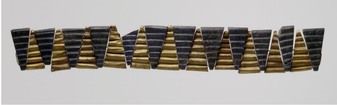
Fig 2: Lapis lazuli-Altın Karışımı Kolye, Metropolitan Museum.