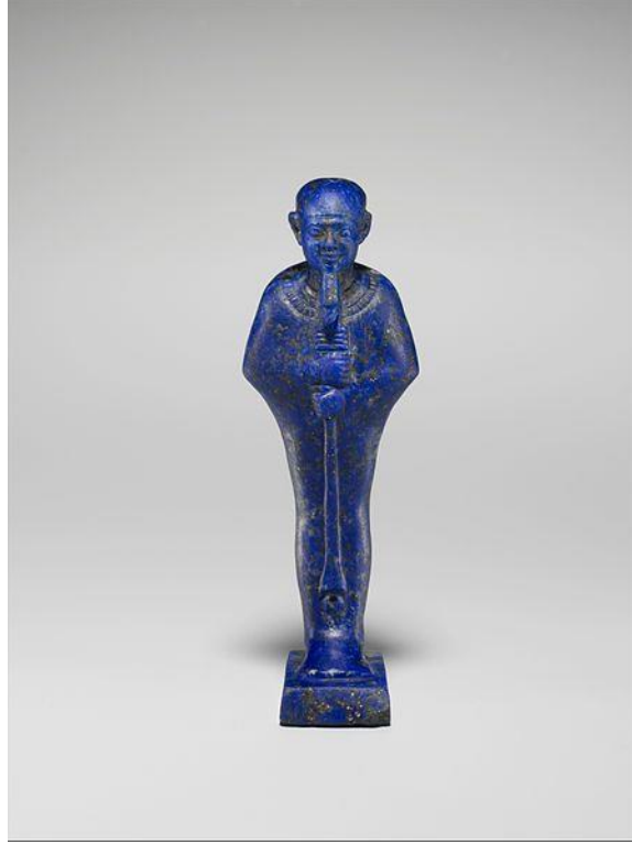
Fig 5: Eski Mısır, Lapis Lazuli Heykel. Metropolitan Museum.