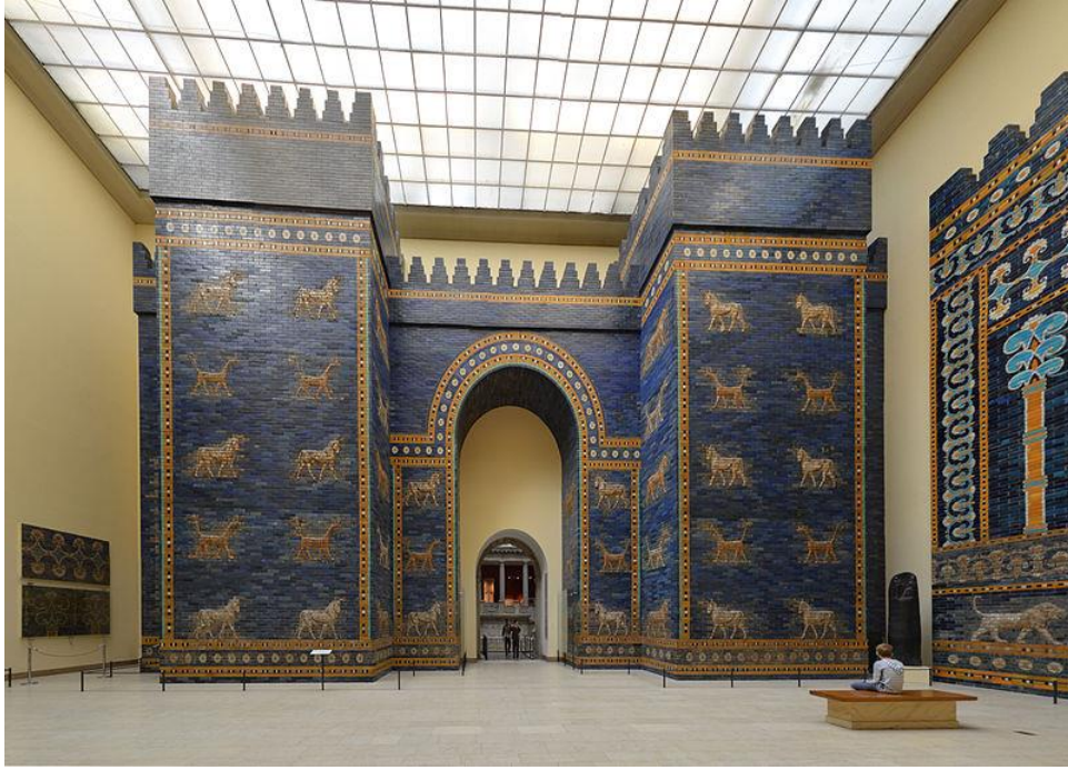
Fig 1: İştâr Kapısı, Pergamon Müzesi.