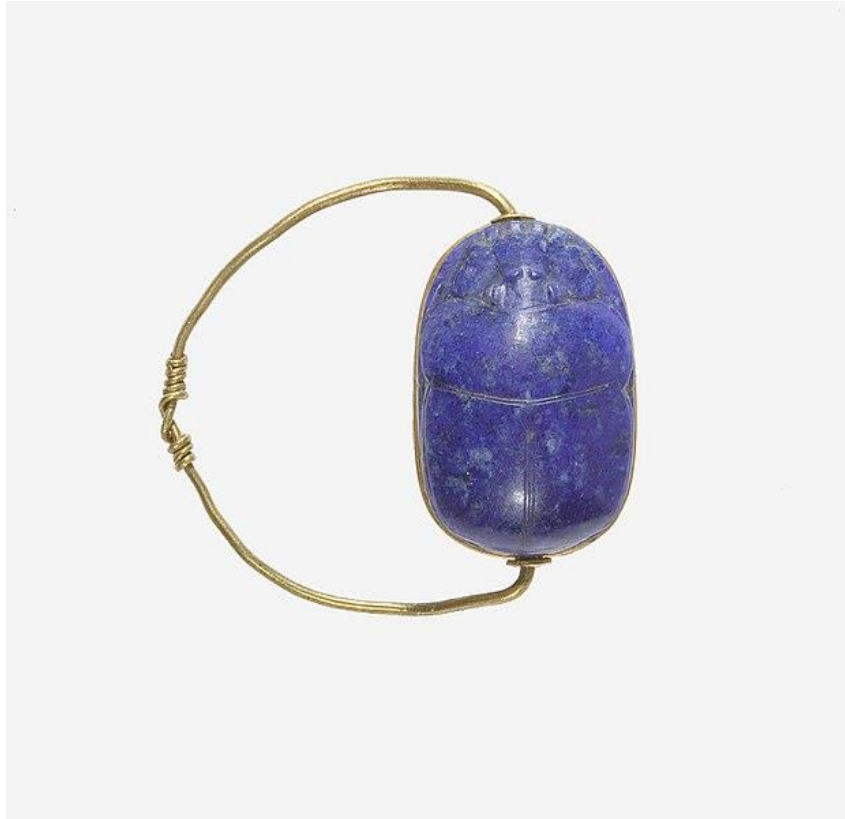
Fig 4: Antik Mısır Dönemi, Lapis Lazuli Yüzük. Metropolitan Museum.