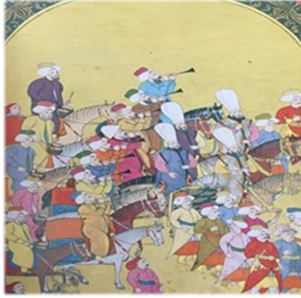
Görsel 2. 1720 Şenliğinde Mehter Alayı (And,2020)

Görsel 2' de yer alan atlı mehter takımı sekiz adet zurnazen ve beş adet köszenden oluşan bir gruptur. Zurna ve kös mehter müziğinin iki temel çalgısı olmakta olup özellikle kös padişah mehterlerinde kullanılmıştır. Büyük ebattaki köslerin deve ve fil üzerinde kullanılanları olduğu gibi bu görseldeki kösler en küçük ebatta olup at üzerinde çalınmaktadır. Müzisyenlerde geçit töreninde olduklarını ve o anda icrâda bulduklarını belli etmek için bir hareket hali söz konusudur. Mehter grubunun gerek kalabalık bir yapıda olması gerekse çalgılarının sayıca çok ve icra ettikleri müzik bakımından gücü ve korkuyu temsil etmesiyle birlikte, kurgulanan mekân içinde göz dolduran bir görünüm sağlanmıştır. Musiki, padişahın başı çektiği geçit alaylarında hem dinlenmek için hem de alayla birlikte gösteri yapan soytarılar, köçeklere, dervişlere eşlik etmek için kullanılıyor hem de alayın görüntüsünü de zenginleştiriyordu. Levni'ye ait geçit alayındaki atlı minyatür de buna örnek tasvirlerden biridir" (And, 2020: 213).