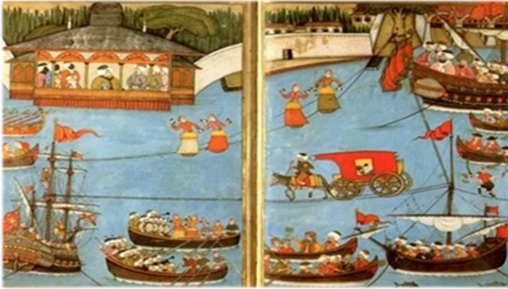
Görsel 5. 1720 Şenliğinde Haliç' te Su Üstünde Dans Eden Köçekler (And,2020)

Görsel 5'te kurgular her ne kadar gerçekten uzak gelse de aslında yaşanmış sahnelerin ve olayların resmedilmesine dayanmaktadır. "İpler üzerinde gemilerin savaştığı nerdeyse bütün şenliklerde görülüyordu. 16. Şenliğinde ip üstünde bir ejderha, gayrimüslim kıyafeti giymiş irice bir dev, iki kadırga ipin üzerine yerleşmişler karşılıklı çarpışıyorlardı ve sanki