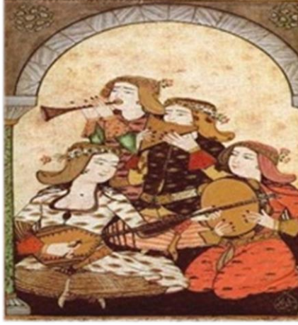
Görsel 4. Kadın Sazendeler (URL-3)