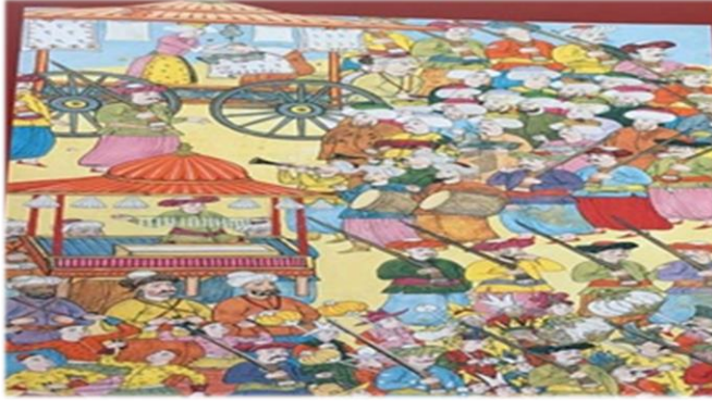
Görsel 8. 1720 Şenliğinde Esnaf Alayı Minyatürü (And, 2020)

Görsel 8, Osmanlı döneminin önemli unsurlarından biri olan esnaf geçit alayına ait bir tasvirdir. Geçit alayında figürler sağlı sollu olarak kıvrımlı bir şekilde yukarıdan aşağıya iner vaziyette tasvir edilmiştir. Geçidin en sol kısmındaki bölümü, elinde silah tutan figürler oluşturmaktadır. Minyatürün en üst kısmında silahlar figürlerin sağ elindeyken, aşağıya doğru indikçe figürlerin sol elinde ve en alt kısımda tekrar sağ elde çizilmiştir. Bu şekilde perspektif oluşturularak çizilen figürlerin ve objelerin özelliklerinin görünmesinin Tasvirin orta kısmında, silah tutan figürlerin arasında kalan davul ve zurna çalan müzisyenler görülmektedir. Müzisyenlerin arkasında silahlı figürlerin himayesinde korunan padişaha sunmak üzere kıymetli hediyeleri taşıyanlar yer almaktadır. Geçit alayının aşağıya uzayan kısmında ise ellerinde kâğıt fenerlerle çocuklar, köçekler, eğlencenin bir parçası olan yüzü maskeli