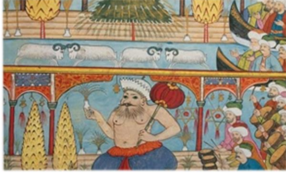
Görsel 7. 1720 Şenliğinde Koçlar, Dev Boyutlu Kukla ve Müzisyenler (And, 2020)

Görsel 7'deki tasvir Halic'te yapılan bir gösteriyi konu almaktadır. Osmanlı' da eski bir uygulama olan ağaç süsleme geleneğinin etkisi, minyatürdeki çam ve selvi ağaçlarının sarı tonlarda, kandillerle ışıklandırılmış görüntüsü verilerek resmedilmesinden anlaşılmaktadır. Minyatürün sol alt kısmında davul ve kös çalan yedi adet müzisyen bulunmaktadır. Figürler, Levni'nin diğer tasvirlerinde olduğu gibi burada da hareket halinde resmedilmiştir. Müzisyenlerin ve diğer figürlerin yüzlerindeki ifade çok net çizilmiştir. Resmin alt kısmında sağ elinde maytap, sol elinde kâğıttan feneri ile ürkütücü bakışlarıyla dev bir kukla kompozisyonunun merkezinde yer almaktadır. Bu dönemde dev boyutlu kuklalar şenliklerde önemli bir rol oynamaktadır. Tasvirdeki çevre süslemelerinden ışık, maytap, kandil gibi süslemelerin bu dönemde sıklıkla kullanıldığı anlaşılmaktadır. Minyatürün sol üst kısmında, sal üzerindeki figürlerin tasviri yer almaktadır. Figürlerin meraklı bakışları karşılarında duran iki çift koça yöneltilmiştir. Koçların ikisi birbirine tos vururken diğer ikisinin başı birbirinden ayrı vaziyettedir.