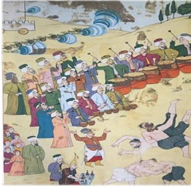
Görsel 3. 1720 Şenliğinde Pehlivanlar ve Müzisyenler (And,2020)

Görsel 3' deki minyatür III. Ahmet dönemi şenliklerinde yapılan huzur güreşinden bir sahneyi tasvir etmektedir. "Osmanlı' da padişahların