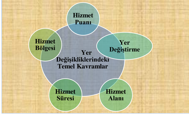
Şekil 1. Yer değişikliği esasları ile ilgili bazı kavramlar

Dolayısıyla üç hizmet bölgesinde toplam on sekiz hizmet alanı bulunmaktadır. Öğretmenler, bu üç hizmet bölgesinde yer alan farklı hizmet alanlarında görev yaptıkları süreler karşılığında değişen oranlarda hizmet puanı alabilmektedir.