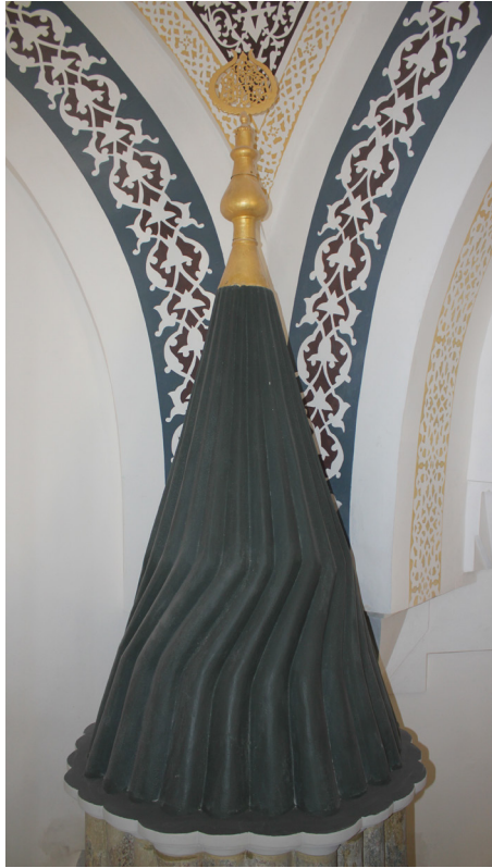
Şekil 19: Konya Selimiye Camii'nin minberinde köşkün külahı.