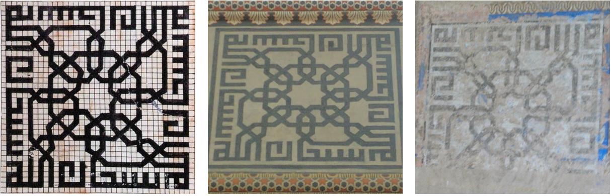
Şekil 13: Topkapı Scroll 'da “dört adet Sübhanallah” terkibi (Necipoğlu, Topkapı Scroll , 1995).