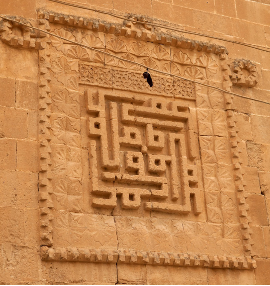
Şekil 12: Hasankeyf El-Rızk Camii'nin minare kaidesinde ma'kûlî "Dörder Muhammed ve Ali" terkibi.

Söz konusu yapılar şöyle sıralanabilir: Mamluk Kahire'sinden Sultan Kalavun Külliyesi (1284–1285) (şek. 9), Şeyh Zeyneddin Yusuf Kubbesi (1298), 6 Baybars el-Caşangir (Çeşnigir) Kubbesi (1307–1310), El-Maridânî Camii (1337–1340), Aksungur Camii (1347), Sadeddin bin Ğurab Medrese ve Hankahı (1406) (şek. 10) ve Muhammed el-Sagîr Camii (1426–1427); Halep'te El-Rûmî/Menkali Boğa Camii (1365); Bursa Yıldırım Camii (Osmanlı, on dördüncü yüzyıl sonu) (şek. 11), Hasankeyf'te El-Rızk Camii (Eyyubî, 1409) (şek. 12), Mardin'de Sultan Kasım Medresesi (Akkoyunlu, 1469), İsfahan'da Mescid-i Şah (Safevî, 1611–1638), Kahire'de El-Burdaynî Camii (Osmanlı, 1616–1629) ve Manial Sarayı (Hidivlik, 1899–1929). 7