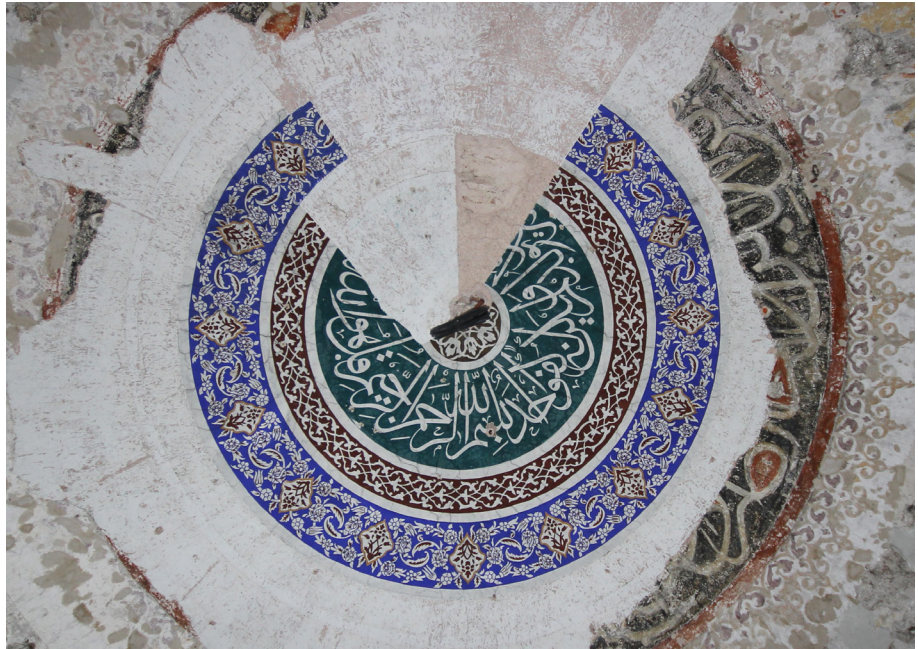
Şekil 1: 1612 tarihli kubbenin göbeğinde ortaya çıkan hat kompozisyonunun izleri.

Caminin farklı tarihlerde inşa edilmiş birimlerine ait kubbelerin cumhuriyet döneminde gerçekleştirilen bir onarımda çimento sıvayla kaplandığı ve klasik dönem üslubunda kalem işleriyle bezendiği gözlenmiştir. Yapılan rasparlarda, göbeğinde celi sülüs hatlı İhlas suresinin, geçmeli rumilerden