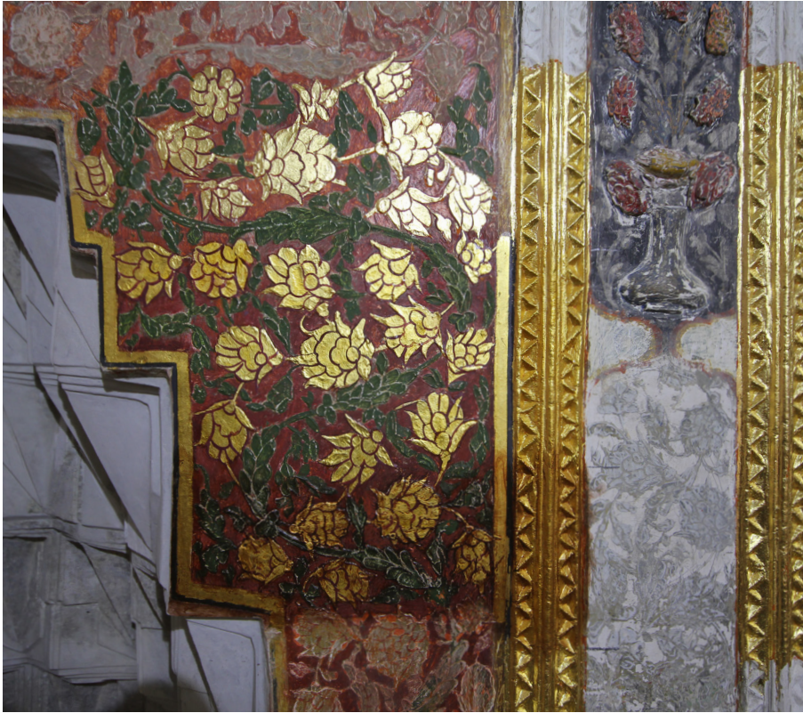
Şekil 3: Mihrapta ortaya çıkan bezeme tabakaları.

ve stilize çiçeklerden oluşan üç bezeme kuşağıyla çevrili olduğu 1538–1539 tarihli kubbeye özgün bezeme tabakasına ait herhangi bir ize rastlanmamıştır. Buna karşılık 1612 tarihli kubbenin göbeğinde, celi sülüs hatlı geniş çaplı bir hat kompozisyonundan geriye kalan, ancak harflerin alt kısımlarının görülebildiği etek kısmı ortaya çıkmıştır (şek. 1). Hattat Mehmet Han Akan, harflerin kalıntılarında hareketle burada Fatıha suresinin yazılı olduğunu keşfederek kompozisyonu, dönemin üslubuna olabildiğince uygun bir şekilde restitüe etmiştir. Göbeğin merkezinde boş kalan yuvarlak yüzeyde, bu birimin inşa edildiği 1612'ye ait herhangi bir ize rastlanmadığı için, caminin diğer birimindeki kubbe göbeğinde bulunan İhlas suresi yazılmıştır (şek. 2).