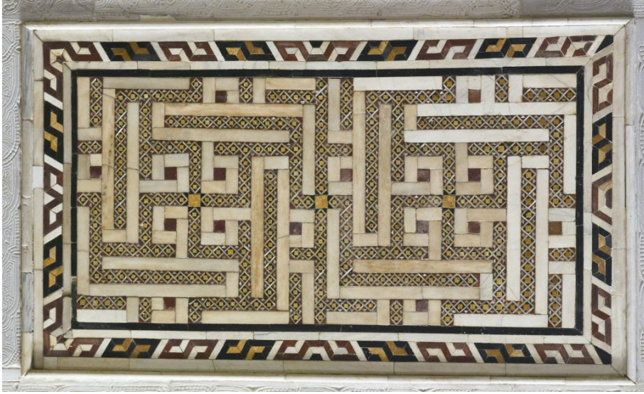
Şekil 9: Kahire’de Sultan Kalavun Külliyesi’nde ma’kılı “Dörder Muhammed ve Ali” terki.

olduğu gibi—taç kapılarda, öte yandan Hasankeyf’te Eyyubî dönemine ait kale kapısı (1420) ile Sultan Süleyman Camii minare kaidesinde (1407) yer alırlar. 3