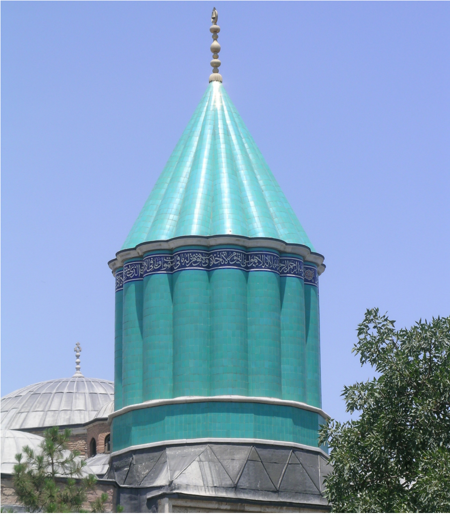
Şekil 16: Konya Mevlânâ Dergâhı'nda Kubbe-i Hadra.

için sürprizlerle doludur. Nitekim söz konusu kaynaktan, Hürrem Sultan'ın âlimlerin yanı sıra tarikat ehline özellikle yakınlık duyduğunu ve onlar için, günümüzde hepsi ortadan kalkmış bulunan birçok zaviye inşa ettirdiğini öğreniyoruz. 14