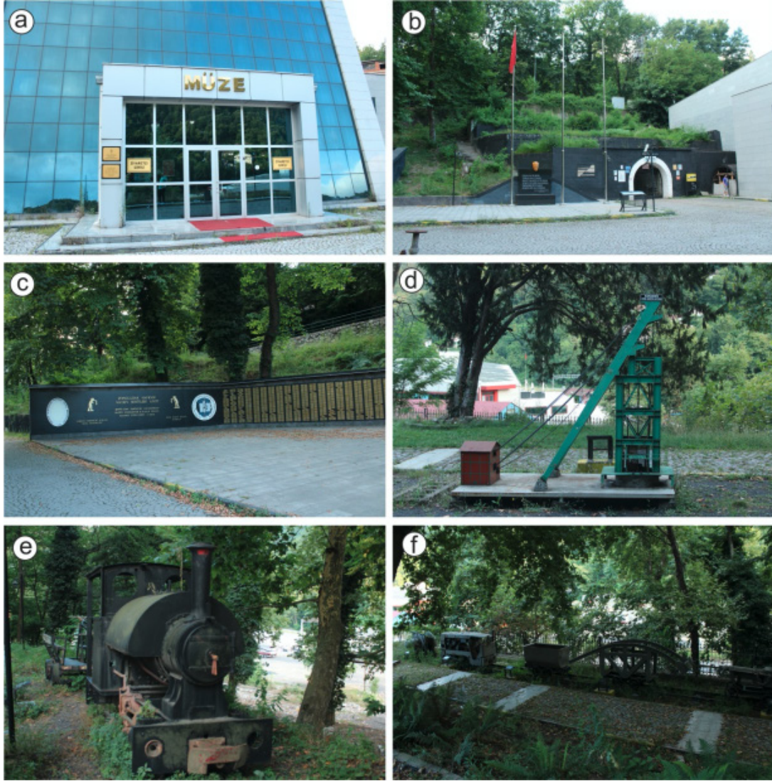
Şekil 8. Maden Müzesi binası (a) ve bahçesinde maden galerisi (b), Zonguldak Maden Şehitleri Anıtı (c), maden kuyusu (d), eski lokomotif (e) ve vagonlardan (f) görüntüleri (foto: Orhan Ceylan, 24 Temmuz 2021)

kadar üretim yapıldıktan sonra maden işçileri için eğitim ocağı olarak kullanılan ve “yaşayan müze” olarak adlandırılan maden ocağını da yetkililer nezaretinde gezerek görme fırsatı bulabilmektedirler (www.haber7.com).