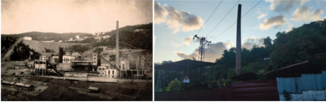
Şekil 9. Kok fabrikasının faal olduğu yıllardan siyah-beyaz bir görüntü ve geriye kalan bacası (foto: Orhan Ceylan, 24 Temmuz 2021)