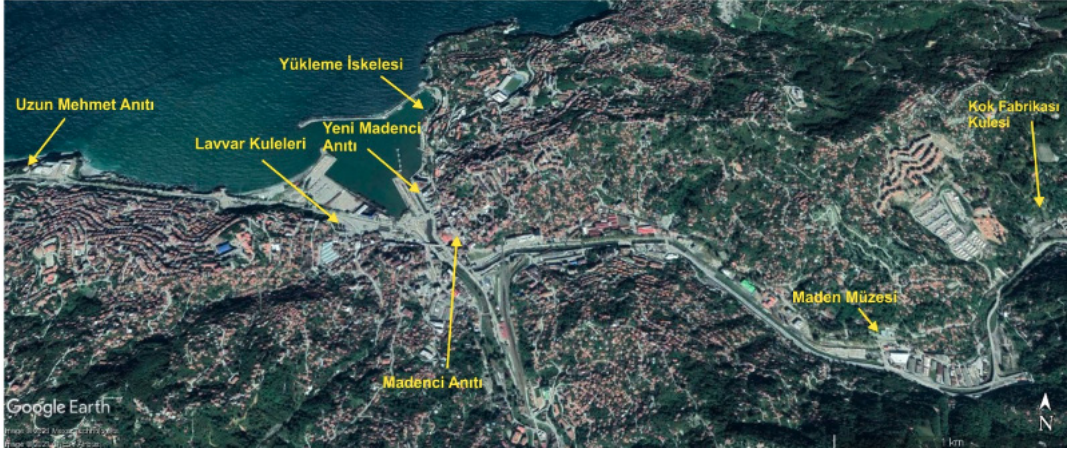
Şekil 2. Zonguldak'ta madencilik tarihine ışık tutan önemli anıt yapıların Google Earth görüntüsünde yerleri