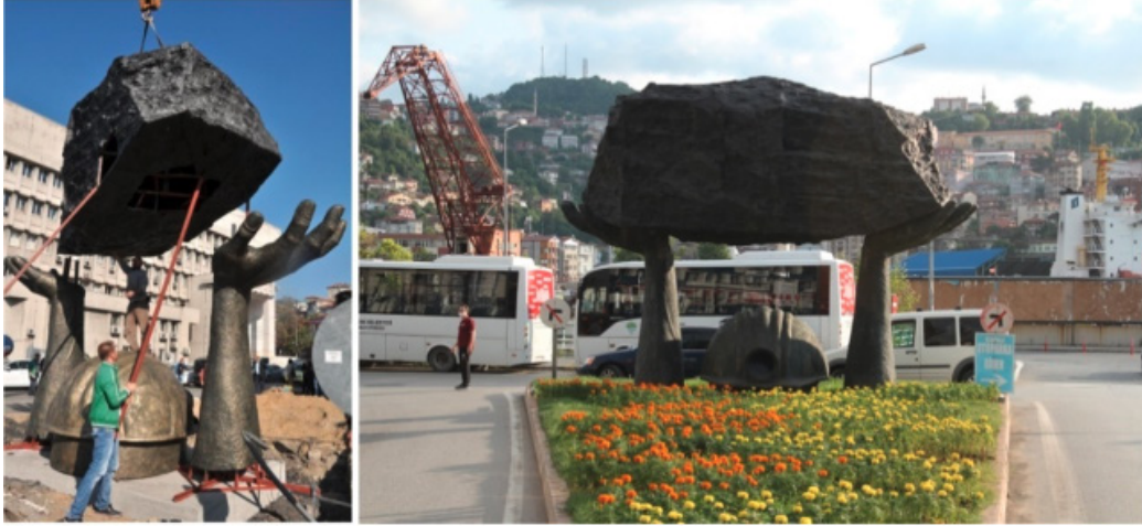
Şekil 7. Zonguldak'ın simgelerinden Yeni Madenci Anıtı'nın 2013 yılında montaj anı (haberler.com) ve günümüzdeki (foto: Orhan Ceylan, 24 Temmuz 2021) hali

civarında olan anıtın içi çelik, dışı fiber malzemeden yapılmıştır. Kömür ise gerçek kömür olmayıp, makettir. Başındaki baret ve ellerindeki dev kömür kütlesi ile maden ocağından çıkan madenciyi tasvir etmektedir. Bu anıt, Gazipaşa Caddesi'ndeki Madenci Anıtı gibi emeği ve kömürü güzel anlatan ikinci anıt olma özelliğini taşımaktadır (haberler.com). Anıt heykelde; boynundan aşağısı toprak altında gömülü olan, iki eliyle yukarıya doğru kaldırıldığı kömür parçasını tutmakta olan bir işçi simgesi yer almaktadır. İşçinin sadece baret ve dirseklerinden itibaren kolu ve elleri görülmektedir. İşçinin başındaki baret ve önünü aydınlatan feneri dikkat çekicidir. Madencinin baretindeki fener ile anıtın ilk yapımında geceleri şehrin bu noktasının aydınlatılarak maden ocağının temsili amaçlanmış ancak sonradan kullanılmamıştır (Oral, 2017).