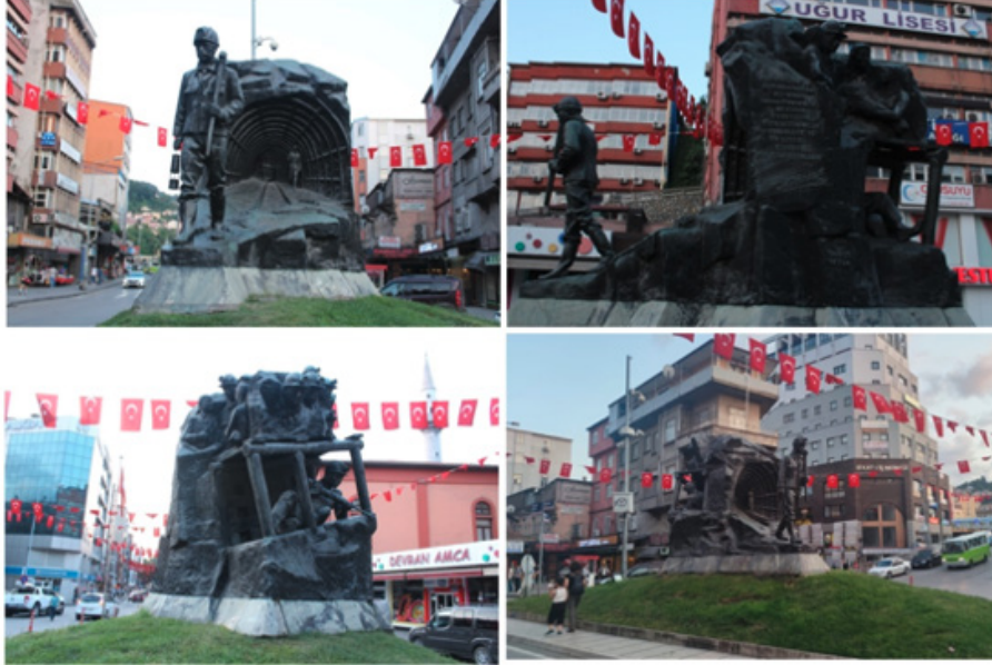
Şekil 6. Madenci Anıtı'nın dört tarafından görüntüler (foto: Orhan Ceylan, 24 Temmuz 2021)