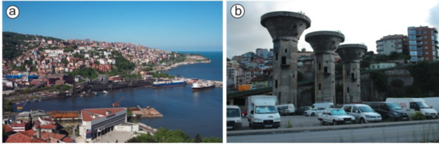
Şekil 4.a) Lavvar tesislerinin yıkılmadan önceki hali (arkitera.com) ve b) günümüzde anıt olarak bırakılan kuleleri (foto: Orhan Ceylan, 24 Temmuz 2021)

Zonguldak şehir merkezinin Soğuksu bölgesi tarafında (üzülmez Deresi'nin batı tarafı) Ereğli Kömürleri İşletmesi (EKİ) tarafından 1957 yılında o zamanki teknoloji ile kurulan (İmamoğlu 2009) ve zamanla modernize edilen lavvar tesisi ekonomik ömrünü tamamladığı gerekçesiyle 2006 yılında başlayan yıkım işlemleri 2012 yılında sona ermiştir. “Taşınmaz kültür varlığı” olarak tescili istemiyle Karabük Kültür ve Tabiat Varlıklarını Koruma Bölge Kurulu'na başvurulmuş ve kurul yıkımdan arta kalan bir yapı, üç kule ve yeraltı silolarını tescil etmiştir (www.sabah.com.tr). Tescil edilen yapılardan biri olan Zonguldak Merkez Lavvar Kuleleri limanının inşasıyla birlikte kömür arıtma ve yükleme tesisleri kapsamında inşa edilmiştir. Merkez lavvarı kömür yıkama tesislerinde çeşitli eleme işlemleri sonrasında biriken sular içinde bulunan 0.5 mm'den küçük “şlam” kömürleri önce dekantasyon (aktarma) kulelerinde çöktürüldükten sonra, flotasyon (kömür taneciklerinin yüzdürülmesi) ile köpük halinde toplanır ve vakum filtrelerinden geçirildikten sonra, 0.5 -6 mm. kömürlere karıştırılırdı. Bu ayrıştırma işleminde bugün anıt gibi karşımızda olan üç kule (Şekil 4) kullanılmaktaydı (pusulagazetesi.com.tr).