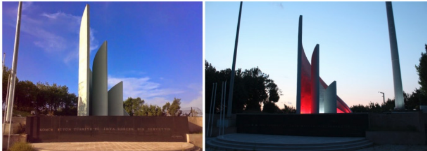
Şekil 5. Uzun Mehmet Anıtı'nın eski (kulturpotali.gov.tr) ve ışıklandırılmış yeni hali