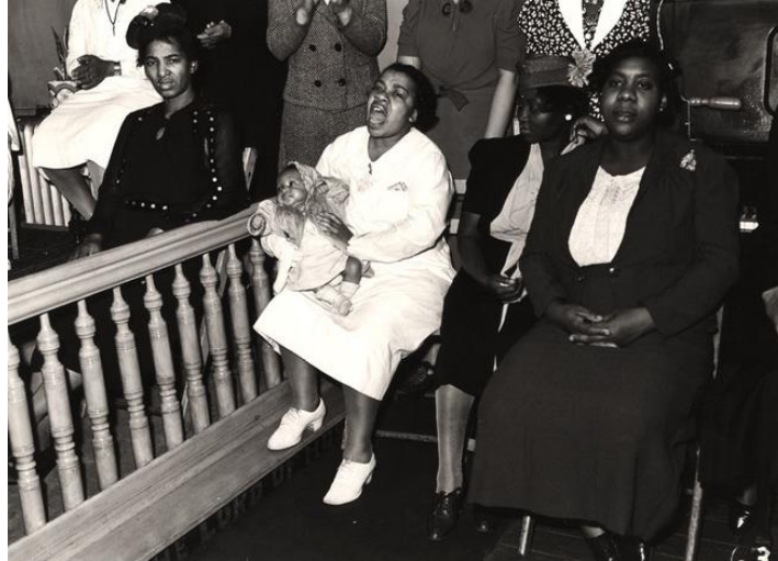
Şekil 11 Aaron Siskind'in Harlem Document isimli kitabından "Harlem Church Interior"

Harlem Leydisi olarak isimlendirilen bu fotoğrafta, kadın figürün takım ceket ve etek giydiği görülmektedir. Koyu renkli ceketin ve açık renkli gömleğin oluşturduğu kontrast ve resmi atmosfer, ceketin sol tarafına aplike edilen aksesuar ile yumuşatılmıştır. Aksesuar olarak ayakkabı görülmesi de yüzükler ve küpe dikkat çekmektedir.