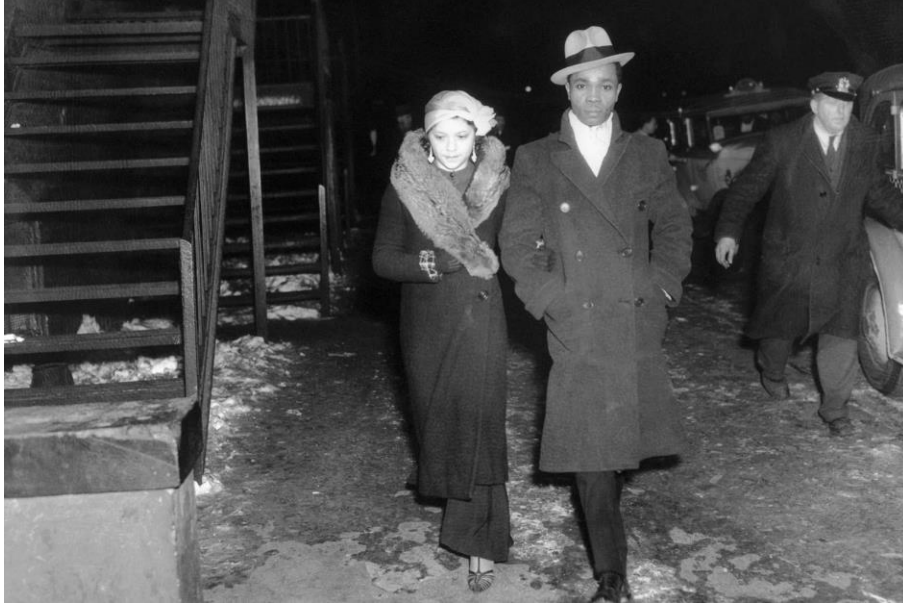
Şekil 4 Club 66'da yapılan bir partiden ayrılan bir çift- (1935)