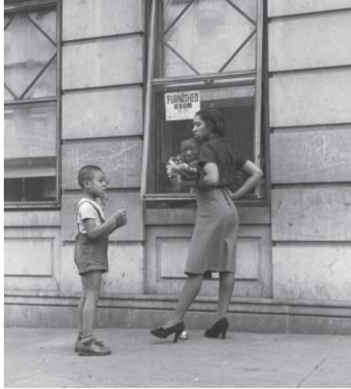
Şekil 8 Aaron Siskind'in Harlem Document isimli kitabından “Most Crowded Blok in the World” – (1940-1941)