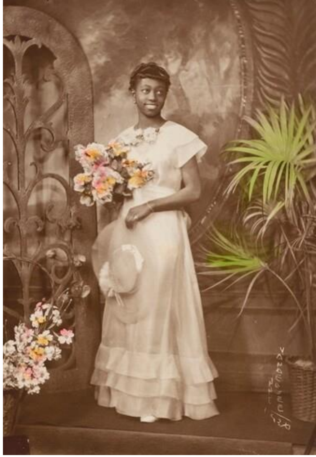
Şekil 17 James Van Der Zee, Genç Bir Kadının Portresi (1930)

Düğmeli ve muhtemelen dik yakalı bir gömlek giyen bu figür, yürürken fotoğraflanmıştır. Elinde mantosunu tuttuğu görülmektedir. Eteği diz altı boydadır. Şapkası vardır. İncelenen diğer kadın figürlerin giyimleri ile benzerlik göstermektedir