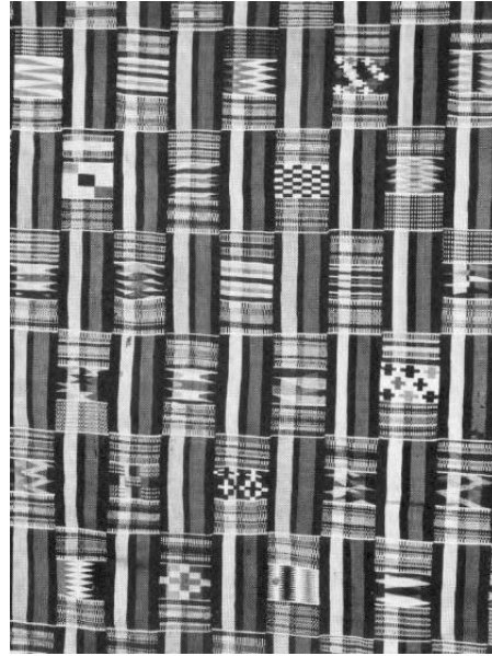
Şekil 1 Çözgü şeritli geleneksel bir dokuma kumaş

Harlem Dönemi öncesinde varlığı bilinen “Negro cloth” olarak geçen ve Türkçeye “siyahi kumaş” olarak çevrilebilecek olan bu kumaştan pek çok kıyafet dikildiği bilinmektedir. Bu kumaş, düz dokunmuş, kalın, boyasız ya da boyanmışsa da kahverengi boyanmıştır. Aynı zamanda bu tanım belirsizdir. “Negro cloth” sözlükte köleler tarafından giyilen siyahi kumaş olarak tanımlanırken, Amerika’daki Tekstiller 1650-1870 kitabının yazarı Florence Montgomery, “Batı Hint Adaları ve güney kolonilerinde köleleri giydirmek için kullanılan kalın, ev yapımı bir kumaş” olarak tanımlamakta; Fairchild Tekstil Sözlüğü, bu kumaşın 17. ve 18. yüzyıllarda İngiltere’den ithal edilen pamuk ve kenevir karışımı bir kumaş olduğunu yazmakta ve 19. yüzyılın başlarında bu kumaşın Amerikanlar tarafından da üretilmeye başlandığını, Türkiye’den ithal edilen yün ile kumaş kalınlaştırdıklarını ifade etmektedir. Bütün bu tanımlamalardan “Negro cloth” olarak isimlendirilen bu kumaşın, pamuk ile yün karışımlarından yapıldığı ve köleleştirilmiş kişilerin özelinde kullanıldığı bilinmektedir. (Knowles, 2014, s:46). Bu bilgilere ek olarak, Knowles (2014, s:100), “köleler Amerikan tekstillerinin üreticileri ve tüketicileriydi ve Amerikan modasına katkıda bulundular” ifadesine yer vermiştir.