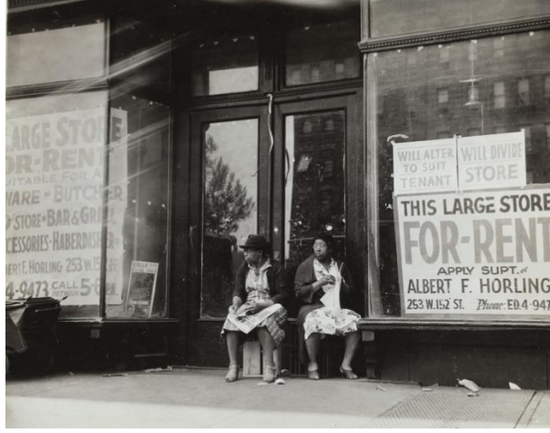
Şekil 15 Harlem'de yol kenarında oturan iki kadın (1935-1939)

Üç kadın figürün bulunduğu bu fotoğraf da Harlem'de çekilmiştir. Soldaki kadın figür elbise giyerken, sağdaki figürler bluz, ceket ve etek giymektedirler. Elbisenin kolları kısadır ve çiçek desenleri vardır. Kadınların etekleri hem kendi içinde birbirine benzemekte hem de incelenen diğer fotoğraflardaki uzunluk ile benzemektedir.