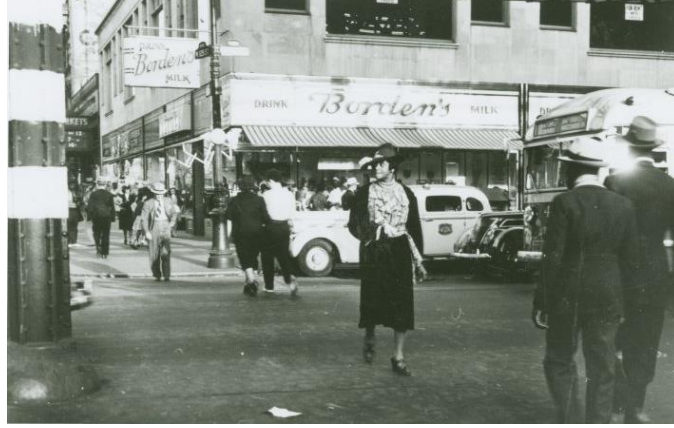
Şekil 13 Harlem 125. Caddede karşıda karşıya geçen bir kadın (1937)

Fotoğraftan kesin olarak renk çıkarımı yapılamamakla birlikte, soldaki iki figürün sağdaki figüre göre koyu renkler tercih ettikleri seçilebilmektedir. Figürlerin günlük sadelikten uzak olması, Harlem Dönemi'nin görkemiyle örtüşmektedir. Üç farklı elbisenin de üç farklı mantonun da aynı boylarda olması dönemin modası hakkında bilgi vermektedir.