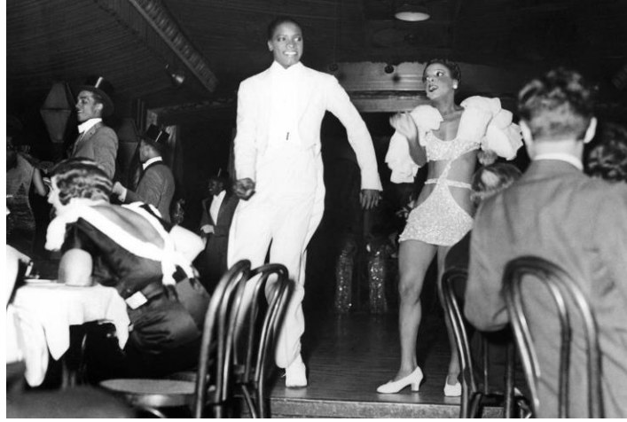
Şekil 5 Harlem's Cotton Club'da bir sahne performansı – (1934)