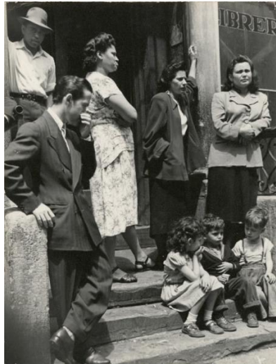
Şekil 14 Doğu Harlem'de sokakta oturan bir grup insan (1947-1951)

1937 yılında çekilen bu fotoğrafta bir kadının sokakta yürüdüğü, karşıdan karşıya geçtiği görülmektedir. Fırfırlı bir bluz, diz altı bir etek giydiği ve üstüne de bir mont almıştır. Ayakkabıları bantlı ve topukludur, diğer kadın giyimlerinde olduğu gibi şapkası vardır ve aksesuar olarak kullandığı iki sıra inci kolyesi görünmektedir.