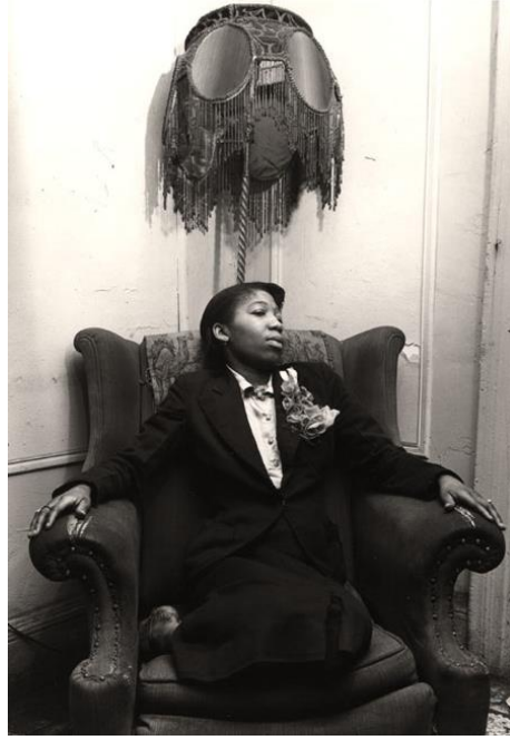
Şekil 10 Aaron Siskind'in Harlem Document isimli kitabından "Harlem Lady and Lamp"