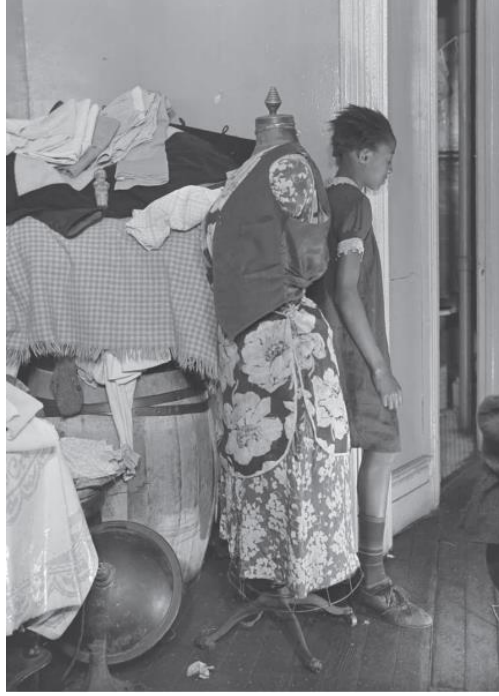
Şekil 7 Aaron Siskind'in Harlem Document isimli kitabından "Storeroom: There's a Rat in There" – (1934-1940)

Zora Neale Hurston'un fotoğrafta bir davette olduğu görülmektedir. Bu davetin kitap tanıtımı ya da kitap fuarı olduğu düşünülmektedir. Elinde bir antoloji tutmaktadır. Fascinator ismi verilen tüllü bir şapka takmaktadır. Şekil 4'teki figür gibi eldiven kullanmaktadır. Elbisesi brokar kumaştandır ve parlamaktadır. Elbisenin kolları karpuz kol modeli ile biçilmiştir. Yakası kapalı bir yaka olup, ortasından büzülmüştür ve büzüldüğü yere toka ya da taş takılmıştır. Eldiven ve şapka dışında, aksesuar olarak bileklik, çanta ve kemer görülmektedir. Parlak elbise tercihi ve aksesuar kullanımı ile Zora Neale Hurston, dönemin davetleri veya özel günlerinde giyilen kıyafetler hakkında fikir vermektedir.