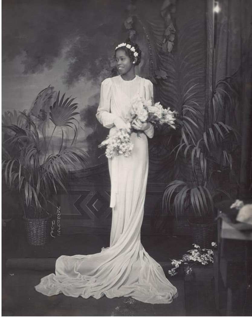
Şekil 18 James Van Der Zee, Güzel Gelin (1930)