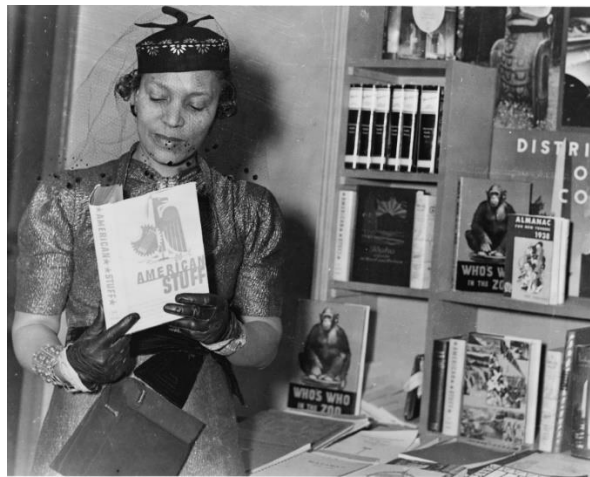
Şekil 6 Zora Neale Hurston – (1937)

Harlem'de bulunan bir eğlence kulübünde fotoğraflanan bu sahne, bir performansı anlatmaktadır. Performans sanatı gereğince, fotoğrafın sağ tarafında konumlanan kadın figürün kostüm giydiği görülmektedir.. Kostüm, parlak ve muhtemelen açık renkli bir kumaştan dikilmiştir; kollarında kat kat volanlar mevcuttur; kısa topuklu ayakkabı ile kostüm tamamlanmıştır. Fotoğrafın solunda arkası dönük şekilde oturan kadın figürün koyu renk saten kumaştan bir elbise giydiği ve sahnedeki figürün aksine, performansın bir parçası olmadığı düşünülmektedir. İzleyici olduğu düşünülen bu kadın figürün, giyim tercihleri dönemin gece hayatı giyimine dair fikir vermektedir. Saten elbisenin boyu görülmemekle birlikte, belinde bir kemer olduğu seçilmektedir. Elbisenin tamamı biri açık biri koyu olan iki kontrast renkten oluşmaktadır. Kemerin köprülerinin açık renkte olduğu fakat kemerin koyu renkte olduğu; derin sırt dekoltesinin kalın biyeler ile vurgulandığı görülmektedir.