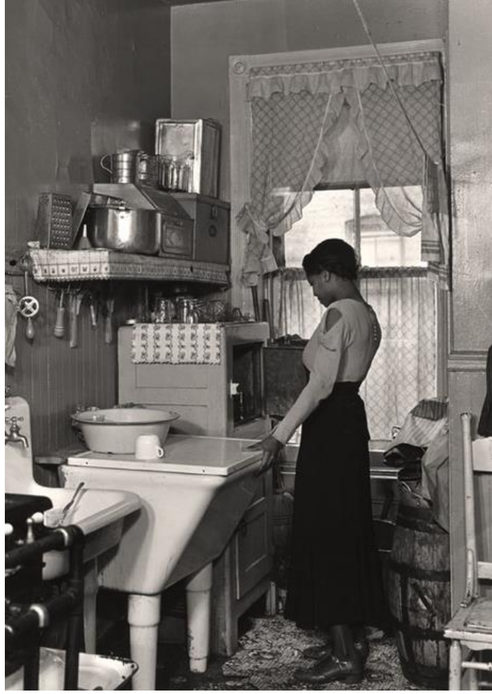
Şekil 9 Aaron Siskind'in Harlem Document isimli kitabından "Woman Lookinf Into Icebox" – (1937-1939)

Kaynak: ( https://www.icp.org/browse/archive/objects/woman-looking-into-icebox-1937-1939 , Erişim Tarihi: 8 Ekim 2021)