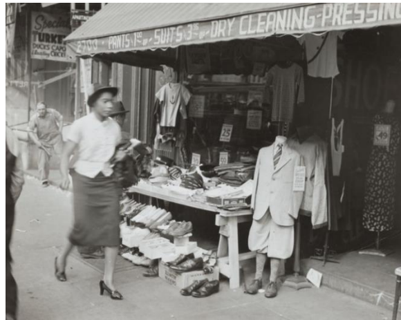
Şekil 16 Harlem'de kuru temizlemecinin önünden geçen bir kadın (1937)

Kıralık bir dükkânın önünde oturan iki kadın figür görülmektedir. Her iki figür de elbise giymektedir. Elbiselerden birisi çiçek desenlerinden oluşurken bir diğeri geometrik desenlerden oluşmaktadır. Her iki kadının da elbisenin üstüne hırka/ceket giydikleri seçilmektedir. Soldaki figürün hırkasının düğmeleri görülmektedir. Topuklu ayakkabıları ve şapkaları vardır. Gazete okuyor olmaları, günlük yaşam aktivitesi yaptıklarını göstermekte ve dönemin günlük giyimi ile ilgili fikir vermektedir.