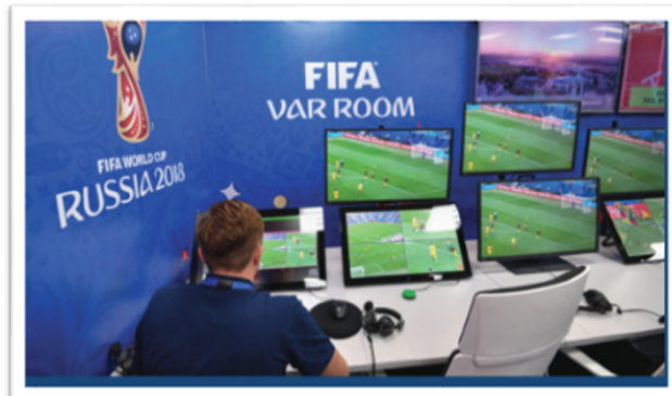
Şekil 1. (TFF, 2022)

Futbol maçları video operasyon odasındaki (VOR) ekranlarından izlenmektedir. VAR sistemi genellikle oyunun seyrini değiştiren (kırmızı kart, gol, penaltı, yanlış oyuncuya kart) durumlarda herhangi potansiyel bir hata yapıp yapılmadığının tespit edilmesine yardımcı olmaktadır. Ciddi bir ihlalin yapıp yapılmadığını görmek için her durum otomatik olarak kontrol edilmektedir. Ciddi bir ihlal yapılmadığı durumlarda hakemle iletişime geçilmemektedir. Bu duruma "sessiz kontrol" ismi verilmektedir. Ancak yapılan kontroller olayın incelenmesini işaret etmesi durumunda hakeme acilen bilgi verilmektedir. Eğer hakem önemli bir olayın gözden kaçmış olduğundan şüphelenirse inceleme talebinde bulunabilmektedir.