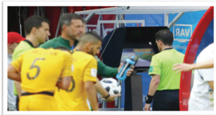
Şekil 3. (TFF, 2022)