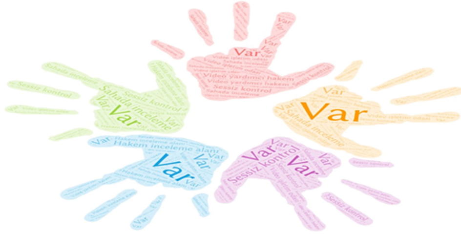
Şekil 4. VAR Sistemi ile İlgili Kelime Bulutu

Video işletim odası: Stadyumun merkezi bir konumunda maçın görüntülerinin izlendiği alandır (TFF, 2022).