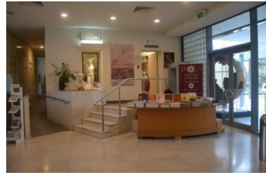
Selanik Arkeoloji Müzesi