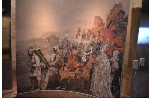
Beyaz Kule'de Osmanlı Yaşamına Dair Bir Kesit