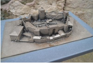
Yedi Kule Hisarı Maketi