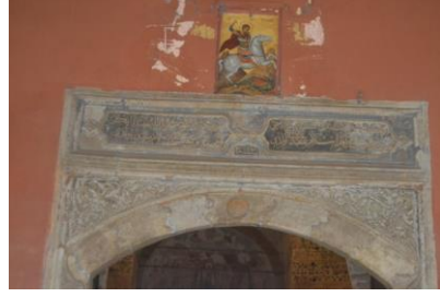
Rotonda'nın Giriş Kitabesi

Yol boyu rastladığımız birçok tarihi kilisenin yanındaki minare kaidesinden bunların da daha önce camiye çevrildiğini anlıyorduk. Bu tarihi yapılar yeni yapılan binaların arasında sıkışmış halde duruyorlardı. Şehrin merkezinde yer alan Aziz Dimitri Kilisesi, gördüğümüz diğer yapılara göre daha şanslıydı. Zira etrafında bir miktar avlu bulunuyordu. Bu kilise de bir dönem cami olarak kullanılmıştı.