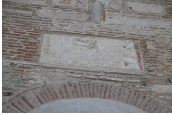
Yedikule Hisarı Girişi ve Kitabesi