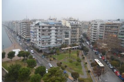
Beyaz Kule'den Görülen Manzara

En üst katta ise bir kitap ve hediyelik satış yeri vardı. Burçtan Selanik'e baktığımızda yağmur altında gördüğümüz manzara hiç güzel değildi. Osmanlı dönemindeki eski fotoğraflardaki şehrin görüntüsünün daha güzel olduğu anlaşılıyordu. Yunanlılar da bizim gibi yapmışlar, kimliksiz binalar ile şehrin silüetini bozmuşlar. Tarihi eserler ise vitrindeki biblo misali kötü binaların arasında hala varlıklarını sürdürmeye devam ediyorlardı. Beyaz Kule'nin çıkışında uğradığımız küçük büfede muhtelif tarih dergileri dikkatimizi çekmişti. Birisinin üzerindeki İstanbul kuşatmasının yer aldığı resmin Panorama 1453'ten alındığını gördüm.