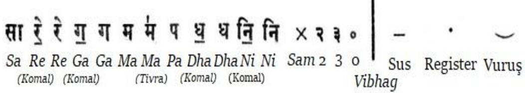
Şekil 5: Bhatkhande Sisteminde Temel İşaretlemler

Bhatkhande sistemi gerçek anlamda bir incelik ve sadelik numunesidir. Nota ( swar ) adlandırmalarında ilk heceleri ( Sa, Re, Ga, Ma gibi) yazılır. Pestleştirilmiş notalar ( komal swar ), altına çizilen yatay, tizleşebilen ( tivra ) ise üstüne dikey kısa bir çizgiyle belirtilir. Ritmik kalıplarda uygulanan el vuruşları rakamlarla işaretlenmiştir. Bunun yanında, ilk vuruş ( sam ) “x”, “boş” vuruş ( khali ) için sıfır sayısı kullanılır. Ölçüler ( vibhag ) birbirinden dikey çizgilerle ayrılırlar. Sus işareti için tire, ses alanını ( register ) belirtmek için notanın üstüne veya altına nokta konulur. Notanın altındaki yarım ay biçiminde kavisli çizgiyle bölümlü vuruşlar ( matra ) belirtilir (Nayar, 1989).