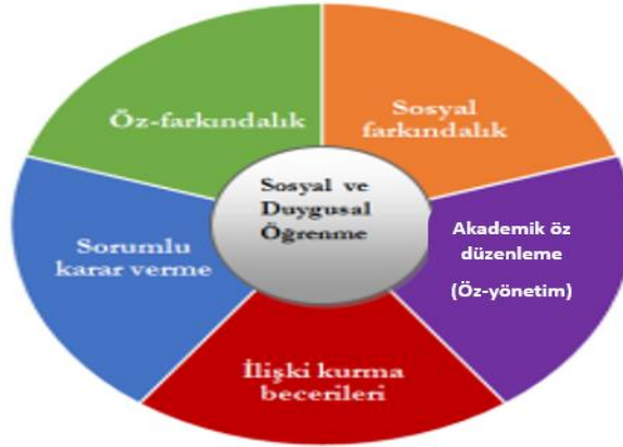
Şekil 1. Sosyal duygusal öğrenme değişkenleri (Totan, 2014, s. 62 esas alınarak hazırlanmıştır.)

Şekil 1'e bakıldığında sosyal duygusal öğrenmenin öz farkındalık, sosyal farkındalık, akademik öz düzenleme (öz yönetim), ilişki kurma becerileri ve sorumlu karar verme olmak üzere beş değişkenden oluştuğu görülmektedir.