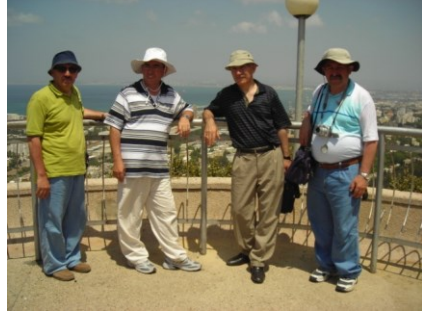
Yafa ve Hayfa'dan Kesitler