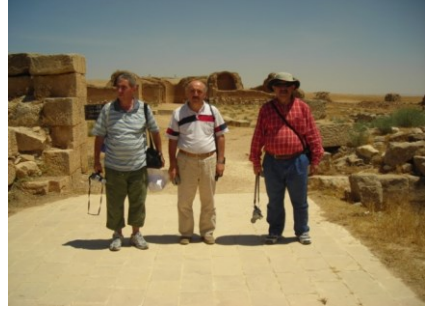
Mıřatta Sarayı (Ürdün 2007)