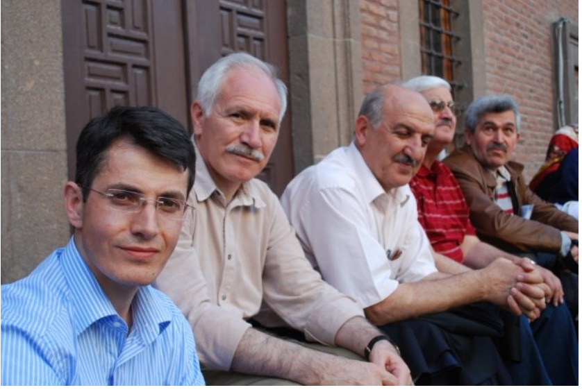
2009 Yılı İslam Tarihçileri Kolokyumu Gezisi