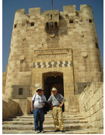
Halep Kalesi Giriş (Suriye)