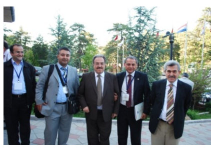
VI. İslam Tarihi Anabilim Dallarını Koordinasyon Toplantısı 2009