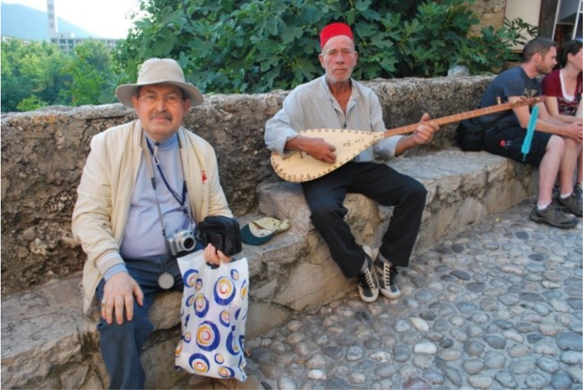
Blagay Tekkesi ve Mostar (Bosna Hersek)