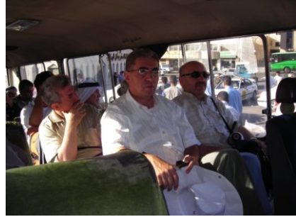
Suriye ve Ürdün Yollarında