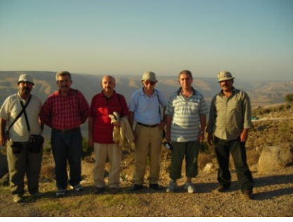
Ummu Kays'dan Yermuk Vadisi (Ürdün)