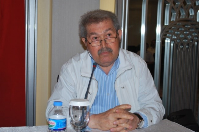
Bursa İslam Tarihçileri Kolokyumu (2013)