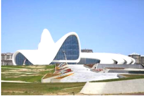
Resim 32. Heydar Aliyev Merkezi, Zaha Hadid Architects

Kenti çekim merkezi yapmanın popüler yöntemlerinden biri, yıldız mimarların tasarladığı heykelsi formuyla dikkat çeken ikonik bir yapıyı kente kazandırmaktır. Zaha Hadid'in tasarlamış olduğu Heydar Aliyev Merkezi zeminden yükselen beyaz rengiyle kum rengi Bakü Taşıyla zıtlık oluşturmaktadır. Hazar denizinin dalgalarına ya da bir halının silkelenmesinin donmuş görüntüsüne benzetilen Heydar Aliyev Merkezi Bakü'nün küresel ve modern kent imgesinin ikon yapılarından biri olmuştur.(Resim 32)