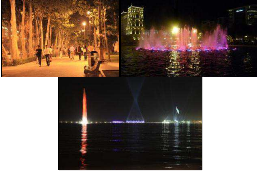
Resim 23.24.25.26.27. Bakü'nün kentle bütünleşen ve gece gündüz yaşayan uzun sahil şeridi, sahil şeridini sonlandıran Bayrak Meydanı, Kristal Salon ve denizde gerçekleştirilen su oyunları