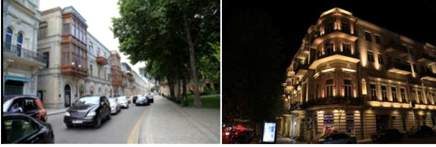
Resim 21.22.Neftçiler Bulvarı ve kente yaşam ve kimlik kazandıran gece aydınlatması