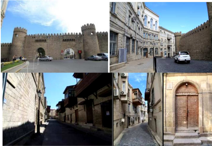
Resim 7.8.9.10.11. İçeri Şehir kapıları ve 1806'da Ruslar tarafından restore edilen surlar, surların dışında yer alan 19. Yüzyıla ait kum rengi Bakü taşından yapılmış neoklasik yapılar; İçeri Şehirde ahşap cumbaları ve künde-kari kapılarıyla Türk İslam mimarisinin dilini kullanan tarihi yapılarıyla dar sokaklar

Kentin güçlü, simgesel kimlik öğeleri olarak kent dokusu içerisinde 12. Yüzyıla tarihlenen sur duvarları ve burçlarıyla dar sokaklardan oluşan İçeri Şehir dikkat çekmektedir. UNESCO Dünya Kültür Mirası Listesinde yer alan 12. Yüzyıldan kalma ortaçağ şehri, dar sokakları, camileri, mescitleri, medreseleri, sarayları, kervansarayları ve halı mağazalarına, butik otellere, restoranlara dönüştürülmüş tarihi yapılarıyla canlı bir merkezdir. İçeri Şehirde yer alan Selçuklu izleri taşıyan Şirvanşahlar Sarayı, Divanhane, Şah Camisi, Şark Kapısı, Şirvanşah ailesinin Türbesi, KeyKubad Mescidi ve Saray Hamamının kalıntılarından oluşmaktadır.(Resim 7-15)