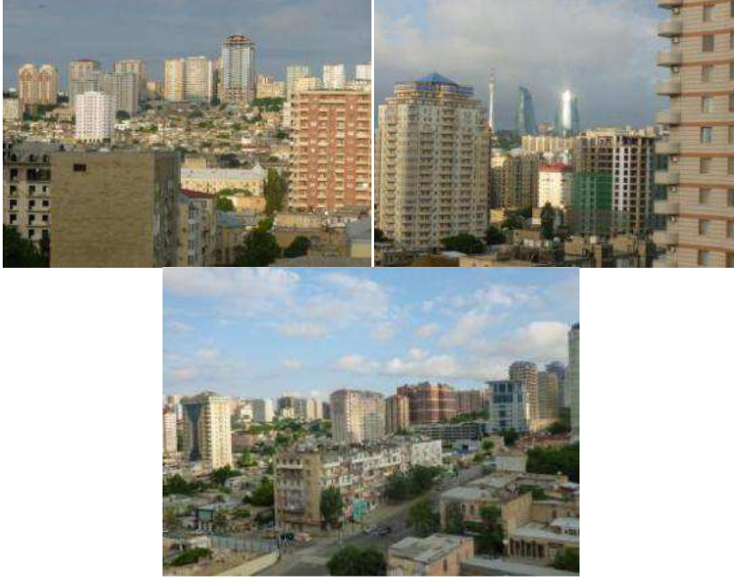
Resim 36.37.38. Kentin yeni imajına henüz katılmamış gecekondü bölgeleri

Not: Fotoğraflar aksi belirtilmedikçe yazara aittir.