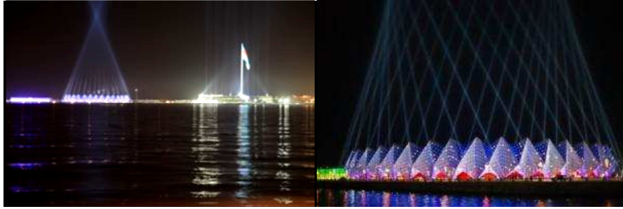
Resim 28.29.Sahil şeridini sonlandıran Bayrak Meydanı ve Kristal Salon (Resim 29. Foto: Niyaz Najafov URL-4)

Küresel formuyla ikonik bir yapı olan Kristal Salon, 2012 Eurovision Şarkı Yarışması için çok kısa bir sürede sahil şeridinde inşa edilmiştir. 80.000 LED lamba ile donatılan Kristal Salonun membran panelleri, 6000 farklı renk ile geceleri kristal parçalarıyla kente ışık yayan bir fenere dönüşmektedir. (URL-3).(Resim 28-29)