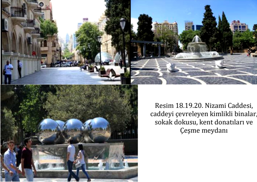
Resim 18.19.20. Nizami Caddesi, caddeyi çevreleyen kimlikli binalar, sokak dokusu, kent donatıları ve Çeşme meydanı

Bakü kıyı şeridinde paralel konumlanan Bakü Bulvarı, Neftçiler Bulvarı, Nizami Caddeleri ve Çeşme Meydanı, Azadlık Meydanı gibi düğüm noktaları oluşturan meydanlar kenti tanımlı ve okunaklı hale getirmekte kimlik mekanları oluşturmaktadır. Lüks mağazalar içeren bakımlı binaların sahil şeridinin hemen ardında sıralandığı geniş kaldırımlarıyla yaya dolaşımına olanak tanıyan Neftçiler Bulvarı, gece aydınlatmasıyla kent merkezinde hafızalarda güçlü bir yer edinmektedir. Kentlerde çekim merkezi oluşturmamanın bir diğer yolu da şehir merkezlerinde yayalaştırılan alanlardır. Araç trafiğine kapalı olan Nizami Caddesi, caddeyi çevreleyen kimlikli binaları, sokak dokusu, kent donatıları, havuzları, ağaçları, fiskeyeleri, heykelleri ile kentin güçlü bir çekim merkezi olmuştur.(Resim 18-22)