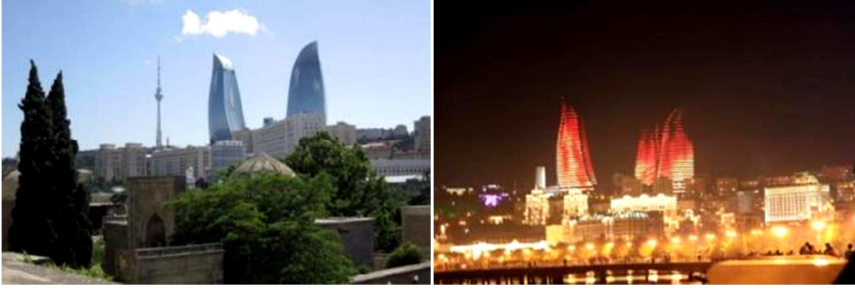
Resim 30.31. Şirvanşah Sarayından Alev Kuleleri ve gece kente heyecan katan alev kuleleri