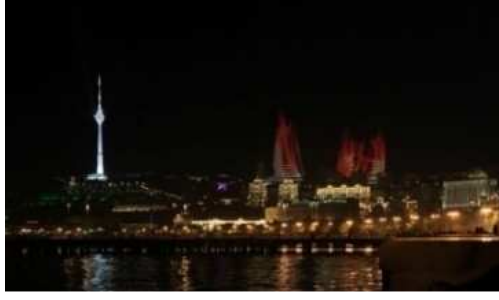
Resim 33.34.35. Kentin gece aydınlatmasıyla heyecanlanan hayatı