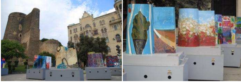
Resim 16.17. Kız Kulesi (Gız Galası) ve Kız Kulesi önünde 2012 Eurovision Şarkı Yarışması için düzenlenen sanatsal etkinlikler (Güçlü kimliksel imgesiyle Kız Kulesi, 2012 Eurovision Şarkı Yarışması için kentte düzenlenen sanatsal etkinliklerde, Eurovision'a katılan ülkelerin sanatçılarına formuyla tuval olmuştur)

Rossi (2006), anıtları, şehirde kalıcılıkları olan birincil öğeler, şehre karakterini veren kentsel artefaktlar olarak tanımlamaktadır. Kent mekanlarında anlamı, kimliği ve yönelimi güçlendiren, anıtlar ve kamusal sanat uygulamaları, kentsel yaşamda süreklilik duygusu oluşturur ve yerleşik olma duygusunu desteklerler (Oktay, 2011, ss.13).IV-VI yüzyıllarda inşa edildiği düşünülen silindirik kuleye bitişik dikdörtgen blok formuyla Kız Kulesi (Gız Galası) kentin simgelerinden biridir. Dramatik efsanelerine ithafen operalar yazılmış ve birçok kültür sanat etkinliğinde kent simgesi olarak kullanılmıştır. (Resim 16-17)