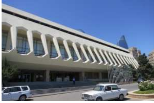
Resim 2.3.4.5.6.Farklı dönemlere ait neoklasik, gotik, eklektik, modern binalar; Âlimler Evi, İsmailiye Evi (1913), Azerbaycan Devlet Kukla Tiyatrosu (1910), Haydar Aliyev Sarayı (1972), Gülistan Sarayı (1980)

Kentin güçlü, simgesel kimlik öğeleri olarak kent dokusu içerisinde 12. Yüzyıla tarihlenen sur duvarları ve burçlarıyla dar sokaklardan oluşan İçeri Şehir dikkat çekmektedir. UNESCO Dünya Kültür Mirası Listesinde yer alan 12. Yüzyıldan kalma ortaçağ şehri, dar sokakları, camileri, mescitleri, medreseleri, sarayları, kervansarayları ve halı mağazalarına, butik otellere, restoranlara dönüştürülmüş tarihi yapılarıyla canlı bir merkezdir. İçeri Şehirde yer alan Selçuklu izleri taşıyan Şirvanşahlar Sarayı, Divanhane, Şah Camisi, Şark Kapısı, Şirvanşah ailesinin Türbesi, KeyKubad Mescidi ve Saray Hamamının kalıntılarından oluşmaktadır.(Resim 7-15)