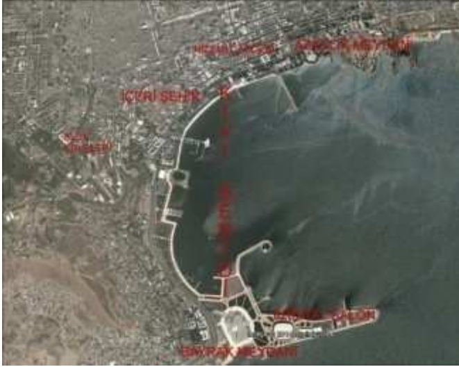
Resim 1. Bakü kıyı şeridi (URL-1)

1990'lı yılların başında bağımsız Azerbaycan Cumhuriyeti'nin siyasi, ekonomik, kültürel hayatında yaşanan değişikliklere bağlı olarak, Bakü'nün merkezinde Sovyet Mimarisi dönemi sona ermiş ve önemli değişiklikler meydana gelmiştir. 1990'lı yılların karakteristik özelliği ise üslup serbestliği olmuştur. Günümüzde ise çoğulcu bir yaklaşımla, klasik ve milli mirasa ait öğelerle sentezlenen eklektik tarzlar vehi-tech binalar kent merkezinde çoğalmaktadır (Mehriban ve Ayışa, 2014; Sadri, 2009).(Resim 2-6)