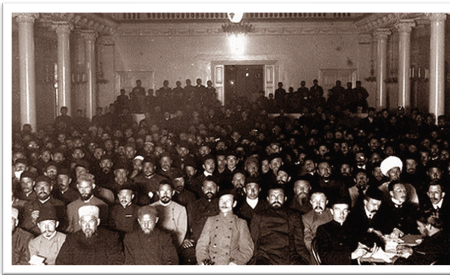
Birinci Müslümanlar Kongresi 1917