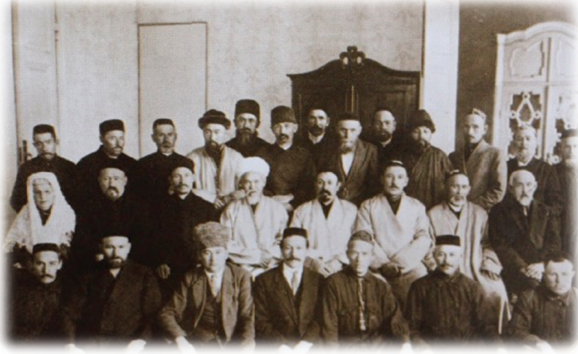
Müslümanların Din İdaresinin Üyeleri (Ufa-1926)