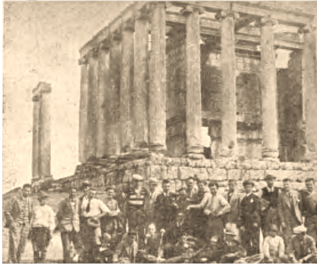
Şekil 1. Halkevlerinin tarih kolunun düzenlediği bir gezi

Halkevleri örgütsel olarak dokuz şubeden oluşuyordu: dil, tarih ve edebiyat şubesi, güzel sanatlar şubesi, temsil şubesi, spor şubesi, içtimai yardım şubesi, halk dersaneleri ve kurslar şubesi, kütüphane ve neşriyat şubesi, köycüler şubesi, müze ve sergi şubesi. Bu çalışmanın konusunu teşkil eden İnkılap müzesi ve sergileri tarih ve müze şubesinin faaliyetleriydi. Bu şubenin müzecilik kolunun esas olarak üç temel vazifesi vardı: bulunduğu mahaldeki tarihi eserlerin ve anıtların korunması hakkında resmî makamlara bilgi vermek, mevcut müzelere katkı sağlamak veya müze yoksa kurulmasına önayak olmak, giysi ve silah gibi etnografik eserleri ve minyatür ile halı gibi kültürel eserleri bir araya getirmek. Şubenin sergi kolu ise resim ve heykel gibi sanatsal eserleri halkevi binası dahilinde halka tanıttak ve yerli malı ürünleri sergileyecekti. 28 Müze ve sergi şubesi halkta yerel ve ulusal tarihe karşı ilgi uyandırarak onların kültürel ve sosyal anlamda kalkınmalarını ve bilinçlenmelerini ilerlemelerini sağlayacağı düşünülüyordu.