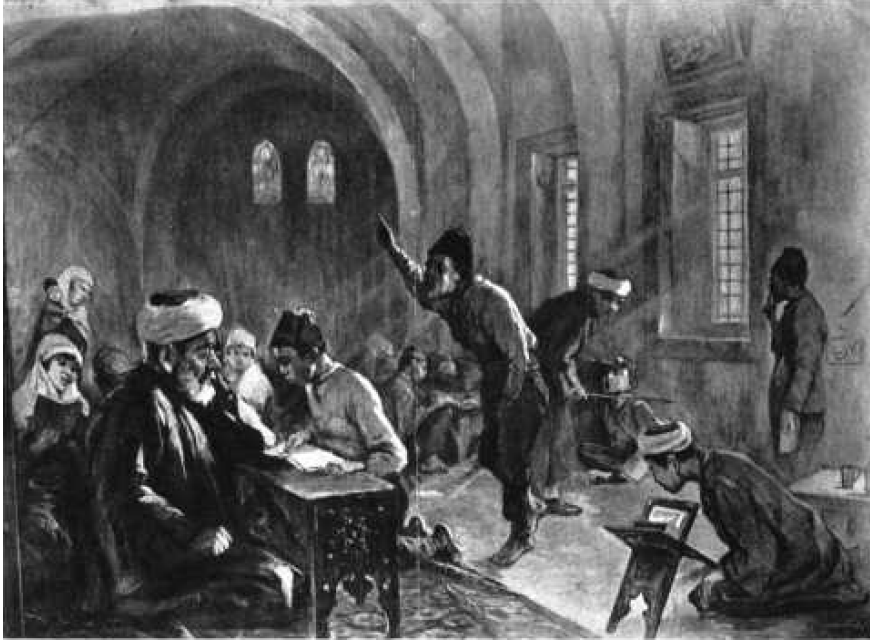
Şekil 3. Ressam Ali Sami'nin İnkılap Serisi adı altında yaptığı tablolarından biri

Ankara Halkevi'ndeki müzenin tesis edilebilmesi için gereken eşyaların bir araya toplanabilmesi için hummalı bir faaliyet yürütüldü. Buradaki müzede Heykeltraş Nusret (Suman) Bey'den yeni devleti kuranların Erkan-ı Harbiye eski dairesinde bir masa etrafında toplantı halindeyken yapılmış heykellerinin yapılması istendi. Yine Hakimiyet-i Milliye'nin fotoğrafçısı olan Cemal Bey'den inkılabın safhalarını gösteren fotoğraflar talep edildi. Halkevi, Türkiye Büyük Millet Meclisi ile temasa geçilerek idare amiri olan Çoruh milletvekili Mehmet Ali Bey'den kürsü, koltuk sandalye gibi eşyaları ve tarihi öneme sahip belgeleri talep edilse de bunların temini o dönemde pek mümkün olmadı. Halkevinde inkılap ile ilgili bir sergi hazırlanırken 4 adet kabartma, eserlerin teşhiri için 2 adet sabit vitrin, 2 adet cansız manken (Ankaralıların yerel kıyafetini giymiş biri kadın ve biri erkek), tavana Ankara evlerinin tavanını yansıtan dekor, eski Ankara'yı gösteren bir diyagram, Sevr haritasıyla Türkiye'nin nasıl paylaşıldığını gösteren bir harita, alçı kabartmalar, 2 adet asker manken, Lozan anlaşmasını gösteren dekor, İsmet İnönü'nün heykeli, Lozan'dan Ankara'ya, Ankara'dan Lozan'a çekilen telgrafları gösteren dekor, Atatürk köşesi, yeni Ankara'yı gösteren alçı kabartma olması planlandı. 46