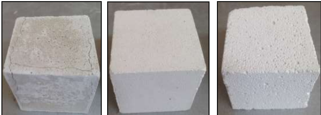
Çimento esaslı sıva

Yüksek sıcaklığa maruz bırakılan numunelerden 300 ve 600 °C sıcaklıklar sonrasında numunelerde gözlemlenebilir herhangi bir yüzeysel bozukluğa rastlanmazken, 900 °C sıcaklıklar sonrasında yüzeysel çatlaklar gözlemlenmiştir. Bu çatlaklar alçı ve ısı yalıtım sıva numunelerinde mikro düzeyde kalırken, çimento esaslı sıva numunelerinde belirgin olarak görülmüştür. Numunelere ait örnekler Şekil 5’te sunulmuştur.