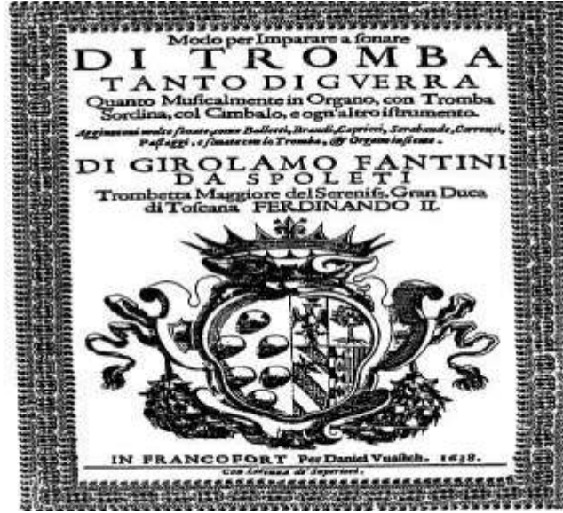
Görsel 2. Girolamo Fantini Trompet Metodu.

Dünyanın birçok yerinde gerek geleneksel müziklerin icrasında gerekse popüler müzik alanında kendine oldukça geniş bir alan yaratan trompet, ülkemizde de Cumhuriyet öncesi dönemden günümüze gelene kadar ki süreçte tercih edilen bir enstrüman olmayı başarmıştır. II. Mahmut zamanında kapatılan Mehterhanenin yerini alan Mızıkai Hümayun, trompet eğitiminin Anadolu coğrafyasında başlatılmasının miladı olarak kabul edilebilir. Mehterhane zamanında meşk usulü ile gerçekleştirilen eğitim öğretim faaliyetleri, okulun başına getirilen İtalyan şef Donizetti Paşa ile Batı müziği sisteminin öğretilmesine dönüştürülmüş ve bu bağlamda da orkestra ile askeri bandolar oluşturulmuştur (Gazimihal, 1955).