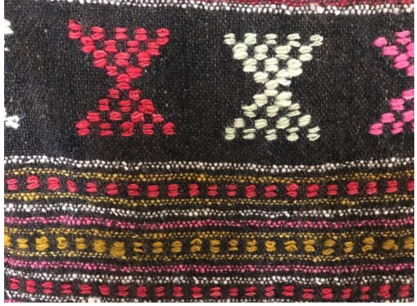
Fotoğraf 7-8. Bezayağı örgü ve cicim detay fotoğrafı (Özcan, 2021)