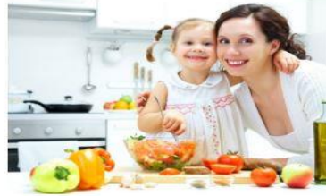
Şekil 4. Kuzey Kıbrıs Sosyal Bilgiler 4. sınıf Ders kitabı 2. ünite (Üçışık-Erbilen vd., 2021, s.52).

Ailede anne-babalar sadece kendi aralarında değil, çocuklarını da işin içine katmak, onlara sorumluluklar vermek, onlara güven duymak yoluyla yetenek gelişimini artırmış olur. Öte yandan çocuklarına belirli sorumluluklar vermeyen aileler demokratik bir aile ortamı oluşturulamaz.