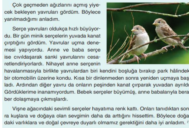
Şekil 6. Türkiye Sosyal Bilgiler 4. sınıf Ders kitabı 3. ünite (Tüysüz, 2019 s.72).

Her iki ülkenin 3. ünitesinde yer alan değerlerin vurgulanma sayısında farklılıklar görülmüştür. KKTC 4. sınıf Sosyal Bilgiler ders kitabı “yaşadığım çevre” adlı üniteye toplam 48 kez değer vurgusu yapılırken; Türkiye 4. sınıf Sosyal Bilgiler ders kitabında 6 kez yapılmıştır. Bununla birlikte her iki ülkenin 3. ünitelerinde benzer değerler şunlardır; rahat bir yaşam, yardımsever, hoşgörülü, saygı değerleridir. Farklılıklar ise şunlardır; eşitlik, mutluluk, neşeli, sorumluluk değerleri KKTC 4. sınıf Sosyal Bilgiler ders kitabı 3. üniteye yer alırken; bu değerler Türkiye 4. sınıf Sosyal Bilgiler ders kitabı 3. üniteye yer almamıştır. Her iki ülkenin 4. sınıf Sosyal Bilgiler ders kitabı 3. ünitelerinde geçen değerlerin görsel vurgularına Şekil 6 ve 7’de yer verilmiştir.