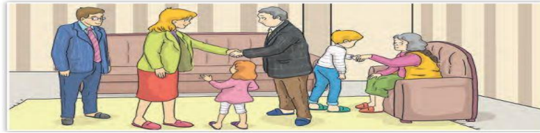
Şekil 5. Türkiye Sosyal Bilgiler 4. sınıf Ders kitabı 2. ünite (Tüysüz, 2019, s.43).

Bayram günlerinde herkes daha güler yüzlü ve hoşgörülü olur. Öfke ve kırgınlıklar unutulur. Bu nedenle bizim kültürümüzde bayram denildiğinde akla en çok dargınların barışması gelir.