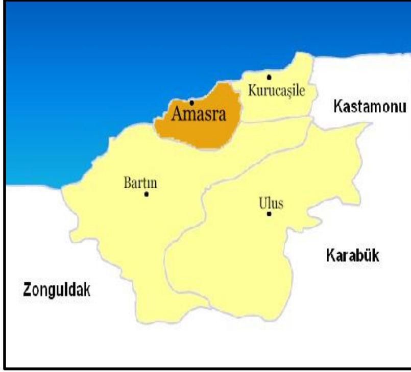
Őekil 1: Amasra'nın Konum Haritası (URL -1)

Amasra kenti, tarih boyunca Millet, Fenike İyon, Lidya, Ceneviz, Roma gibi bir ok medeniyete ev sahipliđi yapmasından dolayı zengin bir k lt rel yapıya sahiptir.  zellikle Roma devrinde inŐa edilen yapılar g n m ze kadar ulaŐmıŐtır. Farklı medeniyetler, farklı mimari  sluplar, farklı inan lar Amasra yerleŐiminin k lt rel dokusuna  eŐitlilik katmıŐtır ( zdemir, 2016:109). Kent, ge irdiđi tarihi devirlerin ve ev sahipliđi yaptđı uygarlıkların mimari  zelliklerinin bir ođunu g n m ze taŐıyabilmiŐ  nemli bir tarihi Őehir  zelliđi taŐımaktadır (Yazgan ve diđerleri, 2005:180).