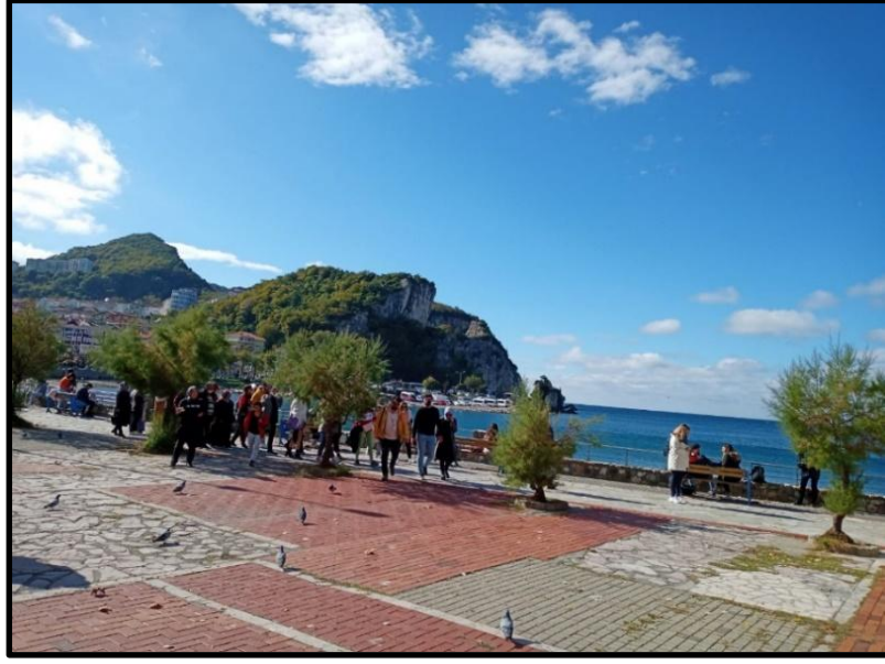
Görsel 3: Amasra Turist Noktalarından Bir Görünüm