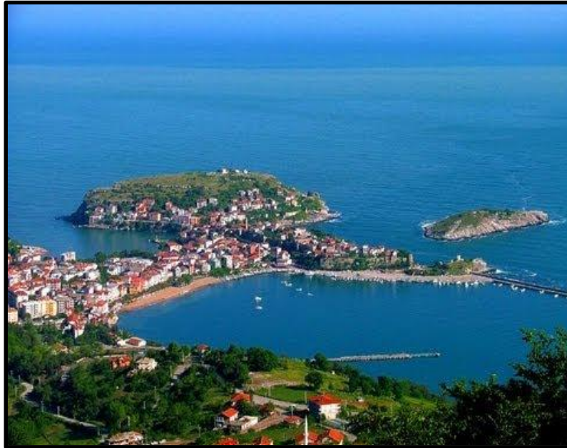
G rsel 1: Amasra Kentinden Bir G r n m (URL -2)

Amasra kenti, tarih boyunca Millet, Fenike İyon, Lidya, Ceneviz, Roma gibi bir ok medeniyete ev sahipliđi yapmasından dolayı zengin bir k lt rel yapıya sahiptir.  zellikle Roma devrinde inŐa edilen yapılar g n m ze kadar ulaŐmıŐtır. Farklı medeniyetler, farklı mimari  sluplar, farklı inan lar Amasra yerleŐiminin k lt rel dokusuna  eŐitlilik katmıŐtır ( zdemir, 2016:109). Kent, ge irdiđi tarihi devirlerin ve ev sahipliđi yaptđı uygarlıkların mimari  zelliklerinin bir ođunu g n m ze taŐıyabilmiŐ  nemli bir tarihi Őehir  zelliđi taŐımaktadır (Yazgan ve diđerleri, 2005:180).