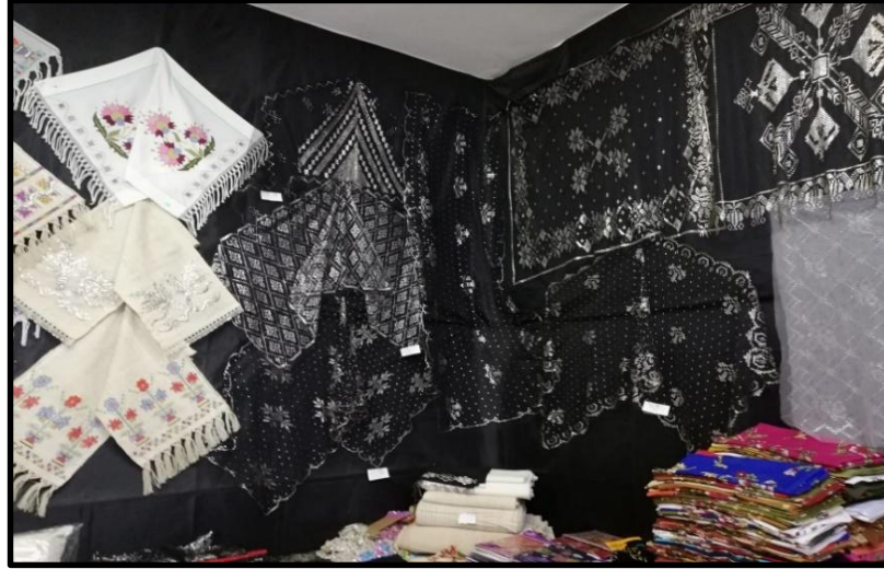
G rsel 5: Tel Kırma Malzemelerinin Satıldığı Bir D kk n

Çalıřmada nitel arařtırma y ntemden yararlanılmıřtır. Nitel arařtırma y ntemi; g zlem, g r řme ve dok man analizi gibi nitel bilgi toplama y ntemlerinin istifade edildiđi, algıların ve olayların dođal ortamda gerçekçi ve b t nc l bir biçimde ortaya konmasına y nelik nitel bir s reçten ibarettir. Arařtırmada nitel veri toplama tekniklerinden biri olan g r řme tekniđi kullanılmıřtır.