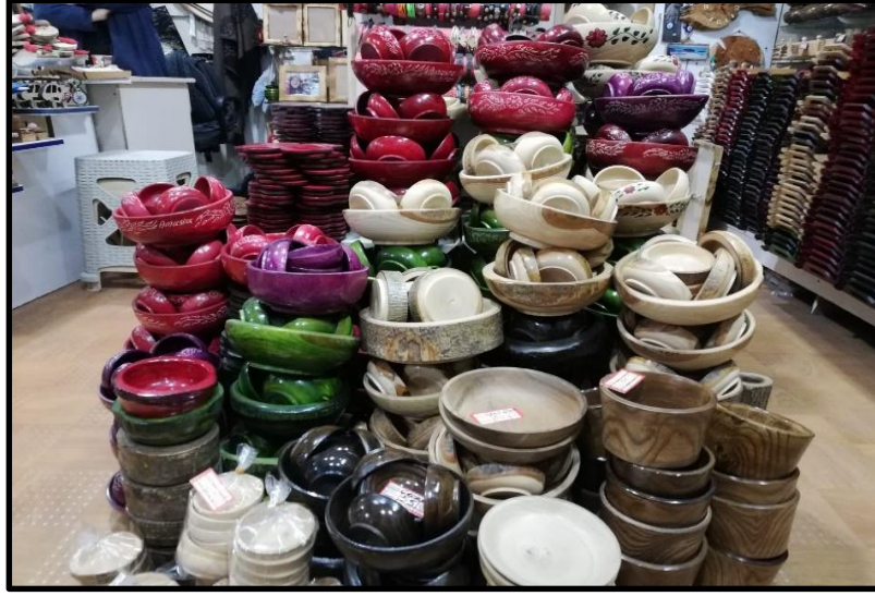
G rsel 4: Amasra Kentinde  ekicilik El Sanatına  rnek