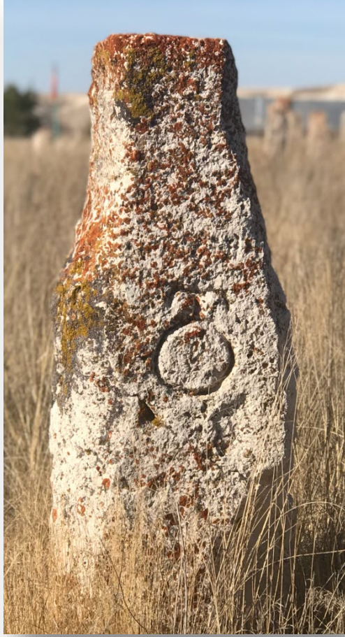
Fotoğraf 29: Sülale Damgası Bulunan Bir Mezar Taşı-Hilmiye Köyü-13.10.2019