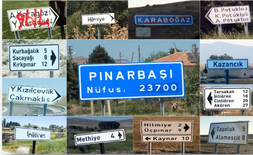
Fotoğraf 1: Köy Tabelaları-2017 (Haziran-Temmuz)-23.08.2018-13.10.2019

“Kafkasya Kökenlilerin Hafıza Mekanları Üzerine Bir Araştırma” başlıklı Tübitak 1001 projesi kapsamında 2017 yılının Haziran-Temmuz, 2018 yılının Mayıs-Ağustos ve 2019 yılının Ekim aylarında Kayseri merkez, Pınarbaşı ilçe merkezi ve Pınarbaşı'na bağlı köylerde gerçekleştirdiğimiz alan çalışmasında Akören, Altıkesek, Aşağıborandere, Aşağıkaragöz, Devederesi, Eğrisöğüt, Gebelek, Halitbeyören, Hilmiye, İnlören, Karaboğaz, Karakuyu, Kaynar, Kazancık, Kılıçmehmet, Kurbağalık, Methiye, Olukkaya, Örenşehir, Panlı, Sacayağı, Şerefiye, Tahtaköprü, Taşoluk, Üçpınar, Yağlıpınar, Yukarıbeyçayır, Yukarıkaragöz ve Yukarıkızılçevlik köyleri olmak üzere toplam 29 köy tarafımızca ziyaret edilmiştir. 1