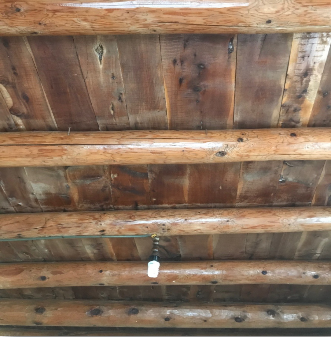
Fotoğraf 21: Hilmiye Köyü-13.10.2019