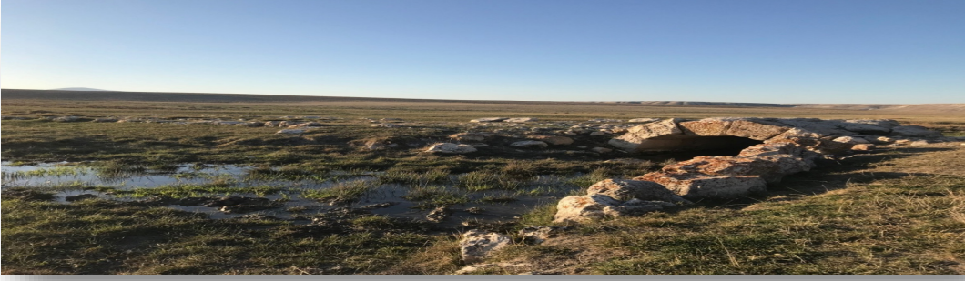
Fotoğraf 3: Roma Yolu Köprüsü ve Mil Taşı-Hilmiye Köyü-13.10.2019