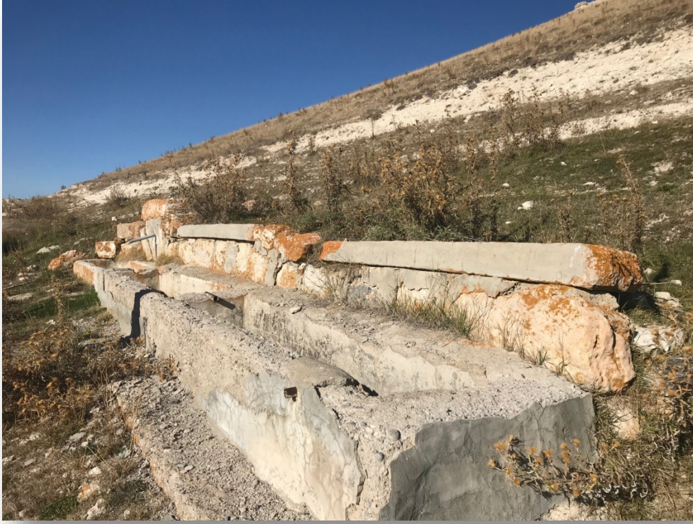
Fotoğraf 24: Kenet Puarı (pınarı)-Hilmiye Köyü-13.10.2019

Hilmiye köyündeki Kenet pınarı ve Hajdımpınarı sırtı sülalenin mensuplarının etnik kimlikleri için hatırlatma işlevi gören hafıza mekanlarıdır. Uzunyayla köyleri bu şekilde pek çok toponim ve hidronime sahiptir. Konu araştırmacıları beklemektedir.