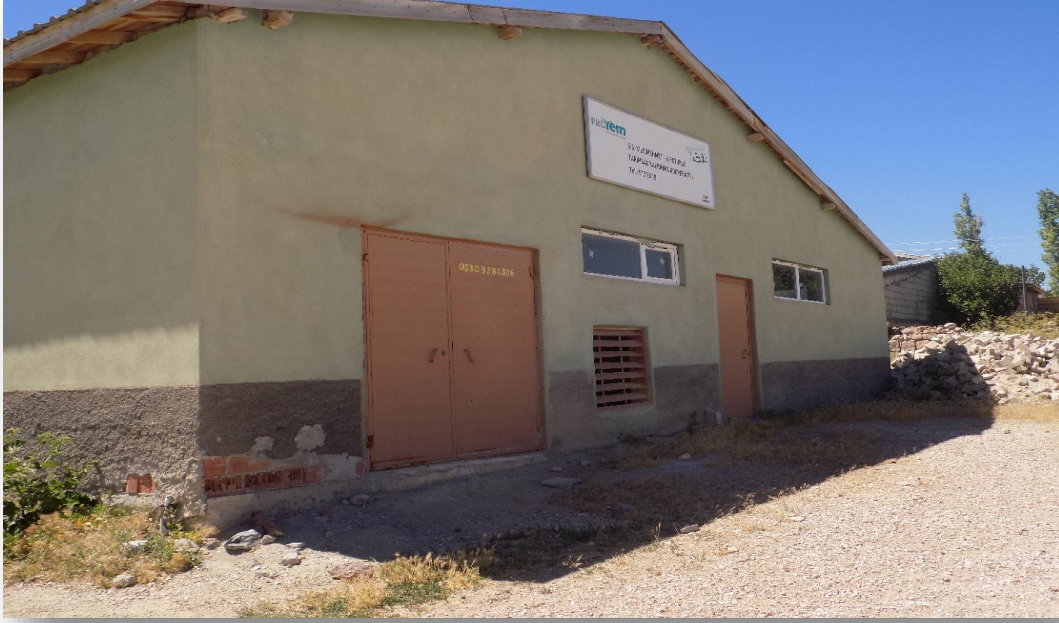
Fotoğraf 20: Kılıçmehmet-Küçükpotuklu Tarımsal Kalkınma Kooperatifi