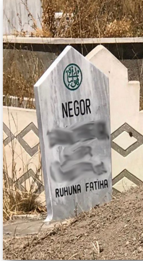
Fotoğraf 30: Sülale İsmi Bulunan Bir Mezar Taşı-Kaynar Köyü-23.08.2018

Toplumun buluşma platformlarından birisi de cenaze törenleri olmuştur. Uzunyayla'da cenaze törenlerinde geleneğe göre köye gelen misafirler köydeki hanelere dağıtılmış ve cenaze evinde yemek yapılmamıştır (K.K. :4, 6, 23, 30, 58, 66, 70, 74). Köy mezarlıklarında yaptığımız gözlemlere göre mezarlıklarda sülalelerin yerleri bellidir. Bu bağlamda düşündüğümüzde kişilerin cenaze ve bayram gibi günlerde yaptığı mezar ziyaretleri, mezar taşlarında bulunan sülale damgaları ve sülale isimleri kişinin etnik kimliği için hatırlatma, geçmiş bilinci oluşturma ve beraberinde hafıza mekanı işlevi görmektedir.