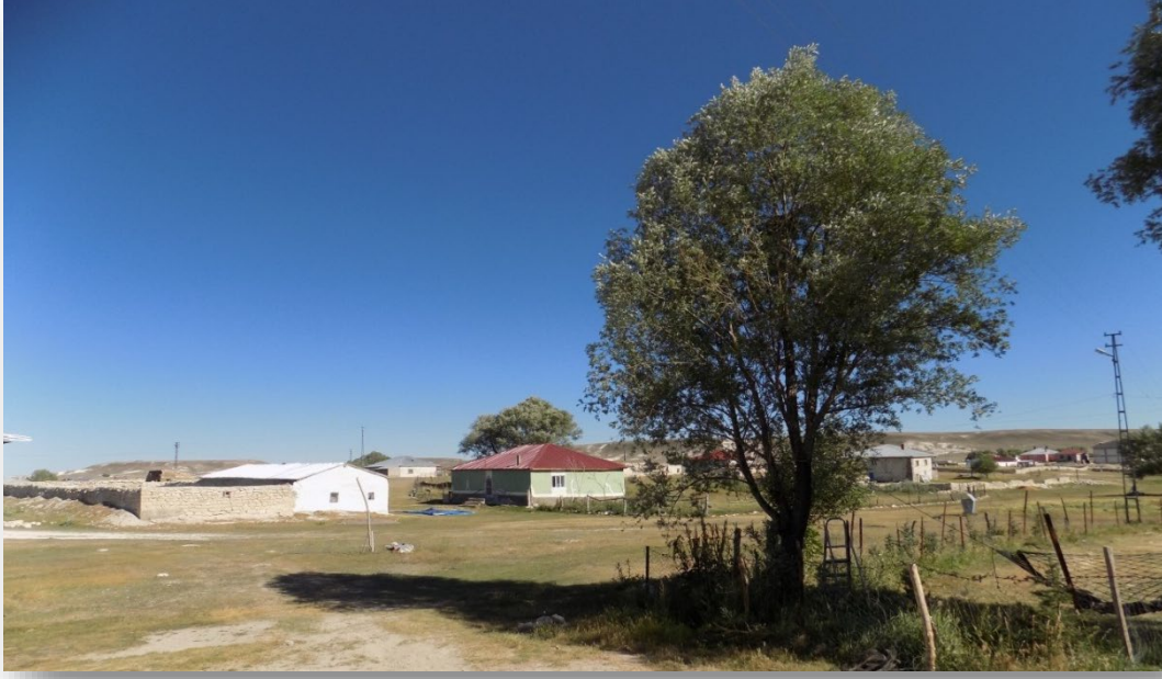
Fotoğraf 10: Uzunyayla Bölgesi-Methiye Köyü-11.07.2017