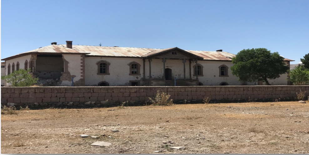
Fotoğraf 16: Kaynar'daki Eski Okul-23.08.2018