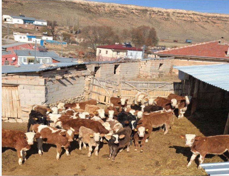
Fotoğraf 17: Akören Köyü-22.11.2019