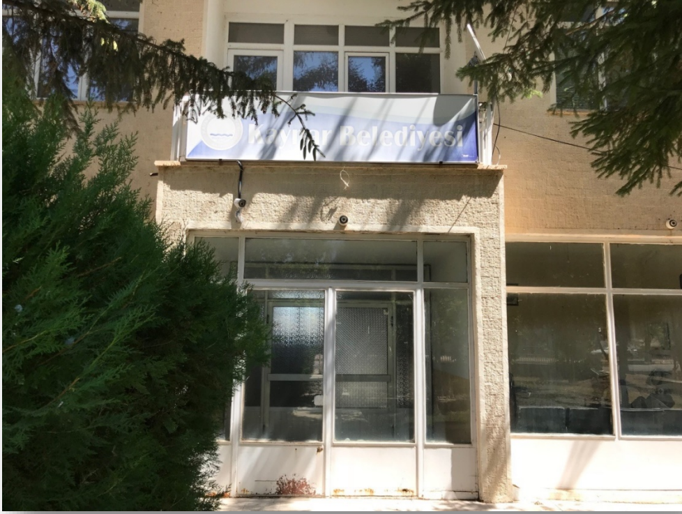
Fotoğraf 22: 30.03.2014'te Kapatılan Kaynar Belediyesi-Kaynar Köyü-23.08.2018

Alan çalışmamız esnasında kaynak kişilerden sıkça duyduğumuz bir konu ise bir dönem belediye olan eczaneye ve sağlık ocağına sahip Kaynar'ın bugün belediye statüsünü kaybedip mahalleye dönüşmüş olmasıdır.