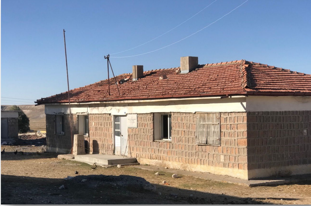
Fotoğraf 11: Kapanan Köy Okullarından Hilmiye Köyündeki Ali Tokmak İlkokulu- 13.10.2019