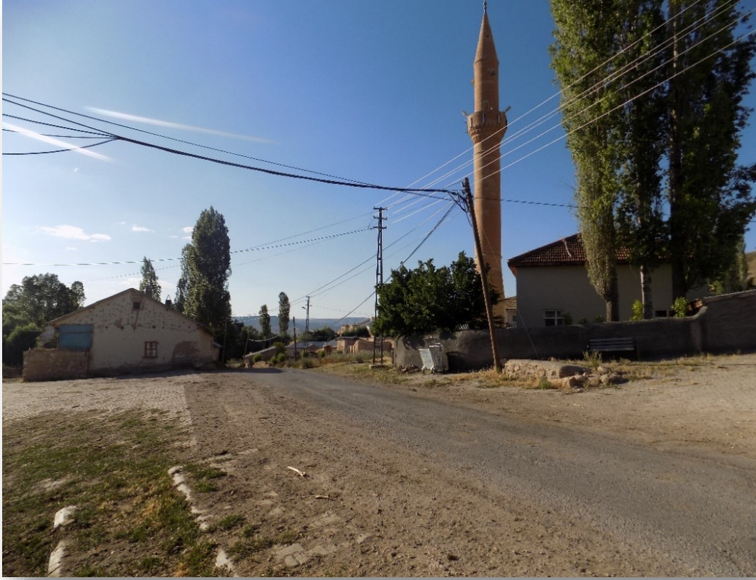
Fotoğraf 9: Pınarbaşı'na Yakın Bölgedeki-Gebelek Köyü-14.07.2017

Alamescit, Altıkesekek, Aşağıborandere, Beserek, Çukuryurt, Hilmiye, Kaftangiyen, Kavak, Kazancık, Kurbağalık, Malak, Methiye, Örenşehir, Pazarsu, Sacayağı, Şerefiye, Tahtaköprü, Taşlıgeçit, Taşoluk, Üçpınar köylerini içine alan bölge ise Uzunyayla olarak adlandırılmaktadır. Bu bölgedeki köy nüfuslarının etnik yapısı Abazalar, Çeçenler ve Çerkeslerden oluşmaktadır. Bölgenin Çeçen nüfusuna sahip tek köyü Aşağıborandere, tek Abzeh köyü Çukuryurt'tur. Altıkesekek köyü Abazaların Aşuva, Kazancık ve Yukarıborandere köyleri Aşharuva grubuna dahildir. Beserek, Kavak ve Malak köyü ise Hatukoy nüfusa sahiptir. Uzunyayla'nın Pınarbaşı'na bağlı köyleri ağırlıklı olarak Doğu Çerkes (Kabardey) grubuna mensuptur.