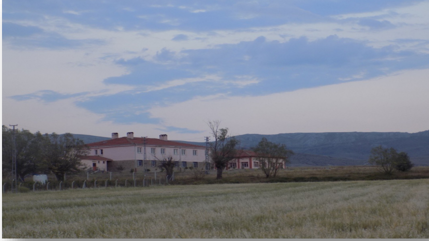
Fotoğraf 12: Panlı İlkokulu ve Ortaokulu-16.07.2017

Pınarbaşı civarı ve Uzunyayla köylerinde ikamet eden çocuklar mesafelere göre Pınarbaşı'ndaki okullara, Karakuyu İlkokul ve Ortaokuluna, Kaynar İlkokulu ve Ortaokuluna gitmektedirler.