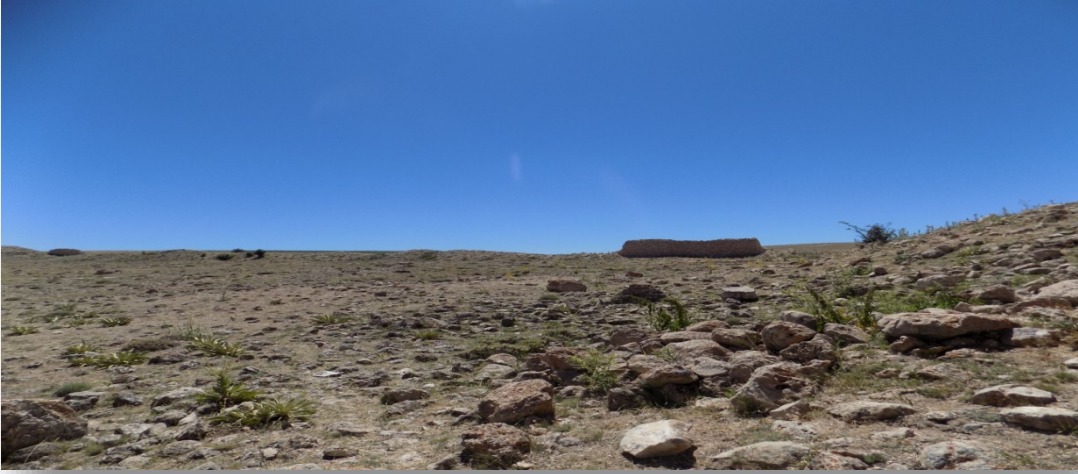
Fotoğraf 18: Şerefiye Köyü-11.07.2017