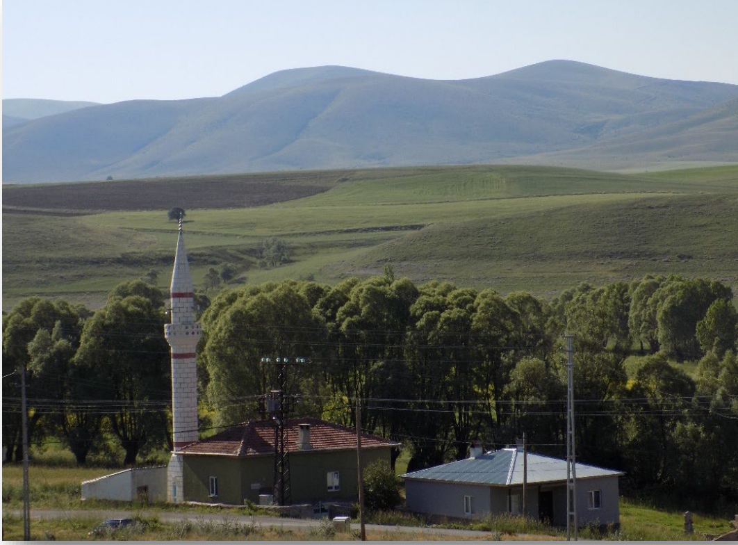
Fotoğraf 8: Çörümşek Bölgesi-Devederesi Köyü-25.06.2017