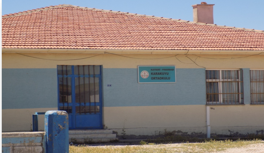
Fotoğraf 13: Karakuyu Ortaokulu-11.07.2017