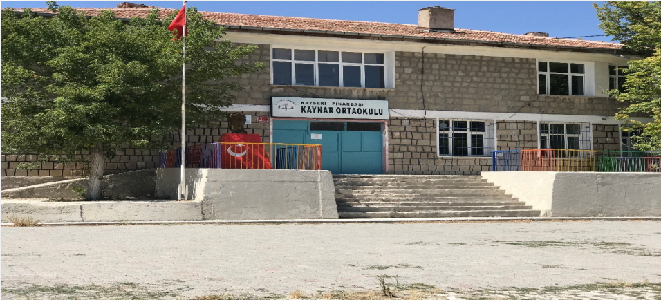
Fotoğraf 15: Kaynar Ortaokulu-23.08.2018