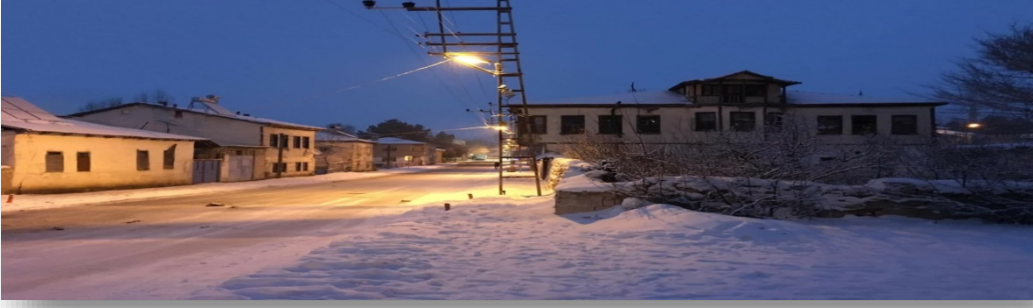
Fotoğraf 2: Ashot Sülalesine Ait Konak-Pınarbaşı İlçesi-10.01.2020