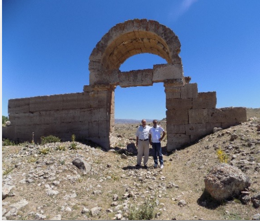
Fotoğraf 6: Kale Kalıntısı-Şerefiye Köyü- 11.07.2017