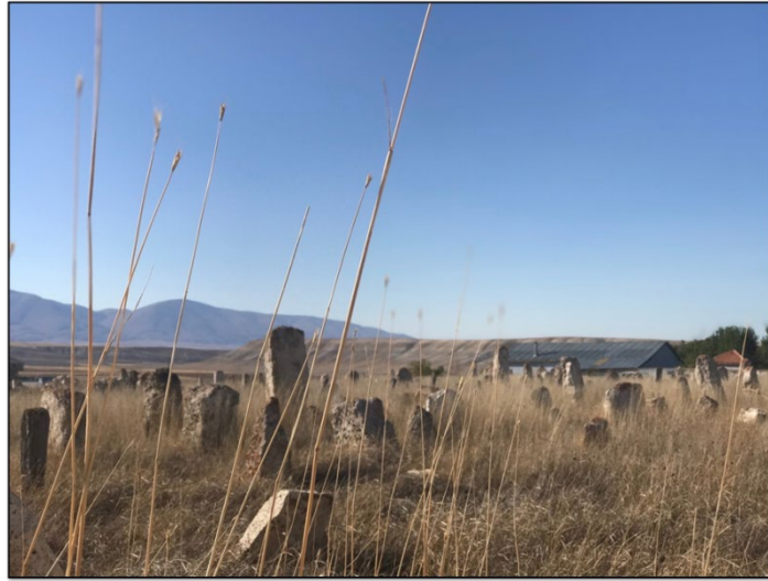
Fotoğraf 4: Hilmiye Köyü Mezarlığı-13.10.2019