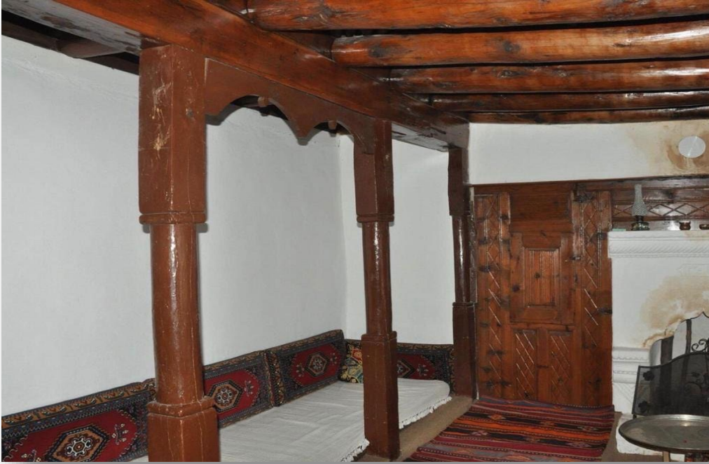
Fotoğraf 25: Guaş Şevket'in Haçeşi-Panlı Köyü

Bir kültür okulu olan dilin, habzenin 5 , halk hikayelerinin ve masalların aktarım mekanı işlevi gören haçeşler günümüzde ya kapalı ya da yıkılmıştır (K.K. :50, 72). Alan çalışmamız esnasında ziyaret ettiğimiz Tahtaköprü (12.07.2017) ve Taşoluk (11.07.2017) köylerinde haçeşleri görme fırsatı yakaladık. Ayrıca Methiye, Dikilitaş, Panlı köyünde de (Siyuh Seferbiy ve Guaş Şevket) haçeşler bulunmaktadır. Günümüzde işlevini yitiren haçeşler sembolik birer hafıza mekanı olarak Uzunyayla'nın köylerinde az sayıda da olsa hala ayakta durmaktadır.