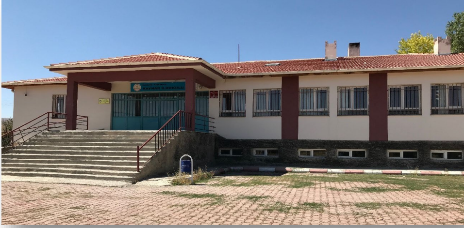
Fotoğraf 14: Kaynar İlkokulu-23.08.2018