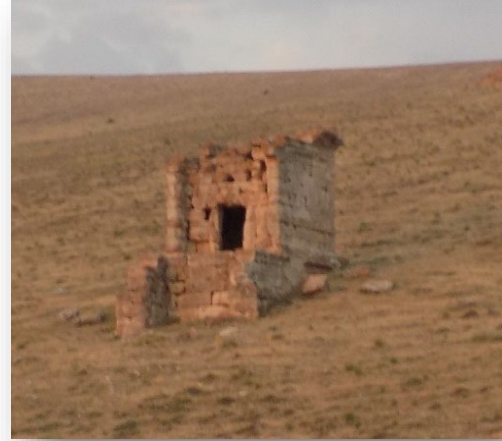
Fotoğraf 7: Panlı Anıt Mezarı-Panlı Köyü- 16.07.2017