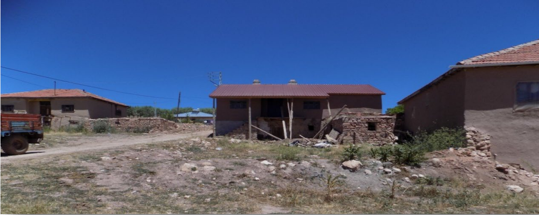
Fotoğraf 19: Yağlıpınar Köyü-12.07.2017

Alan çalışmamız esnasında son dönemlerde bölgede kimyon, anason ve aspir ekimi yapıldığı dile getirilmiştir. Ayrıca Uzunyayla'da sadece erkekler çalışırken, Pınarbaşı'na yakın köylerde kadınlar da çalışarak tarımsal faaliyetlere katılım sağlamışlardır.