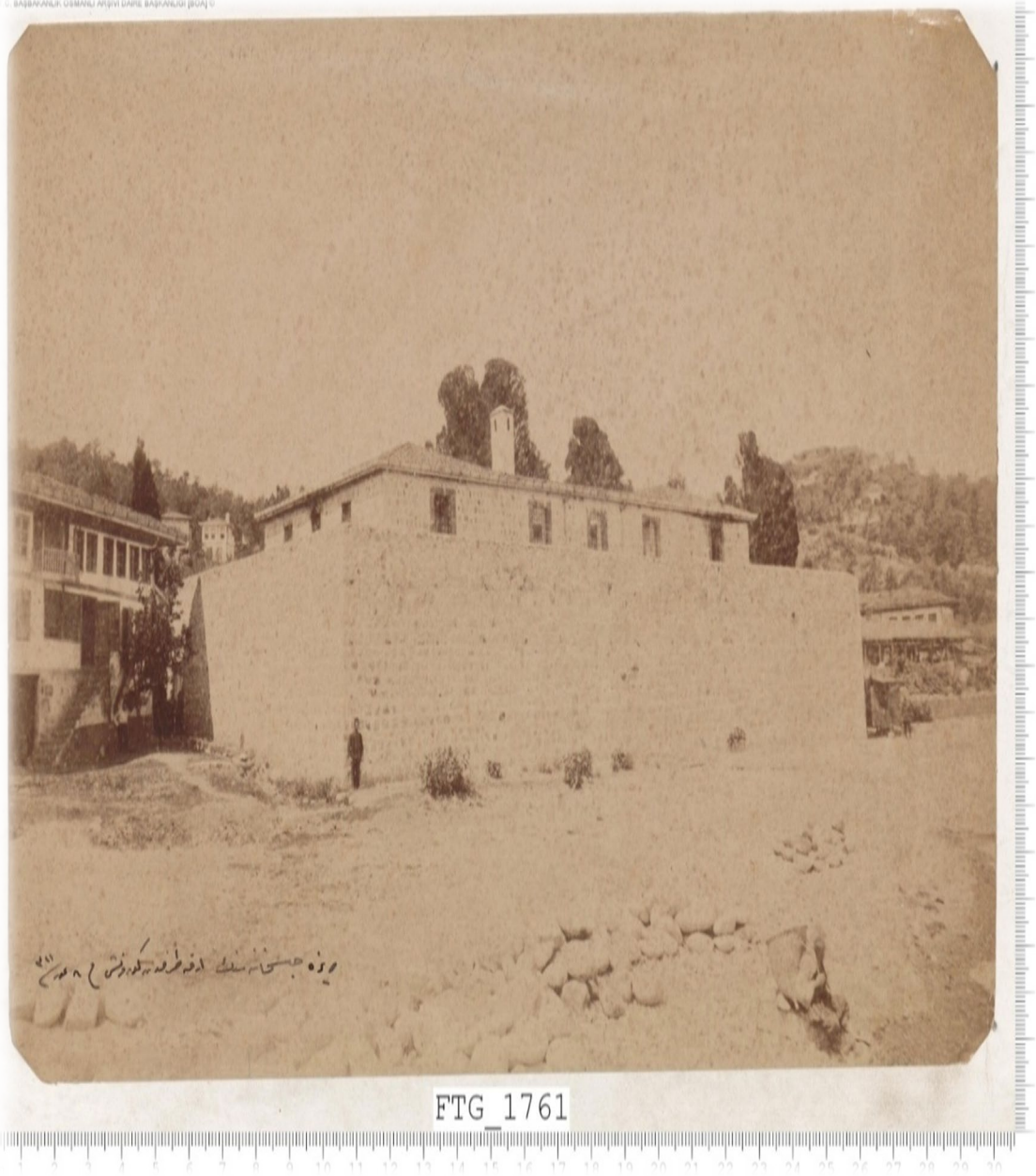
EK 1: Rize Hapishanesinin Arkadan Görünümü / 20 Temmuz 1895