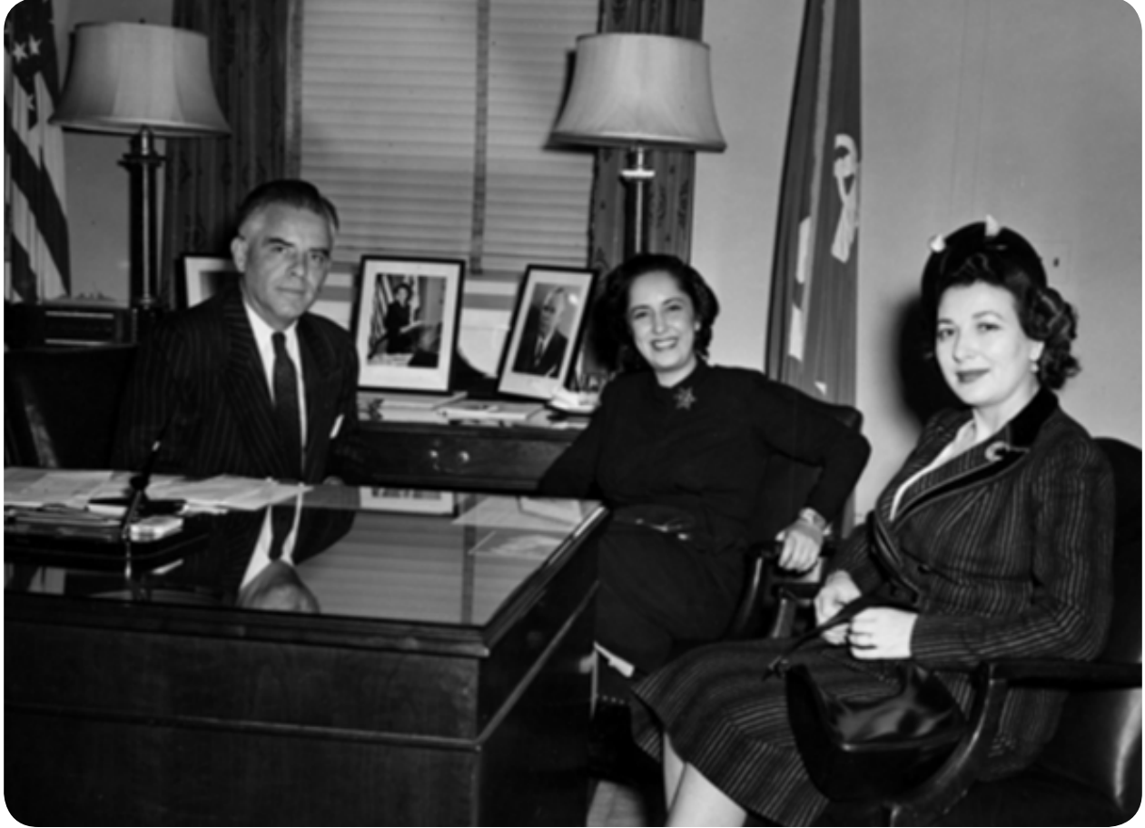
Amerikan Donanma Müsteşarı Francis P.Whitehair-İstanbul Milletvekili Nazlı Tlabar-Washington Büyükelçisi Feridun Erkin'in Eşi-Pentagon-26 Eylül 1951

9 Haziran 1961 günü yapılan duruşmada dile getirecektir. 9 Haziran 1961'de yapılan duruşmada, anayasaya muhalefet ve diktaya gidişte kasıt aramak gibi hususları asla kabul etmediğini; hakkında pek çok olumlu yayın yapılan bir insanın eğer kötü biri olsa yayınların bu yönde olmayacağını, hakkında çıkan bir-iki yazının ise çarşaf kanunuyla ilgili olduğunu belirtmiştir. 89 Bu yasa çerçevesinde partisinde iki görüşün oluştuğunu birinin