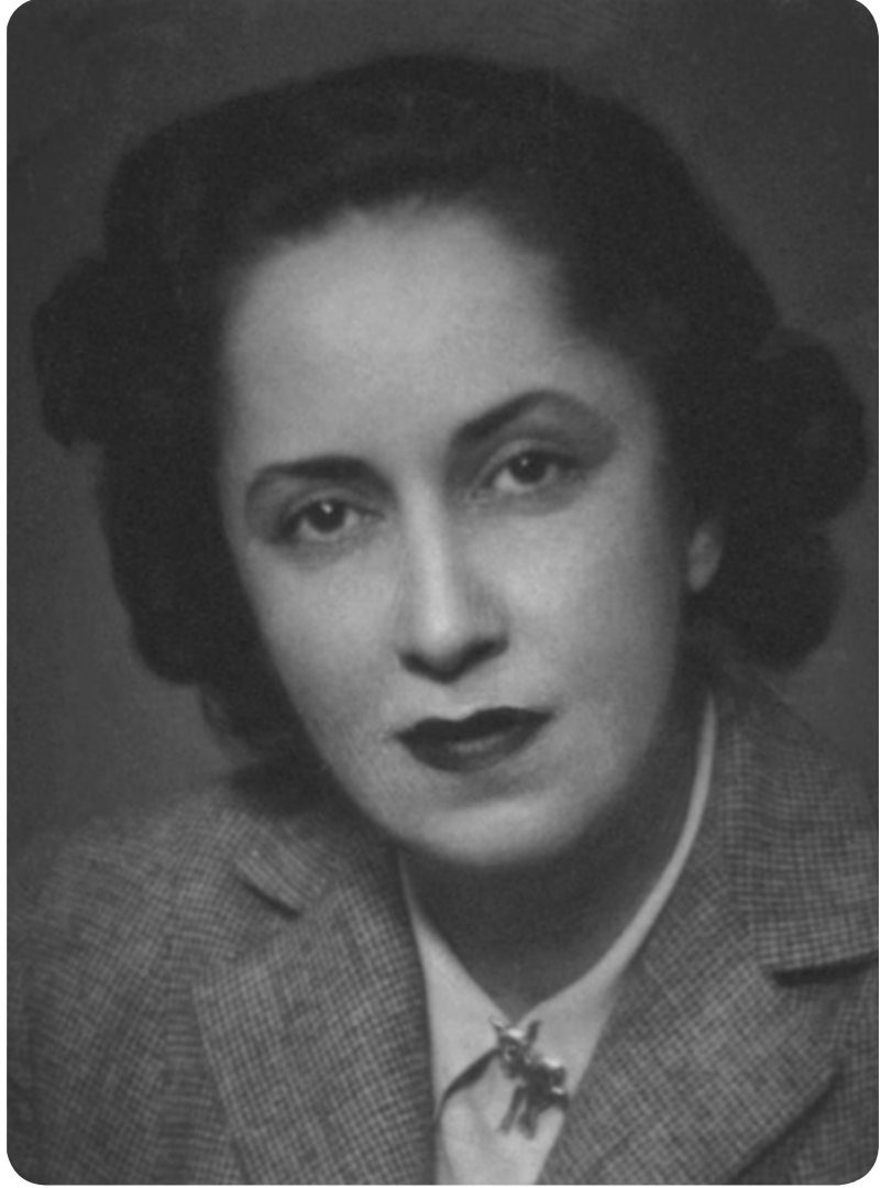
HATİCE NAZLI TLABAR (1913 – 1971) İstanbul Milletvekili, Gazeteci Sicil No: 1715

Ayrıca Birleşmiş Milletler üyesi 52 ülkenin Vatikan'da temsilcisi olduğunu, bunlar içinde Japonya'nın Katolik nüfus oranının %14 olduğunu, buna karşılık Endonezya gibi Müslüman bir ülkenin dahi %50 oranına sahip olduğunu ve bu ülkenin 25 Mayıs 1950'de Vatikan'a temsilci gönderdiğini belirtmiştir. 16 Vatikan'ın dünya cereyan ve hadiselerini manevi ölçülerle tahlil eden önemli bir gözlem ve istihbarat merkezi olduğunu vurgulamış ve Polonya'nın istilaya uğradığı vakit bu olayı telin eden tek sesin Vatikan temsilcisinin olduğunu örnek vermiştir. 17 Dışişleri bakanlığının Paris veya Bern büyükelçilerinden birinin Vatikan'da elçilik görevini ifa edebileceğini öneren Tlabar, Kıbrıs meselesi hakkında Türk ve Yunan hükümetlerinin elden gelen bütün gayreti göstermeleri gerektiğini vurgulamıştır. 18