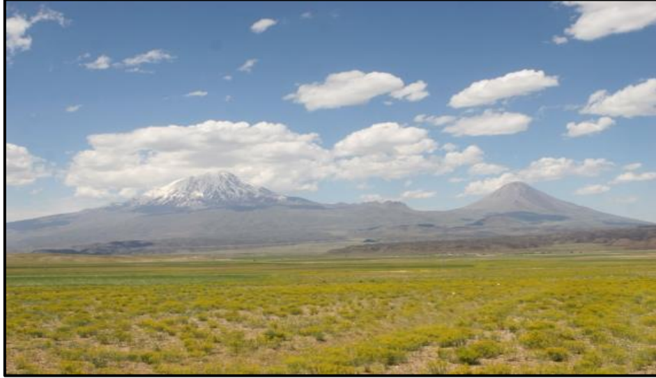
Fotoğraf 1: Serdarbulak Geçidi ile birbirinden ayrılarak iki ayrı dev koni biçiminde, yükselen Büyük ve Küçük Ağı dağlarından bir görünüm

Kaynağı Büyük ve Küçük Ağı volkan konileri olan lâvlar, Doğubayazıt Ovası ve Gürbulak Oluğu'nun kuzey kenarını yer yer ince tabakalar halinde örter. Birer strato-volkan olan bu dağların parazit konileri, lâv akıntıları, lâv breşleri, lapilli ve tuf yataklarından oluşmaktadır (Ketin,1983:478). Gürbulak Oluğu'nu kuzeyden sınırlayan volkanitler daha çok bazaltik özelliktedir (Altınlı,1964:25-26). Gürbulak oluşunu güney yönünde sınırlayan dağlık-tepelik alan ise, Mezozoik ve Tersiyer dönemlerine ait formasyonlardan oluşur (Fotoğraf 2).