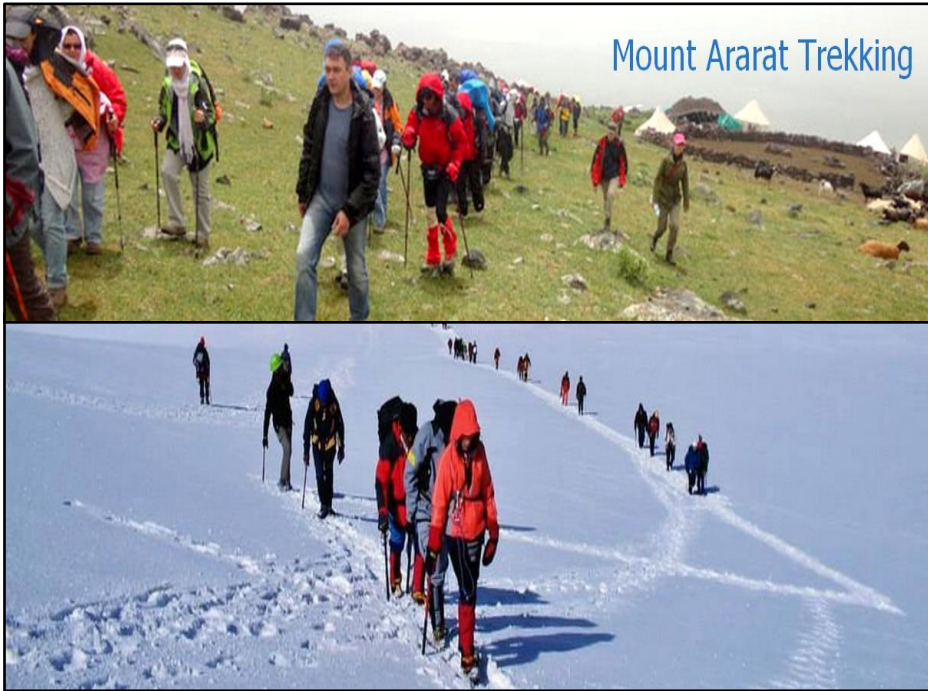
Fotoğraf 3: Farklı mevsimlerde Ağrı Dağı'na tırmanan (trekking yapan) dağcılardan bir görünüm

Ülkemizin en yüksek dağı (5137 m.) olan ve adı Ağrı İli ile özdeşleşmiş bulunan Ağrı Dağı, gerek dağa tırmanma (trekking) ve gerekse kış turizmi açısından yüksek bir potansiyele sahiptir (Fotoğraf 3).