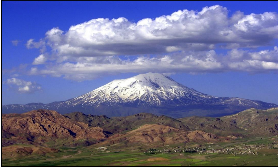
Fotoğraf 2: Takke buzulu ile örtülü olan ve birer strato-volkan olan bu dağların parazit konileri, lâv akıntıları, lâv breşleri, lapilli ve tûf yataklarından oluşmaktadır.

Ağrı Dağı'nın zirvesi tamamen kar ve buzullarla kaplıdır. "Bu nedenle ağrının zirvesinde merkezi bir kraterin olup olmadığı kesin olarak bilinmemektedir. Kalıcı kar ve buzullar dağın güney yamacında 4500, kuzey yamacında ise 4000 metreden başlar. Dağın zirvesini takke şeklinde örten buzullar, 4800 m.den itibaren, vadi içlerine doğru bazı yerlerde yaklaşık 3500 metreye kadar sarkarak vadi buzulu şeklini almıştır. Vadi içlerine yerleşen buzulların bir kısmı (Ağrı Dağı zirvesinin hemen güneyindeki buzul vadisinde olduğu gibi) yamaçlardan dökülen kaya ve topraklarla üzerleri örtülerek dip buzulu şeklini almışlardır. Zirvede yaklaşık 10 km 2 alan kaplayan örtü buzulu, aynı zamanda Türkiye'deki en geniş aktüel buzul alanını oluşturur" (Deniz,2007:458).