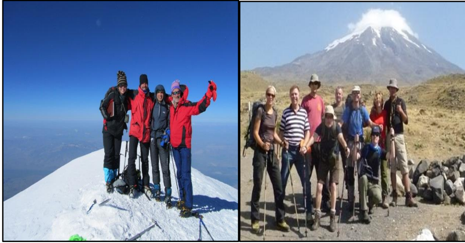
Fotoğraf 4: Ağrı Dağı'nın zirvesine ulaşmaya çalışan ve ulaşan dağcılar (Foto:

Gerek batı ve gerekse İslam dünyasında Ağrı Dağı, çok iyi tanınan ve özel ilgi duyulan dağlardan biri, belki de en önemlisidir. Kutsal kitaplarda da adı geçen bu dağ, birçok dilde farklı adlarla anılmaktadır. Yakutlar Ağr, Selçuklu Türkleri Eğri Dağ, Ağır Dağ, İranlılar Kuh-i Nuh, Araplar Büyük Ağrı'ya Cebelü'l-Hâris, Küçük Ağrı'ya ise Cebelü'l-Hüveyris isimlerini vermişlerdir. Ermeniler Masis veya Masik derken, sadece batı coğrafyacıları Ararat demektedir.