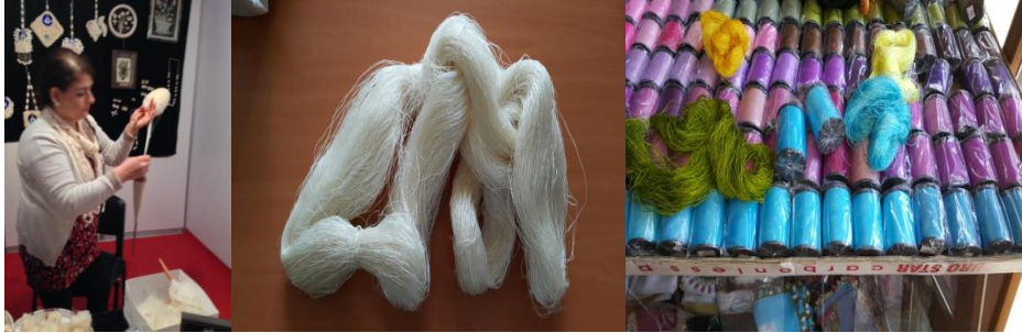
Resim 5. İplikler

İplik; kesilen parçaların dikilmesinde ve takıların yapılmasında iplikten yararlanılmaktadır. Parçaların dikilmesinde pamuk, sentetik ipliklerden, takıların oluşmasında ipek iplikler kullanılmaktadır.