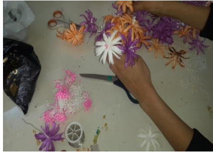
Resim 11. Süsleme Gereçleri Ekleme

Kompozisyon bazılarında sadece kozalardan yararlanılırken bazılarında süsleme gereçleri kullanılmaktadır. Süsleme gereçleri olarak boncuk, payet, sim, sırma, kurdela vb. yararlanılmaktadır.