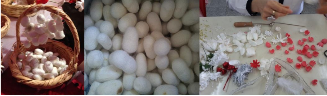
Resim 4. Kozalar

Koza; ipekböceğinden elde edilen hayvansal bir üründür. İpekböceğinin özelliklerine ve beslenme durumlarına göre çeşitli boyutlarda elde edilmektedir.