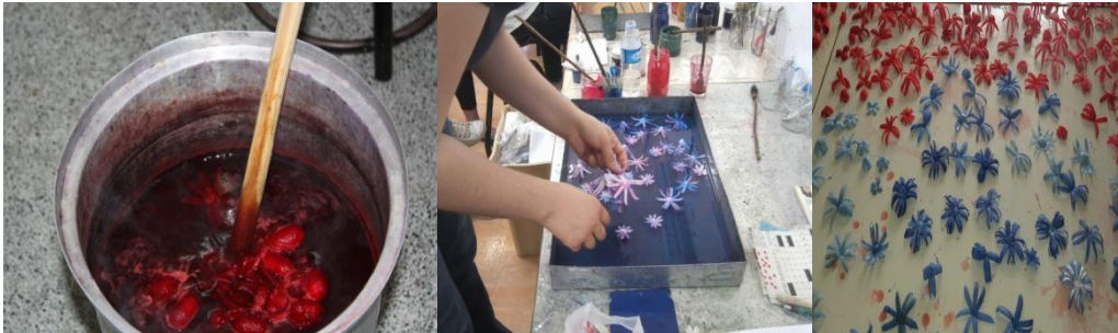
Resim 9. Kozaların Boyanması

Boyanma aşamasında kozalar ya kesilmeden ya da yapılacak ürünün özelliklerine göre enine, boyuna, verev kesilmiş şekilde boyanmaktadır. Boyamada bitkisel (papatya, kökboya, ceviz, sığır kuyruğu, cehri, nar vb bitkilerden elde edilen boyalar) veya kimyasal(asit, bazik, küp ve mordanlı boyalar gibi organik boyalar ve inorganik boyalar) boyalar kullanılmaktadır. Ayrıca kesilen koza parçalarına ebru uygulanarak da boyama yapılmaktadır.