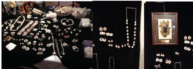
Resim 15. Kozadan Yapılmış Takılar

Kolye, küpe, yüzük, bileklik, broş, toka, taç vb. gibi takılar yapımında kozalardan yararlanılmaktadır. Kesilen kozalar takı yapımı için gerekli klips, çengel, kopça, halka ve çeşitli kalite ve özellikte ipler kullanılarak takılar yapılmaktadır.