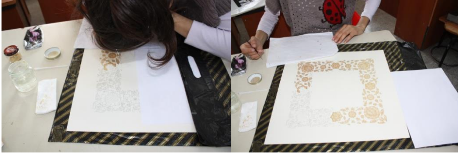
Resim 6. Kağıt Ve Kalem

Süsleme gereçleri: kozaların üstüne, altına, sağ ve sol kısımlarına süslemek amaçlı boncuk, payet, sim, kurdela vb. gibi süsleme gereçlerinden yararlanılmaktadır.