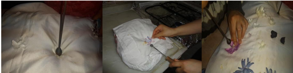
Resim 3. Ütüleme Tokmağı

Ütüleme tokmağı; kozanın üzerindeki şekil bozukluğunu gidermek ve kumaş üzerine sabitlemek için kullanılmaktadır.