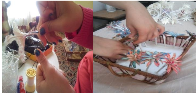
Resim 12. Ürün Bitirme İşlemi

Kozalardan oluşturulan çiçeklerin sepete konmasını ve sabitlenmesini sağlamak için çiçek sapları sarılmaktadır. Yapılan ürünün albenisini artırmada çiçeklerin belirli bir düzen içerisinde yerleştirilmesi, renk ve kompozisyonu önem taşımaktadır. Daha önce çiçeklerin yerleşim düzenini belirlenmesi gereklidir.