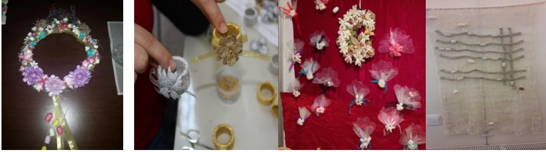
Resim 13. Kozadan Yapılmış Dekoratif Ev Eşyası