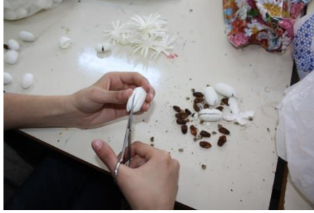
Resim 2. Makas

Makas; kozaların kesilmesi ve yapılacak ürüne göre şekil vermede kullanılan çeşitli boyutlarda makaslar kullanılmaktadır.