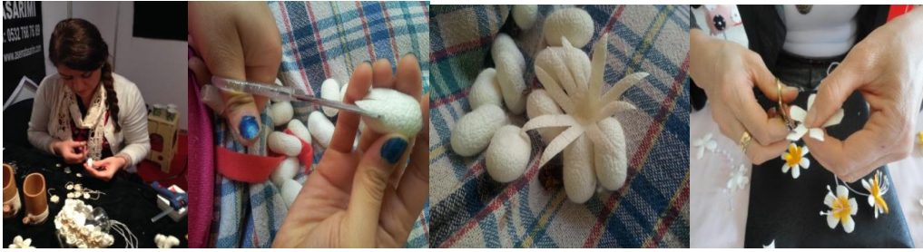
Resim 8. Kozaların Kesilmesi

Verev kesme: Kozanın merkez noktasından 0.5cm aşağısından delerek makasın ucu ile kesme işlemine başlanır. Koza elde döndürülerek istenilen genişlikte ve yere kadar kesilir. Verev kesimlerde genellikle dal, zambak ve orkide yapımında kullanılan büyük yapraklar elde edilir(Çeliker 2012).