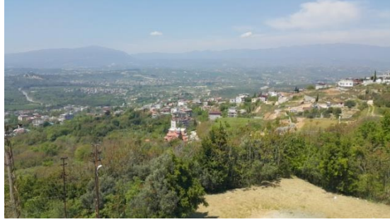
Resim 1. Antakya'dan Genel Bir Görünüm

Hatay Türkiye 'nin en önemli eski yerleşim yerlerinden biridir. İl toprakları, ilk Tunc Çağından itibaren Akat Beyliği ve M.Ö. 1800-1600 yılları arasında Yamhad Krallığına bağlı bir beyliğin sınırları içerisinde yer almıştır. Daha sonra MÖ 17. yüzyıl sonlarında Hititlerin ve MÖ 1490 yıllarında Mısır 'ın egemenliğine girmiştir. Ardından Urartular , Asurlular ve Persler 'in egemenliğinde kalmıştır.