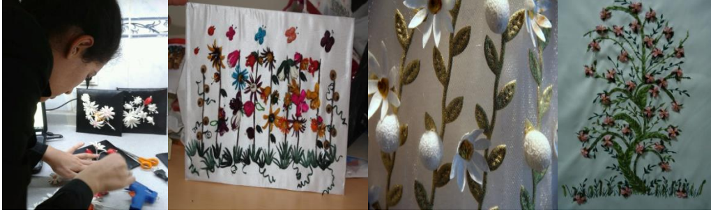
Resim 10. Kompozisyon Oluşturma