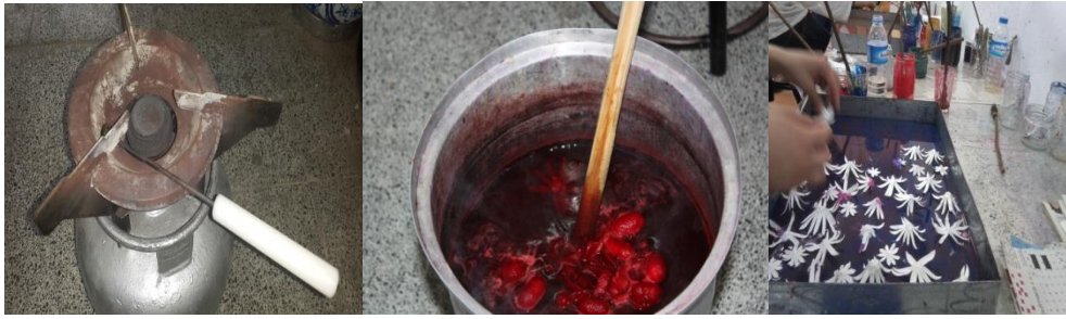
Resim 7. Tüp, Boyama Kazanı Ve Ebru Teknesi

Kozalar boyanacak veya ebru yapılacaksa boyama ve ebru yapımı için gerekli araç ve gereçler de kullanılmaktadır.