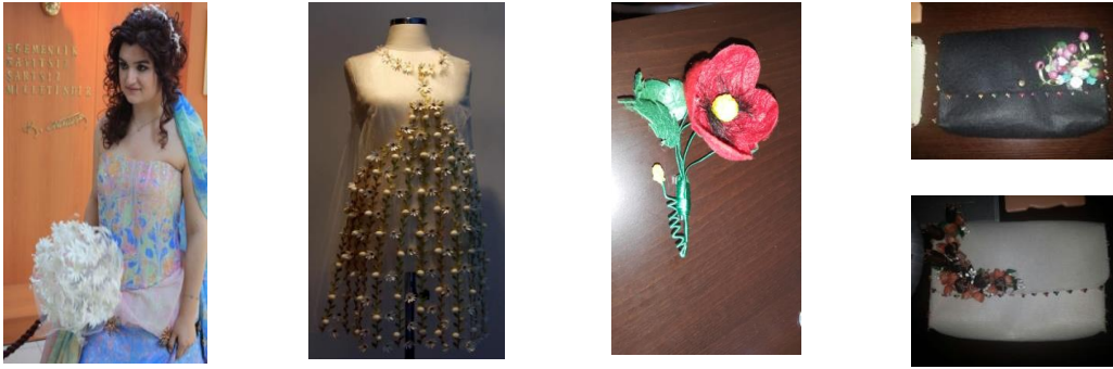
Resim 14. Koza ile Süslenmiş Giysi Ve Aksesuar

Gelin başlığı, çiçeği, giysi üzerinde süslemelerde kozalar yararlanılmaktadır. Kozalar ya bütün olarak ya da kesilmiş parçalar halinde giysi üzerine kullanılmaktadır.