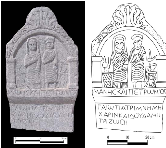
Fig. 2: 136 envanter nolu mezar steli ( Fotoğraf ve çizim: N. ABAY).