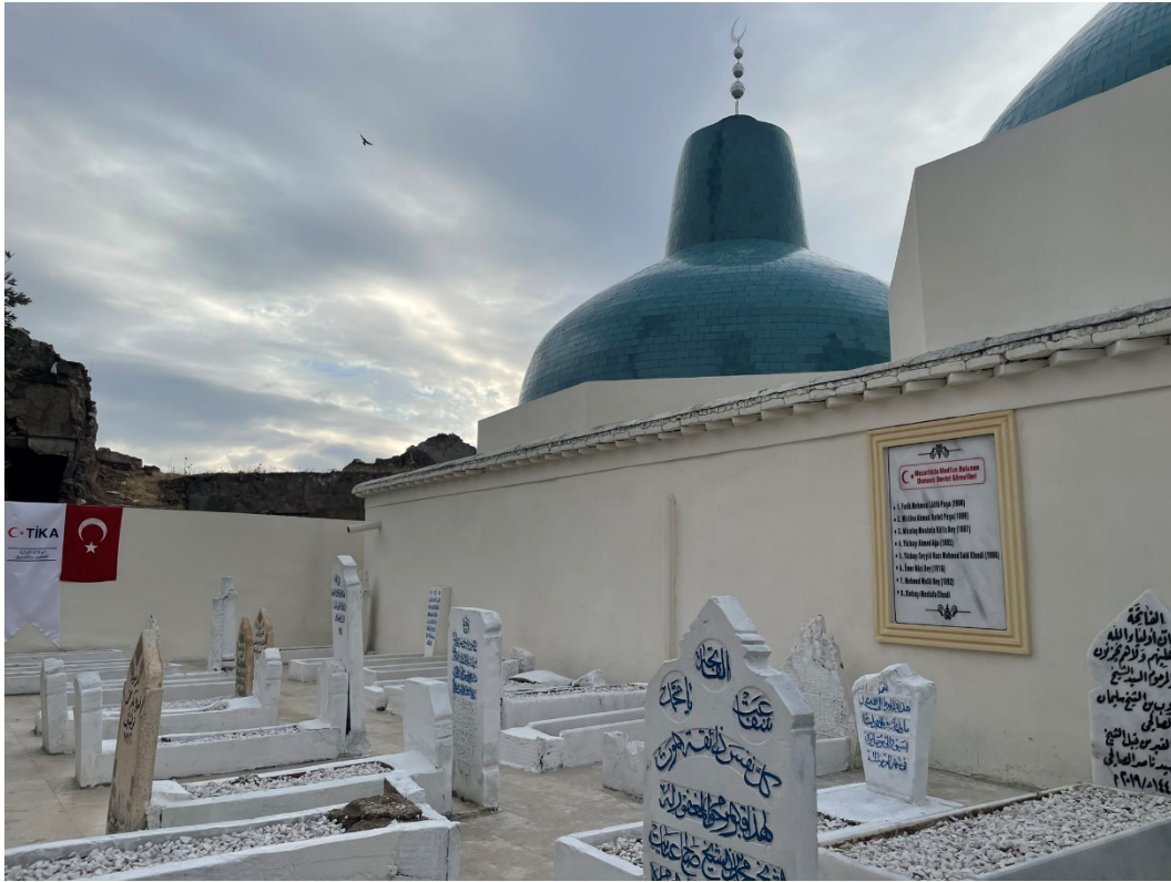
Kerkük Kalesi Osmanlı Subay Mezarlığı/Şehitliği (23 Aralık 2021)