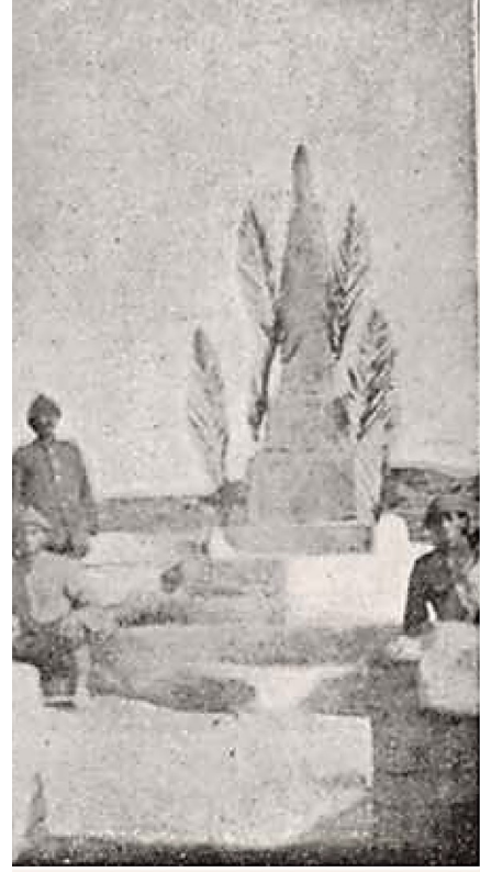
Ümerâ ve Zâbitan Şühedâ ve Âbidesi ve Sahra Serî Ateşli Topçu Şehit Efrad Âbidesi 56