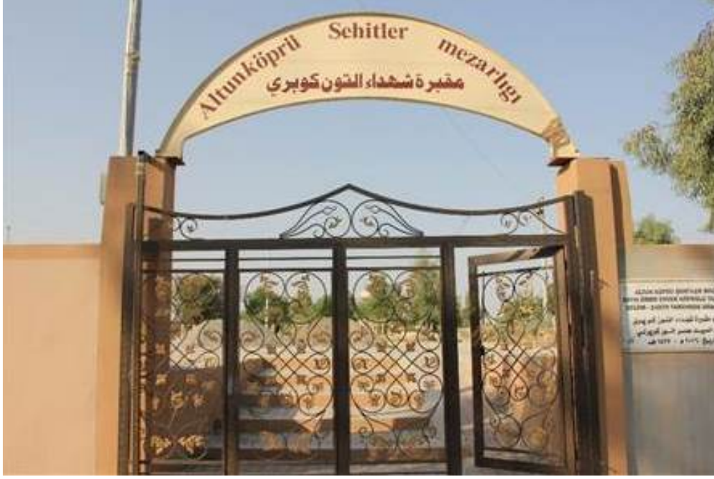
Altunköprü Şehitler Mezarlığı