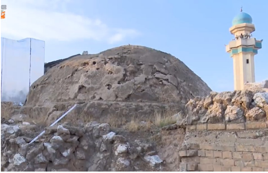
Şehit Serasker Osman Paşa'nın Türbesi

Eskiyaka'da İmam Kasım semtindeki, üstü kapalı 26 m 2 'lik tek kubbeli kümbet özel mülkiyetteki bir meskenin içerisinde 50 . Girişinde kitâbesi mevcuttur 51 . Türbedeki kabirde, duvara yakın konumdaki dikdörtgen blok üzerinde yeşile boyanmış sarık başlıklı mermer mezartaşı ve zemine yakın mermer bir panoya özensizce işlenmiş üç satırlı kitâbe yer almaktadır.