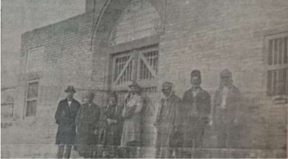
Azamiye Şehitliği'nin Cephesi (1 Mayıs 1930)

Irak ve Türkiye arasındaki ilişkiler, 1931 yılı Temmuzunda Kral Faysal'ın ailesiyle birlikte ülkemize gerçekleştirdiği ziyaretle gelişerek iki devlet başkanının şahsi dostluklarıyla pekişmiştir. Reisicumhur Gazi M. Kemal ve Bakanlar Kurulu üyelerinin imzalarıyla Bağdat'taki Türk Şehitliği'nin korunması için 1933'te kadrolu bir bekçi tayin edilmiştir 7 .