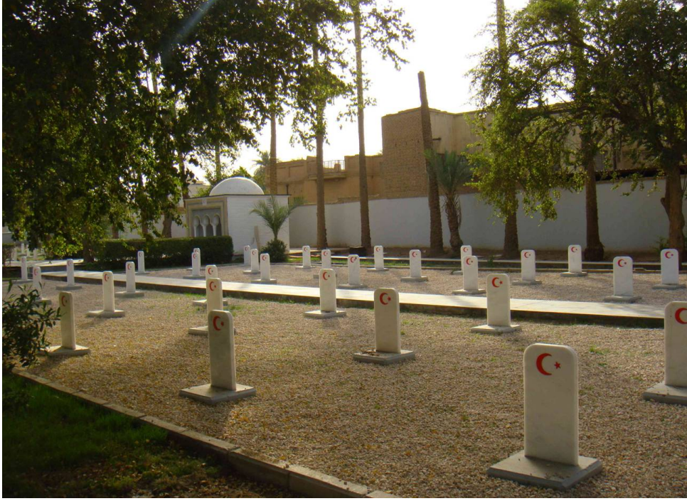
Bağdat Türk Şehitliği