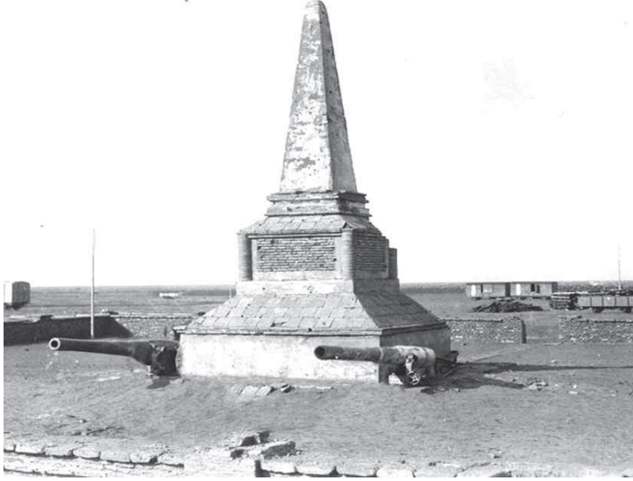
Kut Türk Şehitlik ve Anıtı

nehri; kuzey, batı ve güneyinden Damuk nehri arazisiyle sınırlı Şehitlik 7.988 m 2 büyüklüğündedir. Halil Paşa'nın 29 Nisan 1916 tarihini "Kut Bayramı" olarak ilân etmesinin ardından burada şehitlik ve âbide inşa edilmiştir 21 . Şehitlik alanının taşkınlar yüzünden sular altında kalması nedeniyle 1916'da yapılan ilk âbide 1930'lu yıllarda yaklaşık 20 m. yüksekliğinde beyaz taştan bir anıt olarak inşa edilmiştir. Anıtın yukarı bakan ay-yıldız kabartmalı rozetin olduğu cephesinin orta kısmında, zemine yakın bölümdeki levhada; "Türk Şehitliği", altında; "Türk Milleti Size Minnettardır" yazısı yer almaktadır. Anıtın çevresinde 7 subay, 43'ü er olmak üzere Kut Muhârebesi'nde şehit düşmüş 50 askerimizin beyaz mermerden yapılmış ay-yıldızlı sembolik mezartaşları bulunmaktadır 22 .