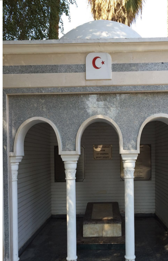
Genç Osman Anıt Mezarı