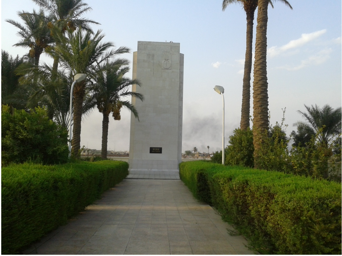
Kut Şehitlik Anıtı

23 Ekim 1914'te Bahreyn adalarını işgal eden İngilizler 5 Kasım 1914'te Osmanlı Devleti'ne savaş ilân etmelerinin ardından 6 Kasım'da Şattü'l-arap'ın ağzında, Basra körfezindeki Fâv boğazını işgal ederek "Mezopotamya Seferi" harekâtıyla I. Dünya Savaşı'nın Irak cephesini fiilen başlatmışlardır. 3 Ocak 1915'te Basra Valisi ve 38. Basra Fırkası (Tümen) Kumandanlığına atanan Binbaşı Süleyman Askerî Bey 12-14 Nisan 1915'te Şuayyibe'de 3.000 şehit ve yaralı, 800 esir olmak üzere birliklerinin yarısını kaybetmenin üzüntüsüyle intihar etmiştir 33 . İngilizler 1915 sonbaharında Bağdat üzerine yürüyüşe geçmişlerse de 22-26 Kasım 1915'te şehrin 40 km. güneydoğusunda büyük bir yenilgiye uğrayarak 160 km. güneydoğudaki Kütü'l-Amâre'ye çekilmişlerdir 34 . Kütü'l-Amâre, Mirliwa (Tümgeneral) Halil (Kut) Paşa tarafından 7 Aralık 1915-29 Nisan 1916 tarihleri arasında 4 ay 23 gün kuşatılmıştır. Sonuçta, 5 general, 476 subay ve 12.828 erden oluşan 13.309 mevcutlu İngiliz kuvveti 2.000 kişilik Türk birliğine teslim olmak zorunda bırakılmıştır 35 . Halil Paşa savaş sonunda yayınladığı bildiride; VI. Ordu'nun gerek Kut kuşatmasında gerekse burayı kurtarmaya gelen İngilizler karşısında şehit ve yaralı 300'den fazla subayla 10.000'e yakın erini yitirdiğini belirtmiştir. İngilizlere ise teslim olan birliğinin yanı sıra çoğunluğu kuşatmayı kırmak için yapılan harekâtlarda olmak üzere 30.000 kayıp verdirilmiştir 36 .