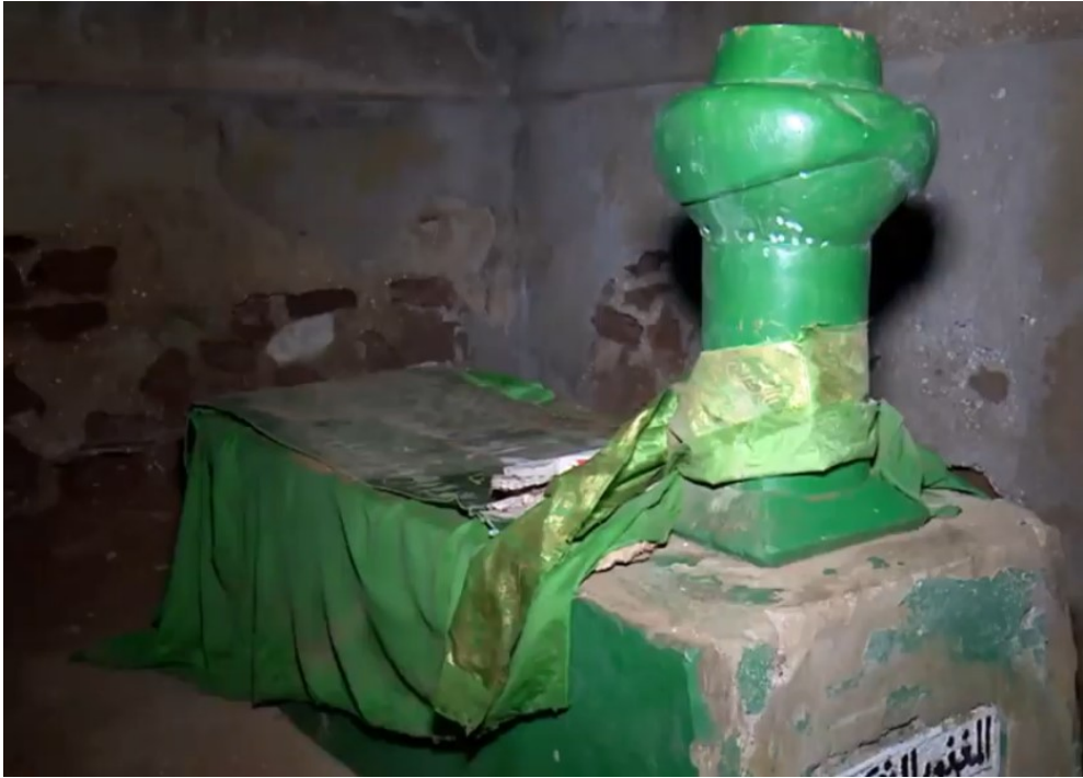
Serasker Osman Paşa Kabri

Eskiyaka'da İmam Kasım semtindeki, üstü kapalı 26 m 2 'lik tek kubbeli kümbet özel mülkiyetteki bir meskenin içerisinde 50 . Girişinde kitâbesi mevcuttur 51 . Türbedeki kabirde, duvara yakın konumdaki dikdörtgen blok üzerinde yeşile boyanmış sarık başlıklı mermer mezartaşı ve zemine yakın mermer bir panoya özensizce işlenmiş üç satırlı kitâbe yer almaktadır.