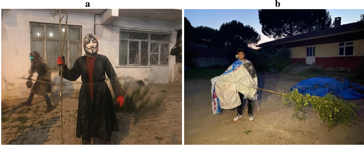
Fotoğraf 3: Mancılık mahallesinde araplar çeşitli maskeler kullanmaktadır (a). Orhanlar mahallesinde ise arap ya da delikadınların çuvaldan hazırlanan örtüyü giydikleri görülmektedir (b).

Deve oyunu genellikle akşamları oynanmakta, oyun süresince deve oyun alanına toplanan kişilerin üzerine doğru giderek korkutmaya, kaçırmaya çalışmaktadır. Bu süreçte şapka alma, evlerin önüne gidip kavurma isteme gibi oyunlar çıkarılmakta olup, devenin içerisine girenler yoruldukça değiştirilmektedir. Sadece akşamları deve oyununun oynandığı yerlerde, deve oyunu yaklaşık iki saat boyunca devam etmektedir. Orhanlar mahallesinde deve oyununun oynanma şekli kaynak kişi tarafından şu cümlelerle anlatılmıştır: “Deve kahveye doğru gelince herkes kahvenin içerisine kaçar, kapıyı kapatırlar, sen dışarda kaldıysan kemik ağzıyla şapkayı kapar gider, sen peşinden almaya gidince on beş, yirmi lira para isteyip şapkayı geri verir. Genç kızların kadınların üzerine doğru yürür, onları kaçıtır” (KK 3). Ayrıca Mancılık, Doğanlar, Müstecap, Çakallar mahallerinde devenin yanında arap adı verilen (kadın kıyafeti (ferace) giyip yüzünün siyaha boyanması ile oluşturulan tiplene) (Fotoğraf 1a) kişilerin olduğu ve arapların elinde çırpak (uzun dalları olan sopa) ile oyuna katılanları kovaladığı belirtilmiştir. Günümüzde araplar yüzünü siyaha boyamak yerine korkutucu ve ışıklı maskeler takarak oyuna katılmaktadır (Fotoğraf 3a). Orhanlar mahallesinde de elinde çırpak ile oyuna katılanları kovalayan kişilere arap ya da deli kadın denilmektedir (Fotoğraf 3b).