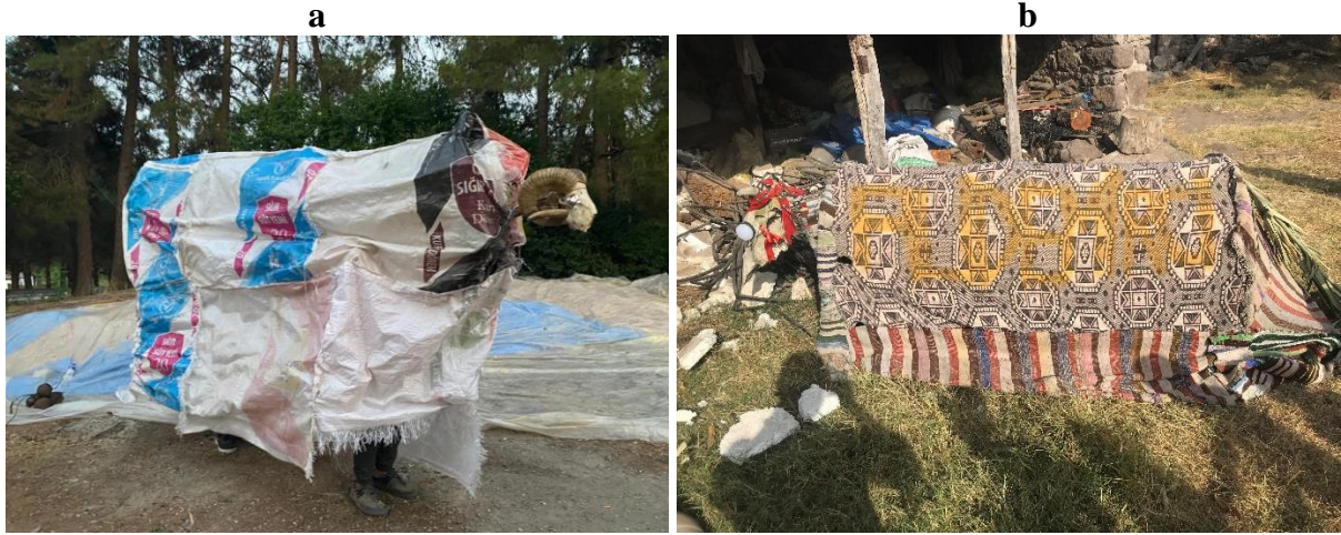
Fotoğraf 2: Orhanlar Mahallesi'nde devenin örtüsü çuvallardan hazırlanırken (a), Alidemirci mahallesi'nde eski kilimler kullanılmaktadır (b).

Deve oyununun oynanma yeri olarak genellikle meydanlık alanlar tercih edilmekle birlikte, bazı kırsal mahallelerde oyun boyunca köy içerisinde dolaşıldığı tespit edilmiştir. Deve oyunu çalışma alanını oluşturan mahallelerin tamamında açık havada oynanmaktadır. Oyunun oynatılacağı yer seçiminde de meydanlık bir alan olması ve kaçılacak ara sokakların bulunmasına özen gösterilmektedir. “Mekânların oyunlar üzerinde sınırlayıcı, özgürleştirici, alan açıcı, anlam yükleyici, düzen belirleyici ve atmosfer oluşturucu şeklinde birçok etkisi olduğu görülmektedir” (Sevindik, 2021: 139). Bu duruma paralel olarak, Mancılık mahallesi'nde deve oyununun oynanma yeri seçimi kaynak kişi tarafından şu cümlelerle ifade edilmiştir: “Deve Mancılıkta hep aynı yerde oynanır. Oyunun oynandığı meydan oyuna çok elverişlidir. Burada sokaklar dar kaçış yeri çoktur. Bir kere köy meydanına getirilip oynandı, olmadı. Çünkü orası çok geniş bir meydandı. Millet kaçacak yer bulamadı. Evine giden gelmedi” (KK 1).