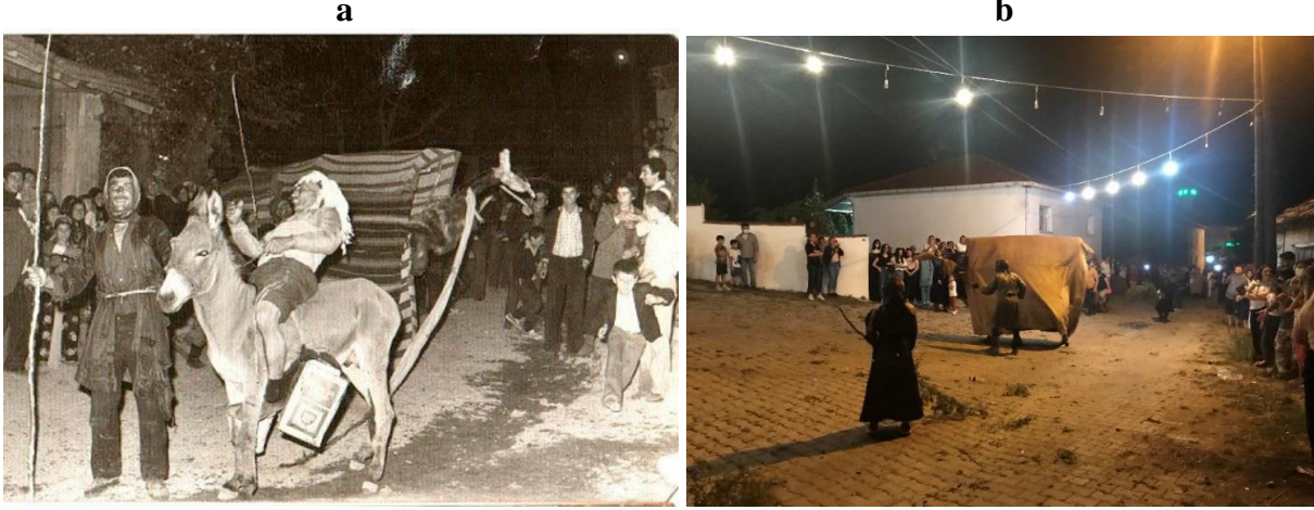
Fotoğraf 1: Mancılık mahallesinde eski deve oyunlarında devenin üzerini örtmek için çul kullanılmaktadır (a) (URL-2). Günümüzde ise devenin üzeri kadifeden dikilmiş örtü ile örtülmektedir (b).

“Eskiden herkes özellikle delikanlılar evinden çul getirirdi. Devenin iki tarafına ve önüne çul dikilir, arkasına çul çuval dikedik. İçinde keçi çanları olurdu. Develerin kulakları çavdar sapından kafası kemikten boynu ağaçtan yapılırdı” (KK 1).