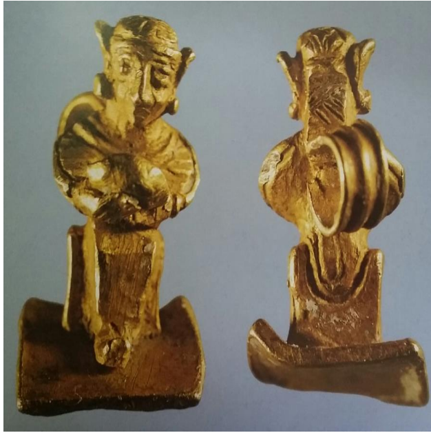
Resim-7: Altından tanrıça pandantifi, bk. Bingöl, s. 135.