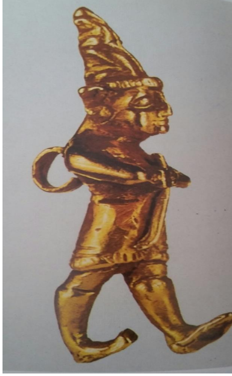
Resim-8: Altın tanrı heykeli, bk. Darga, Hitit Sanatı , s. 104.