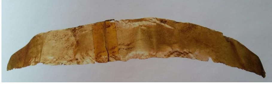
Resim-12: Altın diadem, bk. T. Özgüç, Kültepe-Kaniş/Neša , s. 225.