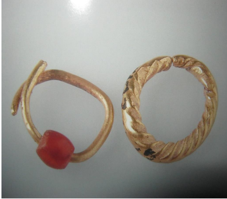
Resim-9: Altın ve akikten yapılmış küpeler, bk. Anadolu'nun Önsözü , s. 315.