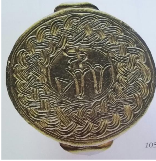
Resim-2: Lalasu adlı kişiye ait altından yapılmış yüzük mühür, bk. Bingöl, s. 168.