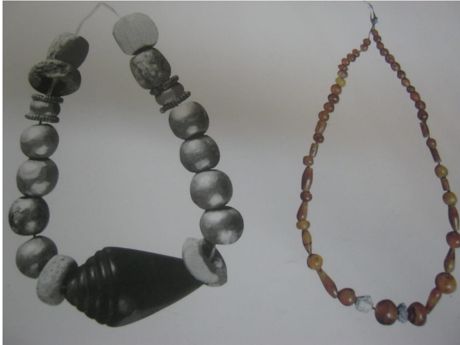
Resim-5: Gerdanlıklar, bk. T. Özgüç, Kültepe-Kaniş/Neša , s. 229.