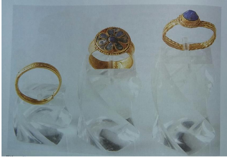
Resim-1: Yüzükler, bk. Darga, Anadolu'da Kadın , s. 120.