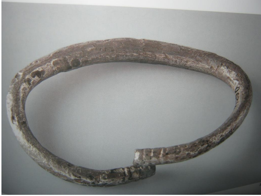
Resim-4: Gümüş bilezik, bk. Anadolu'nun Önsözü , s. 313.