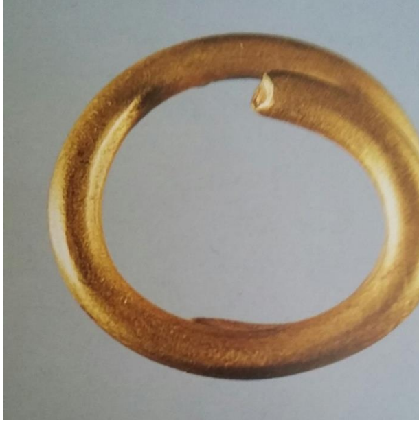
Resim-11: Saç halkası, bk. Bingöl, s. 101.