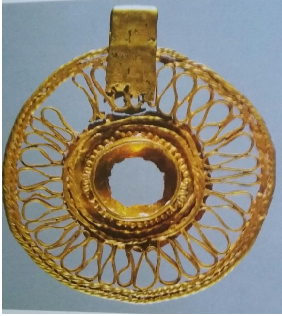
Resim-6: Telkari tekniğiyle yapılmış altın pandantif, bk. Bingöl, s. 136.