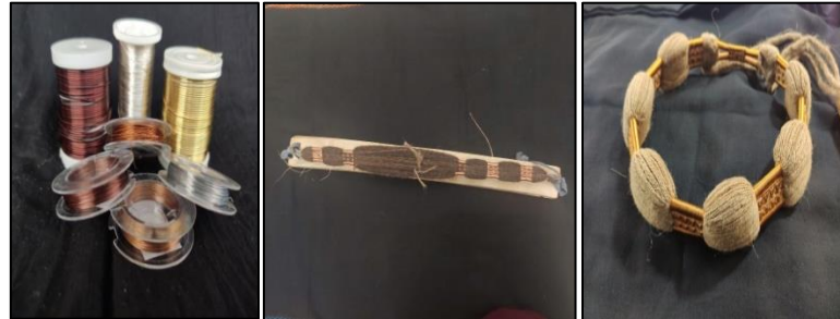
Bakır ve gümüş teller, bakır teller ile örülmüş yassı iggal/egal

Şanlıurfa’da yassı iggal/egal yaparken kazaz ustaların gümüş ve bakır teller kullanmışlardır. Şanlıurfa’da bakır tel daha çok tercih edilmiştir. İş ağacına sarılan yün ipliklerin üzerine tellerin belirli yönde sarılıp desenler elde edilmiştir.