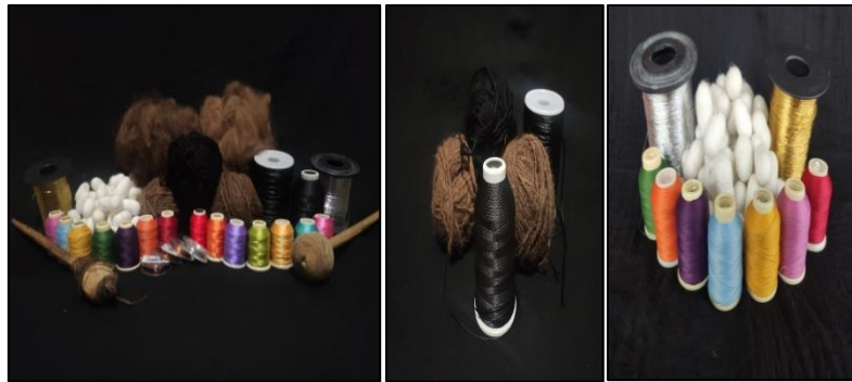
Kazazlıkta kullanılan iplikler

Geçmiş yıllarda Şanlıurfa'da kazazlık sanatı ile uğraşan ustalar deve ve koyun yünü, ipek, floş, sim, naylon, orlon vb. birçok iplik çeşidini kullanarak bu sanatı yıllarca sürdürmüşlerdir. İpekçilik Urfa'da 100-150 yıl öncesine kadar önemli bir sektör durumundaydı. Urfa bahçelerinde bugün de görülen çok sayıda dut ağacının zamanında ipekböcekçiliğinde kullanıldığı yörenin yaşlıları tarafından dile getirilmektedir. Geçmiş dönemlerde ipekçilik tamamen terk edildiğinde ipek iplikler kazaz esnafları tarafından Diyarbakır, Bursa'dan getirilmiştir (Kürkçüoğlu ve Kürkçüoğlu, 2011: 92). Floş, naylon ve orlon iplikleri ustalar tarafından doğal ipliklere alternatif olarak kullanmışlardır.