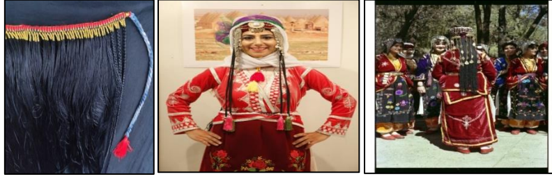
Raht detayı Ön detay Arka detay