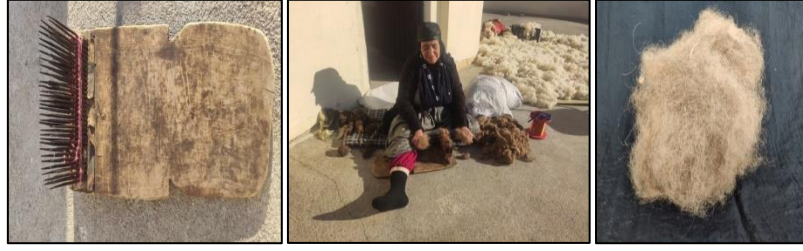
Basit el tarağı ve deve yününün taranması işlemi