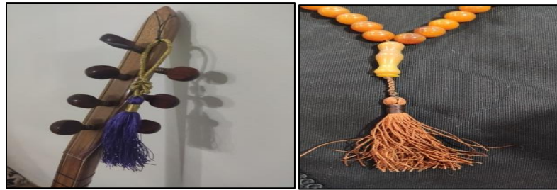
Saz/bağlama ve tespih püskülü

Eski dönemler kullanılan köstekli cep saatinin yelek ve saat arasındaki bağlantı kısmını sağlamak için ve kendilerini korumak için kullandıkları silahları taşımak için 1- 2 cm genişliğinde kaba ibrişimle kazazlık teknikleri kullanılarak örülmüş kaytan, kordonlar işlevsel özelliğinin yanında aksesuar görevi de üstlenmiştir. Günümüze kadar gelmiş örnekleri bulunmamaktadır.