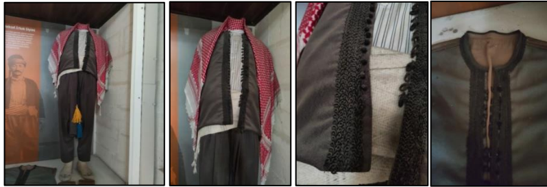
Şanlıurfa Kent Müzesi kırk düğme yelek genel ve detay örneği

Yarım kollu, siyah, kahverengi, lacivert, yeşil, gri, yeşil, gabardin kumaştan yapılan yörede geleneksel erkek giyiminde kullanılan “ kırk düğme göynek ” diye tabir edilen sıfır yakalı, kısa ve uzun kollu boyu bel hizasında bir cepken de giyilmektedir.