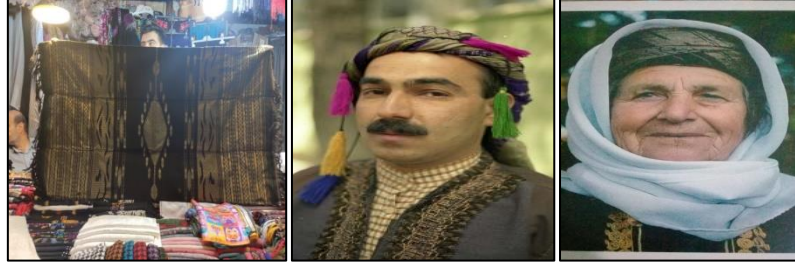
Sırmalı puşi genel görüntüsü Erkeklerde sırmalı puşi kullanımı Kadınlarda sırmalı puşi /köfü kullanımı

“Şanlıurfa’da dokuma tezgâhlarında sırmalı puşi (şeğr) yün ya da pamuk ipliğinden 80x80 cm ebatlarda kare şeklinde dokunan çok ince bir örtü çeşididir” (Karakeçili, 1997: 48). Kazazlar kenar saçıklarını büküp dört tarafına renkli püsküller yerleştirilmiştir. Erkeklerin kullandığı baş ve boyun donatısıdır. Kadınlar köfü/köfi denilen başlıkta da kullanılmıştır.