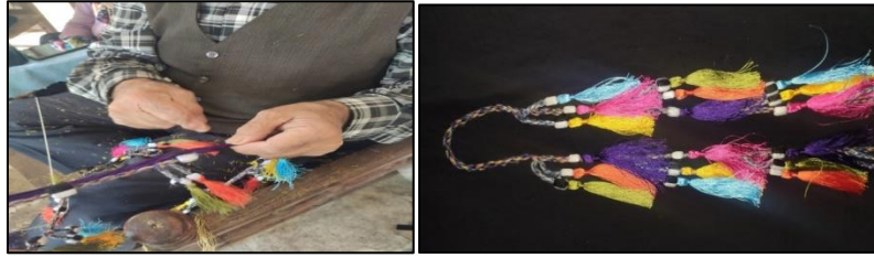
Renkli kaytanı yapımı ve renkli altın kaytanı örneği

Ortalama 110-120 cm uzunlukta pamuk ipliğin üst kısmına renk dizilimi turuncu-mor-yeşil ve sarı-mavi-pembe diye gruplandırılarak ipek iplikler ile oluşturulan ve her püsküle çirişten yapılıp örülmüş boncukların iplik üzerine dizilmesiyle oluşan kadın baş donatısıdır.