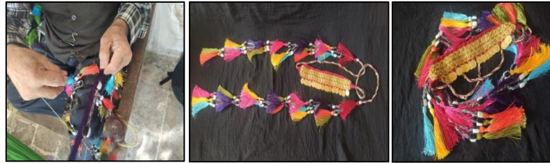
Renkli altın kaytanı yapımı, genel ve detay örneği

Geçmişte kadınların baş süslemesinde kullanmış alın kısmına kırmızı renkte ve üzeri altın sırma şeritlerden oluşan bir birit yerleştirilip ucuna altınlar takılan 200-220 cm uzunluğunda pamuk iplik üzerine yan yana sarı-pembe-mavi ve turuncu-mor-yeşil renkte ipek iplikten yapılan 38 tane püskül ve her püskülün üst kısmına patiska ve çirişten hazırlanıp örülmüş boncuklar geçirilerek oluşturulan bir baş donatısıdır.