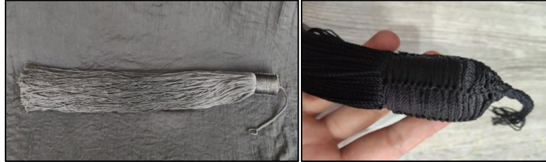
Suruç top püskül genel ve detay örnekleri

Şanlıurfa’nın Suruç ilçesinde kadınların geleneksel giyiminde yer alan köfü/köfi başlıkla birlikte kullanılan ortalama 75-85 cm uzunluğunda ipek veya floş iplikler ile kazazlık teknikleri kullanılarak yapılan bir kadın baş donatısıdır. Günümüzde kullanılmamaktadır.