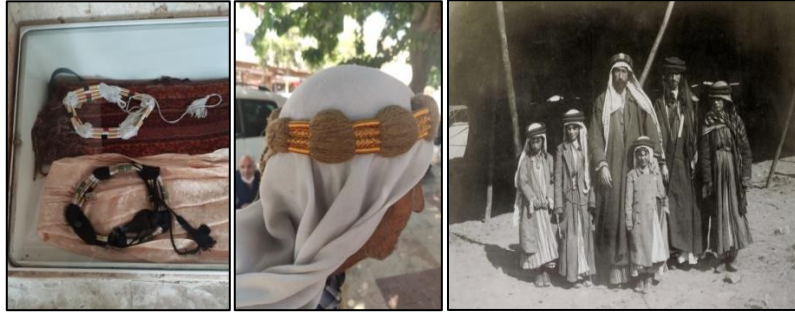
İggal/egal örnekleri Küçük yaşlarda iggal/egal kullanımına örnek

Geleneksel erkek giyiminde erkelerin kullandıkları puşuyu başa tutturmak için ipek ve yünden tasarlanmış yuvarlak formlu başlığa iggal/egal denilmektedir (Kürkçüoğlu, Kürkçüoğlu, 2011: 92). Top ve yassı iggal/egal olmak üzere iki çeşidi bulunmaktadır. Geçmişte çok küçük yaşlarda takılmaya başlanan iggal/egal günümüzde daha çok yaşlı insanlar tarafından tercih edilmektedir. Şanlıurfa merkez, Siverek, Harran ve Akçakale ilçelerinde günümüzde günlük yaşamda hala yaygın olarak kullanılmaktadır.