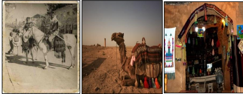
Heybe, havut ve duvar süslemesi örnekleri

Bölgede dokunan aba, kilim, heybe, yük taşımada binek hayvanlar için kullanılan birçok dokuma üründe kazazlık tekniklerine yer verilmiştir (KK4). Kimi zaman heybeye takılan bir sap ya da püskülde kullanılırken, kimi zaman bir at koşum takımında kullanılan süslemelerde, bele bağlanan bir kolon dokumada, kilimlere yapılan püsküllerde, çadırlarda yapılan süslemelerde ve gerek duyulan şeritlerde vb. birçok dokumada kazazlık tekniği olan kordon ve şeritler kullanılmıştır. Aynı şekilde yük taşımada da kullanılan havut, heybelerde, bayram ve özel günlerde atlarını ve yetiştirdikleri hayvanlarını güzel göstermek için ibrişimlerden, kaytanlardan yapılmış yularlar ve at koşum takımlarında eyer ve başlıkları renkli ve gösterişli püskülleri oluştururken kazazlık tekniklerini kullanmışlardır.