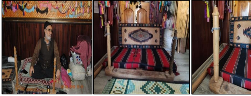
Kazaz atölyesi ve iş ağacı

“Kazaz ustalarının en önemli aracı iş ağacıdır. Kazaz ustası işlerini bu basit aletti kullanılarak yapmaktadır. İş ağacı 40 cm uzunluğunda 15 cm eninde yassı bir tahta üzerine dikine yerleştirilen 30 cm uzunluğunda ve 3 cm çapında yuvarlak iki ahşap parçadan oluşan iş ağacı üzerinde gerçekleştirilir. Yuvarlak ahşap parçaların üst kısmı iplikleri tutacak şekilde tasarlanmıştır. Aynı zamanda bu parçalar yassı tahtadan çıkarılıp takılma özelliğine sahiptir” ( Akpınarlı, vd. 2012:310). Kazaz ustası bu iş ağacına yapacağı ürüne göre iplikleri yerleştirerek işlemler yapmaktadır. Portatifir rahatlıkla istediği yere bu ağacı taşıyabilmektedir.