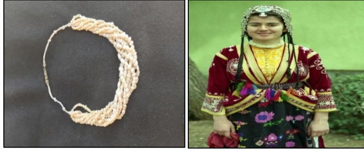
İnci kuru İnci kuru kullanımı

Kazaz ustaları ve kazazlık tekniğini bilen kuyumcular tarafından ipek ya da floş ipliğe geçirilen incilerin 7 sıra (kor) olacak şekilde uç kısımlarının örülmesi ile oluşan bir boyun takısıdır. Şanlıurfa'da özellikle genç kızlar tarafından takılmıştır. Eski dönemlerde her kız mutlaka bir inci kuru takmaktaydı (KK3).