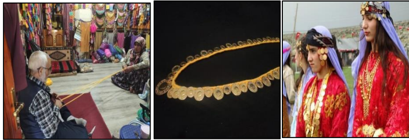
Altın kaytanı yapımı ve altın kaytanı Karakeçi Şenlikleri

Sarı ipekten 2-3 cm genişliğinde, 70 ve 100 cm uzunluğunda altın lira, gaziye vb. altınlar dizilerek kullanılan boyun takısıdır. Evlerde kazaz ustalarının eşleri ve yakınları tarafından örülmüştür (KK2). Geçmişte ipekten örülürken günümüzde farklı orlon iplikler ile örülmeye devam edilmekte ve bu takı yaygın olarak kullanılmaktadır.