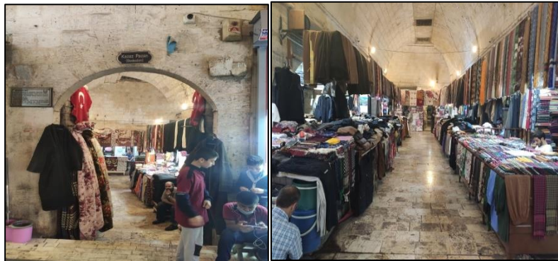
Kazaz Pazarı