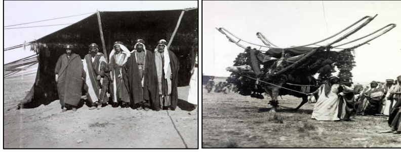
Aba ve havut örneği

Geçmiş yıllarda sıkça kullanılan abaların ön kısımlarında kullanılan şerit ve kaytanlarda kazazlık teknikleri kullanılmıştır. Abaların ön kısmında yer alan bağlantı yerlerine kullanılan iplik, düğme ve püsküllerde kazazlık teknikleri kullanılmıştır (KK1). Aba kadınlar tarafından giyildiği gibi erkekler tarafından da tercih edilmiştir. Günümüzde de hala yaygın olarak kullanılmaktadır (KK5).