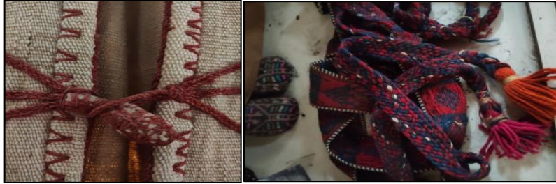
Aba düğmesi ve kemer örneği

Şanlıurfa ve çevresinde kazazlık sanatı kadın ve erkek giyiminin tamamlayıcı unsuru olarak yaygın kullanılmaktaydı. “Kazazlıkta kullanılan şeritlere, çeşitli maddelerden yapılan dar, uzun, yassı, örülmüş ve dokunmuş bant ve kolonlara” (Eronç, 1984: 180) verilen isimdir. “Birkaç ipliğin bir arda bükülmesi ve örülmesi ile oluşan kaytanlara kordon denilmektedir. Elle yapılan kordon ve şeritler ipliklerin yer değiştirmesi, bükülmesi ve örülmesi ile oluşturulmaktadır. Baş süslemelerinde, heybe ve çantaların saplarının yapımında, saç örgülerinde, kullanılan şerit ve kordonların yapımında isteğe bağlı ister tek renk iplik ister iki veya daha fazla renk iplikler kullanılmıştır. Geçmiş dönemlerde yaygın olarak ipeğin kullanıldığı bir tür ilmeksiz ve ilmekli örgüler, bugün iplik özelliğine sahip malzemeler ile çeşitli aksesuarlar oluşturulmuştur” (Akpınarlı, vd. 2012:307).