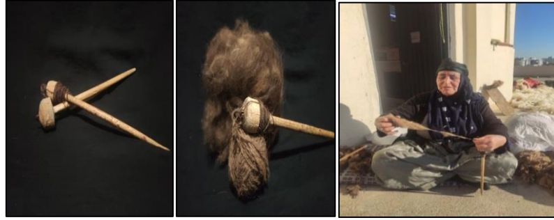
Teşi ( iğ/kirmen) yünün eğirilmesi

Deve ve kahverengi koyun yünler temizleme işlemlerinden sonra iplik duruma gelmesi için makinada ya da elde taranması gerekir. ‘ Bu işlem genellikle basit el tarağında kadınlar tarafından yapılmıştır. Basit bir el tarağı yassı bir tahta üzerine belirli aralıklarla yerleştirilmiş iki sıra çivilerden oluşan aletlere verilen isimdir. Tarama işlemini yapan kişi, iki eliyle tuttuğu bir tutam yapağıyı el tarağının dişleri arasına geçirerek yapağıyı her iki taraftan çeker. Kısa ve kirli elyaf tarak üzerinde dişlilerin üzerinde kalarak paralel ve tül haline gelen liflerden ayrılarak tarak üzerinde kalır. Çekme işlemi sırasında her iki elde kalan parçalar birleştirilir ve bu işlem defalarca tekrarlanarak lifler paralelleştirilir ’ (Uğurlu, 2018: 17).