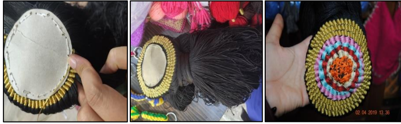
Zaza püskülü yapımı genel ve detay görünümü (Hanım Handan Ağırmatlı Arşivi)