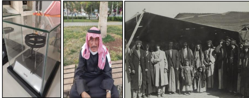
Top iggal/egal (Hanım Handan Ağırmatlı Arşivi) Geçmiş dönemde iggal/egal kullanımı (Yasin Küçük Arşivi)

Kazaz ustası 8 mm genişliğe 1 m uzunluğa sahip kendir ipliğinin üstünü siyah ipek veya floş iplik yardımıyla aralık kalmayacak biçimde sıkıca sarıp uç kısımları bağlar ve sarkıtılan kısımlara püsküllerin yerleştirip oluşturduğu çift kat olarak erkekler tarafından kullanılmakta ve yörede başlığa top iggal/egal denilmektedir.