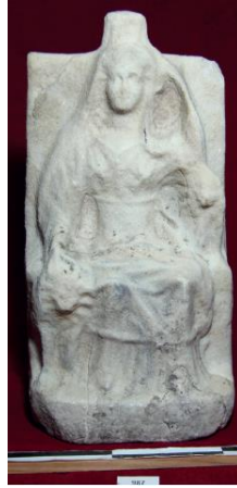
Res. 5: Nikomedia'dan Mermer Kybele Heykeli (Çibuk 2017)

üzerinde cepheden ayakta duran bir aslanın üzerine yaslamaktadır. Ancak bu örnekte tanrıçanın sağ tarafında, zeminde cepheden ayakta betimlenmiş ikinci bir aslan da görülmektedir.