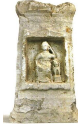
Res. 11: Kandıra’dan Kybele Betimli