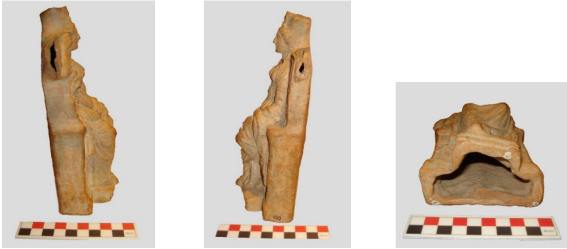
Res. 2: Kastamonu Müzesi'nden Terrakotta Kybele Figürininin Profil ve Tabanı