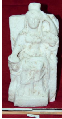
Res. 8: Prainetos'tan Mermer Kybele Heykeli (Çibuk 2017)

(Bursa ili, İznik ilçesi)'da bulunmuş ve MS 1. yüzyıla ait mermer bir heykel 47 ile yine Nikaia'dan Roma İmparatorluk Dönemi'ne tarihlendirilmiş benzer diğer bir mermer heykelde 48 Kybele'nin başı ve sol kolu eksik olmasına rağmen bu iki eserin de Prainetos'tan gelen Kybele heykeli ile aynı tipte olduğu söylenebilir.