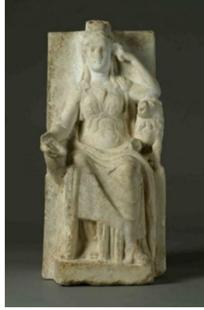
Res. 6: Anadolu'dan Mermer Kybele Heykeli ( http://teecemuseum.nz/collection-item/212732/ )

Buluntu yeri bilinmeyen bir diğer örnek, MS 1.-2. yüzyıla tarihlendirilmiş mermere yakın kireçtaşıdan yapılmış adak yazıtıdır (Res. 7). Bir tapınağın içerisinde tahtında oturan tanrıça, önceki örneğe benzer şekilde sağ elinde patera tutmaktadır. Tanrıça, sol tarafında yer alan platform üzerinde ve cepheden ayakta betimlenmiş bir aslanın başına dirsekten kıldığı sol koluyla dayanmakta ve sol elini de kendi başına yaslamaktadır. 44 Ayrıca Nikomedia (Kocaeli ili, Körfez ilçesi, Himmetli köyü)'da bulunmuş yine MS 1.-2. yüzyıla tarihlendirilmiş kireçtaşıdan yazıtlı bir heykel parçasında tanrıçanın sol kolu tahrip olmasına rağmen bu örnekte de büyük olasılıkla Kybele'nin aynı tipi betimlenmiştir. Zira tanrıça, kendi göğsü hizasında ve cepheden ayakta gösterilmiş bir aslana sol kolunu yaslamış ve sağ elinde de patera tutmaktadır. 45