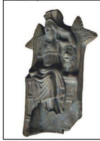
Res. 4: Tokat'tan Terrakotta Kybele Figürini (Kaymakçı 2012)

Kastamonu Kybele'sine tipolojik olarak benzer diğer tüm örnekler çoğunlukla mermer eserlerdir. Yukarıda sözü edilen Miletopolis örneği dışında sadece iki örnek terrakottadır. Otrioia (Bursa ili, Yenişehir ilçesi)'da bulunmuş ve Hellenistik Dönem'e, MÖ 2. yüzyıl sonu – MÖ 1. yüzyıl başına tarihlendirilmiş bir figürinde tanrıça yine yüksek arkalı kanatlı tahtında ve cepheden görülmektedir. 38 Tanrıça sağ elinde bir patera tutmakta ve bunu sağ yanında ayakta cepheden betimlenmiş bir aslanın adeta başına dokundurmaktadır. Tanrıça sol kolunu da dirsekten kırmış ve elini başına dayamaktadır. Tanrıçanın sol dirseğini dayadığı bölüm tahrip olduğu için bir zamanlar burada bir aslan ya da tympanon mu yer aldığı bilinmemektedir.