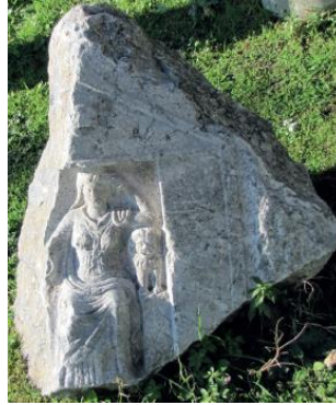
Res. 7: Anadolu'dan Kybele'ye Adanmış Kireçtaşı Adak Steli (Çibuk 2017)

Buluntu yeri bilinmeyen bir diğer örnek, MS 1.-2. yüzyıla tarihlendirilmiş mermere yakın kireçtaşıdan yapılmış adak yazıtıdır (Res. 7). Bir tapınağın içerisinde tahtında oturan tanrıça, önceki örneğe benzer şekilde sağ elinde patera tutmaktadır. Tanrıça, sol tarafında yer alan platform üzerinde ve cepheden ayakta betimlenmiş bir aslanın başına dirsekten kıldığı sol koluyla dayanmakta ve sol elini de kendi başına yaslamaktadır. 44 Ayrıca Nikomedia (Kocaeli ili, Körfez ilçesi, Himmetli köyü)'da bulunmuş yine MS 1.-2. yüzyıla tarihlendirilmiş kireçtaşıdan yazıtlı bir heykel parçasında tanrıçanın sol kolu tahrip olmasına rağmen bu örnekte de büyük olasılıkla Kybele'nin aynı tipi betimlenmiştir. Zira tanrıça, kendi göğsü hizasında ve cepheden ayakta gösterilmiş bir aslana sol kolunu yaslamış ve sağ elinde de patera tutmaktadır. 45