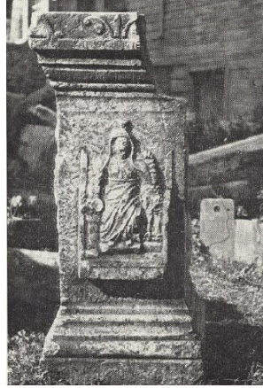
Res. 9: Nikomedia'dan Kybele Betimli Mermer Sunak ya da Kaide (Schwertheim 1978)

Nikomedia'da (Kocaeli ili, İzmit ilçesi, Deli Mahmutlar mahallesi) ele geçmiş ve Antoninus Pius Dönemi'ne, MS 155-156 yıllarına tarihlendirilmiş mermer bir kaide ya da sunağın (Res. 9) sağ kısmında da tanrıçanın aynı tipte betimi mevcuttur. Tahtında oturan Kybele, sol kolunu dirsekten kırarak tahtın hemen yanında alçak bir kaide üzerinde ayakta ve cepheden betimlenmiş bir aslanın üzerine dayamış ve sol elini de başına doğru tutmaktadır. Tanrıçanın hafif ileri doğru uzattığı sağ elinde bir patera tuttuğu görülmektedir. 49