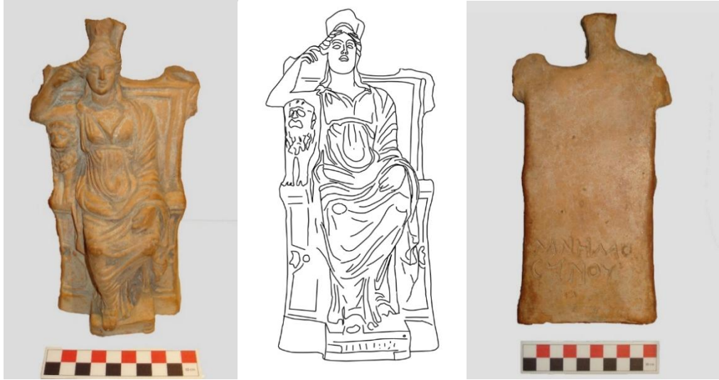
Res. 1: Kastamonu Müzesi'nden Terrakotta Kybele Figürininin Ön ve Arka Yüzü (Çiz. D. G. Erdem)