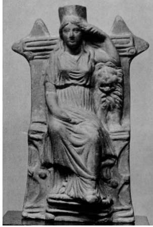
Res. 3: Miletopolis'ten Terrakotta Kybele Figürini (Neugebauer 1938)

tanrıçanın sağ ayağı geri çekilmişken sol ayağa ilerde ve bu hareket ile giysinin altından dizler vurgulanmıştır.