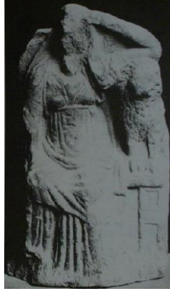
Res. 10: Anadolu’dan Mermer

daha kütleli formdadır. Tanrıçanın söz konusu betim tipi, Naumann tarafından bu eser üzerinden “Bithynia Tipi” olarak adlandırılmıştır. 51 Bu örneğe benzer formda bir Kybele betimi (Res. 11) de Kocaeli’nin Kandıra ilçesi, Hacılar köyündeki Yağbolu mevkiinde bir mağarada keşfedilmiştir. Roma Dönemi’ne (MS 2. yüzyıl) tarihlendirilmiş, yerel sarı kumtaşından yazıtlı sunağın ön kısmında Kybele, üçgen alınlıklı ve iki sütunlu naiskos içerisinde tahtında otururken görülmektedir. Tanrıça, sağ elinde patera tutmakta iken dirsekten kırdığı sol kolunu sol tarafında bir sunak üzerinde cepheden ve ayakta betimlenmiş bir aslanın üzerine, elini de başına dayamaktadır. 52 Naumann’ın bu tipi isimlendirdiği şekilde Kandıra Kybele’si için de Karahan vd. “Bithynia Tipi” terimini uygun bulmuş ve bu eser için kullanmışlardır. 53