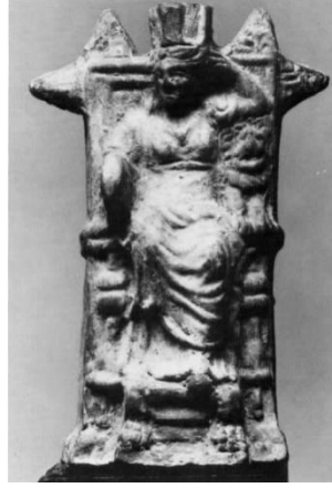
Res. 12: Corinth'ten Terrakotta Kybele Figürini (Vermaseren 1982)

Tahtında oturan Tanrıça Kybele'nin bir kolunu dirsekten kırarak aslan ya da tympanona dayadığı ve elini de başına yasladığı formu Anadolu dışında da tespit edilmiştir. Corinth'te bulunmuş terrakotta bir Kybele figüründe (Res. 12) Anadolu örneklerinden farklı olarak tanrıça, her iki kolunun altında aslan ve tympanon ile birlikte görülür. 57 Yüksek arkalıklı kanatlı tahtında ve cepheden betimlenen tanrıça, başını sağa doğru çevirmiştir. Sağ kolu ile tympanona yaslanan tanrıça, sol kolunu da dirsekten kırmış ve tahtın kolçağında, cepheden ayakları üstünde betimlenen aslanın üzerine dayamıştır. Tanrıça, sol eli ile de sur taçı başına dokunmaktadır.