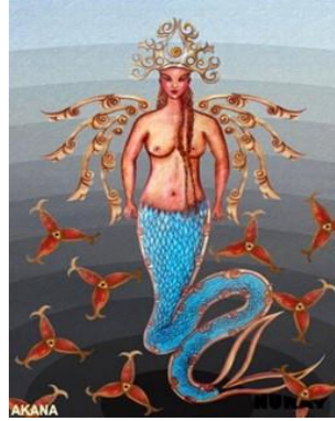
Görsel 3. Su İyesinin Tasviri (URL-3). Görsel 4. Ak Ana Tasviri (URL-4).