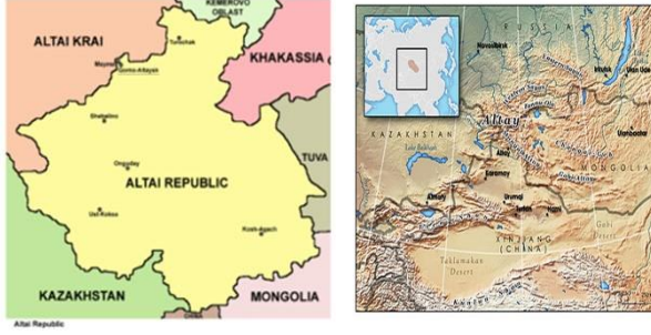
Görsel 1-2. Altay Cumhuriyet Haritaları (URL-1, URL-2).