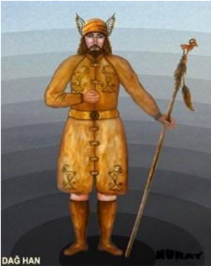
Görsel 16. Dağ Han (URL-16).