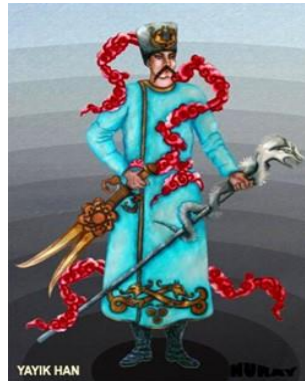
Görsel 10. Od Ana Tasviri (URL-10). Görsel 11. Yayık Han (URL-11).