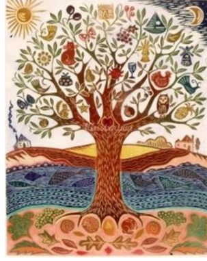
Görsel 15. Nardugan Bayramını ve Ağacını Tasvir Eden Görsel (URL-15).