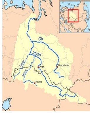
Görsel 6. Saçı Saçan Bir Şaman (URL-6). Görsel 7. Obi Nehrinin Haritası (URL-7).