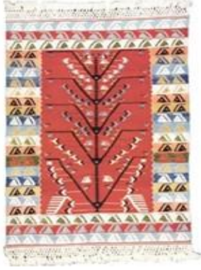
Görsel 14. Hayat Ağacı Motifi (URL-14).