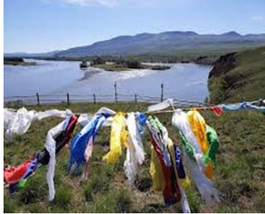
Görsel 5. Calama Ritüeli (Çaput Bağlama) (URL-5).