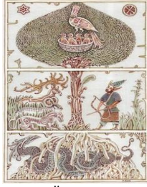
Görsel 13. Üçlü Dünya (Gökyüzü, Yeryüzü, Yeraltı) (URL-13).