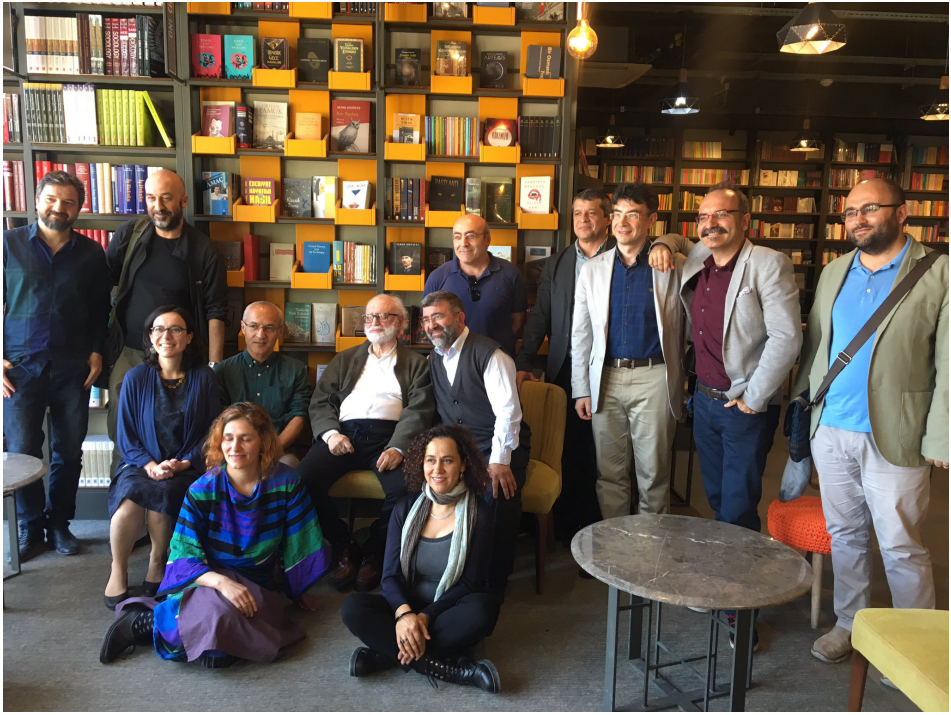
Fotoğraf 1: Rifa'at Ali Abou-El-Haj İstanbul Şehir Üniversitesi'ndeki konuşması öncesi öğrencileri ile (Nisan 2018)

Şehir Üniversitesi'nde ana konuşmasının moderatörlüğünü yaptığım için kendisini takdim etmeden önce benden özellikle konuşmanın "samimi bir sefer" olarak takdim edilmesini istemişti. Öyle de yaptım. İstanbul konuşmalarını hoca "Sefer 2018" diye tanımlamıştı. İstanbul'a yaptığı bu seyahatte kendisini hiç olmadığı kadar evinde hissettiğini seyahatten sonra birçok kez bana ve yazdığı diğer talebelerine ifade etmişti. Yine bu ziyareti sırasında yaptığı bir konuşmada merhum Halil İnalcık Hoca'yla olan bir anısından söz etmiş, 1980'de Viyana'da bir konferans sonrası Halil İnalcık Hoca'nın, elini omuzuna atıp ona "İslâm'ın gücü" (Kuvvet-i İslâm) diyerek yakınlık gösterdiğini anlatmıştı. Özel yazışmalarımızdan yola çıkarak şunu rahatça söyleyebilirim ki hoca son yıllarında, çocukluğunda annesinden aldığı değerler üzerinden kendini yeniden keşfetmiş ve ontolojik düzlemde yeniden konumlandırmıştı. 20 Nisan 2021'de bana yazdığı e-maili kendisini şu şekilde tanımlayarak sonlandırmıştı: "Seni daima seven, İslâm dininde kardeşin Rifa'at." Hocamızı derin hürmet ve muhabbetle anar, ruhuna Allah'tan sonsuz rahmetler dilerim.