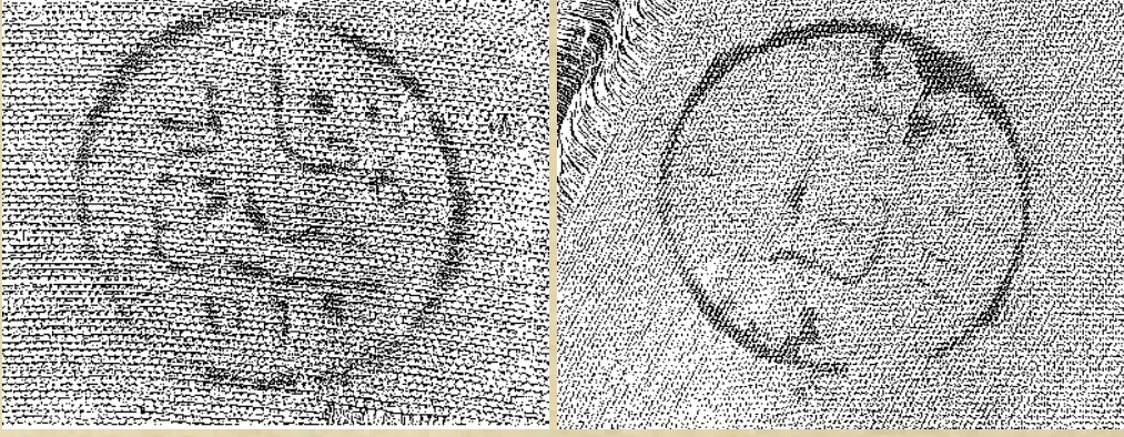
Şekil 1: Topkapı sarayında bulunan Sakız'da dokunmuş seccade arkasındaki Sakız gümrüğüne ait damgalar. Atasoy vd., İpek Osmanlı Dokuma Sanatı, s. 174.