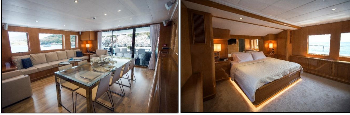
Görsel 2. Mega yat oturma salonu ve kamarası

Monaco dünyanın sayılı zenginlerinin yatları ile ilk uğradıkları yatçılık açısından en önemli merkezlerden biridir. Monaco 2003 yılında limanın dışında büyük bir yarı yüzer iskele inşasından sonra yatların ana giriş kapısı hâline gelmiştir. 2012 yılında 246.000 kişi Monaco'ya gelmiştir (D'Hautesserre, 2016). Dünya yatçılığının merkez destinasyonu olarak ifade edebileceğimiz Cote d'azur kıyı şeridi Saint-tropez, Antibes, Cannes, Villafranch, Nice gibi markalaşmış şehirlere yakınlığı ile Monaco oldukça önemli bir konumda yer almaktadır. Yatçılık sektöründe özellikle kıyı peyzajı açısından zenginlik lokasyon tercihi açısından önemli bir yer tutmaktadır. Fakat Monaco'nun plajlarının, restoranlarının, otellerinin ve kumarhanelerinin elit kitlelerce tercih edilmesi nedeniyle ayrıca bir cazibe merkezidir.