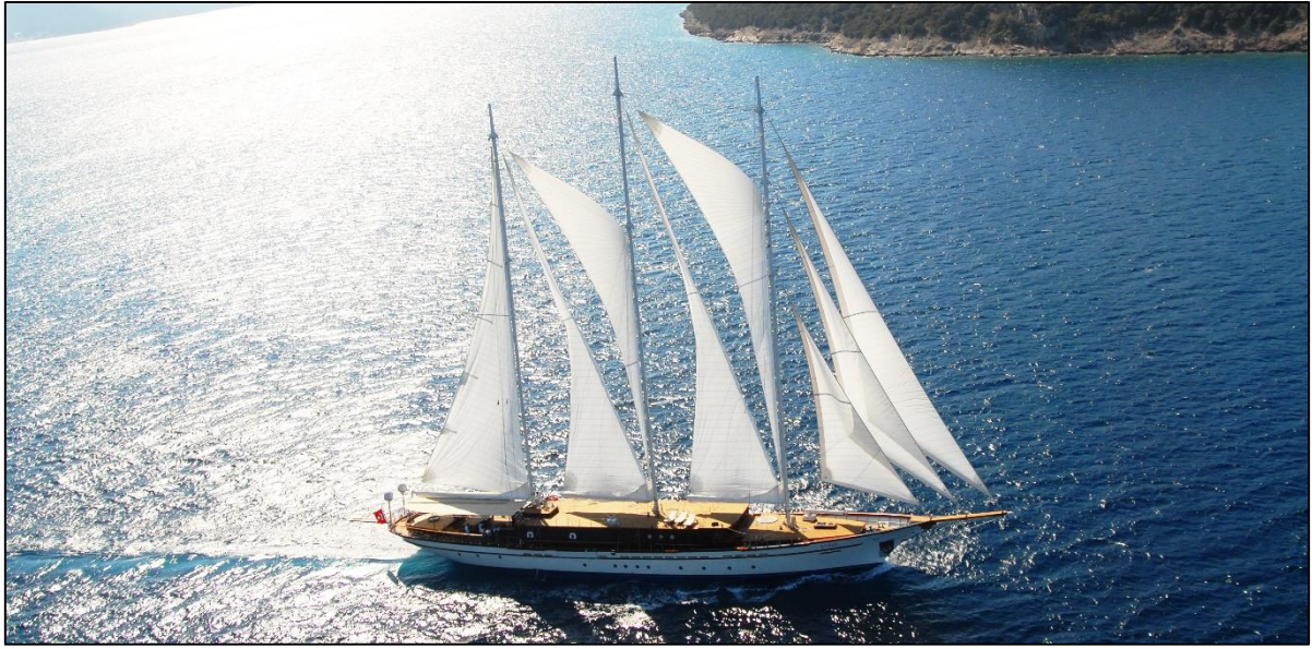
Görsel 3. Lüks sınıf Mürettebatlı kiralama hizmeti veren bir yat