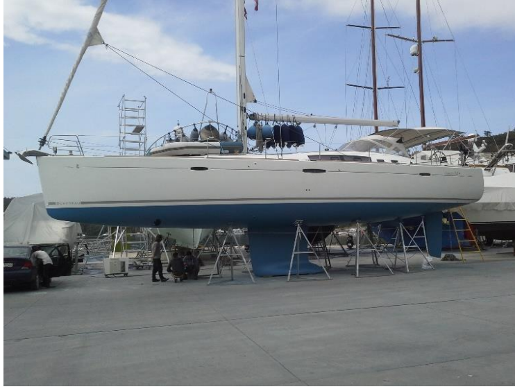
Görsel 4. Çıplak kiralama (Bareboat) yelkenli yat

Rezervasyon görüşmelerinde yabancı ziyaretçiler tarafından personelin aşılma aşılmadığını hususunda bilgi talep edilmektedir. Deniz ticaret odasının girişimleriyle bu nedenle turizm endüstrisinde faaliyet çalışanların öncelikli olarak aşı programına dahil edilmesi sağlanmıştır. Her tur öncesinde personele test yapılmıştır (Posta, 2021).