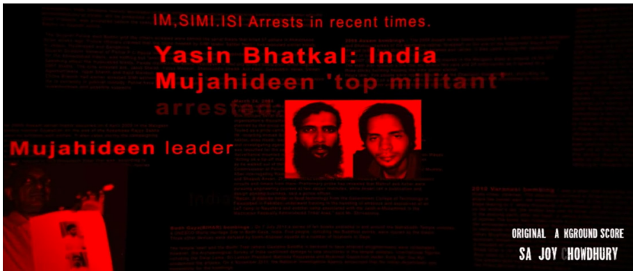
Şekil 1. Jenerik Sekansı

Filmin açılış jeneriği, 26/11 olarak anılan ve 2008 yılında Bombay şehrinde gerçekleşen bombalı saldırılar da dâhil olmak üzere Hindistan'da gerçekleştirilmiş terör eylemlerini gösteren gazete kupürlerinin hızlı bir kurguyla ardı ardına geldiği bir montaj sekans ile oluşturulmuştur.