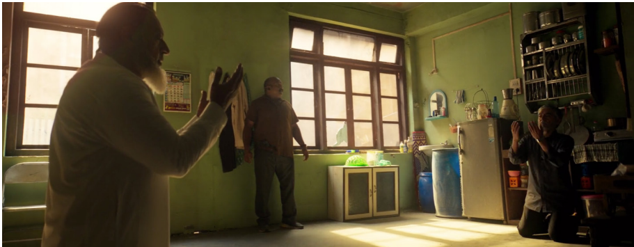
Şekil 18. Usmani ve Refik'in Bombalı İntiharı