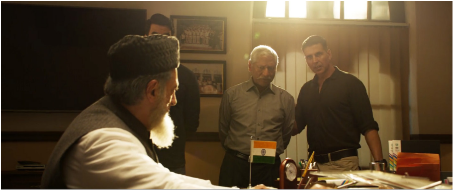
Şekil 15. İyi ve Kötü Müslüman