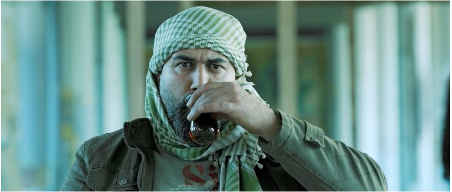
Şekil 3. Hint Ajanına Yapılan İşkenceyi İzleyen Müslüman Karakter

Kaynak: Pandey, N. (Yönetmen), (2015), Baby (Film), Hindistan: Crouching Tiger