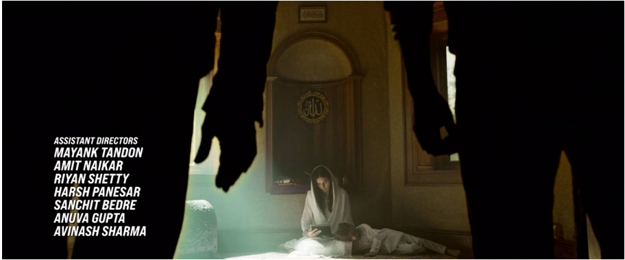
Şekil 12. Terör Örgütü Liderinin Evi

Film, 12 Mart 1993 tarihinde Bombay'da gerçekleştirilen bombalı saldırılarda Soorya'nın anne ve babasının öldürüldüğü sahne ile açılır. Ardından gelen jenerik sekansında bu saldırıları anlatan bir dış sesle birlikte o güne ait belge görüntüleri verilir. "Baby" filmi ile aynı açılış şablonunu izleyen bu filmde de böylelikle başkarakterin amaç ve motivasyonu açıklanmış olup aynı zamanda izleyici de belirli bir ideolojik zemine yönlendirilir: "Müslümanlar Hindistan için tehlikelidir!" Dış ses, daha sonra film öyküsünde o ana kadar meydana gelen olayları anlatmaya başlar. Ömer Hafız'ın büyük oğlunun Hindistan askerleri tarafından öldürüldüğünü söyleyen dış ses, bu haberi alan Ömer'in küçük oğulları Riyaaz ve Raza'nın Londra'daki eğitimlerini yarıda bırakarak Keşmir'e gelmiş olduğunu belirtir. Dış ses, böylece İngiltere ve Amerika gibi ülkelerde yüksek eğitim alan her Müslüman gencinin ya da onların ailesinin muhtemel bir terörizm bağlantısı olabileceği algısını oluşturur.