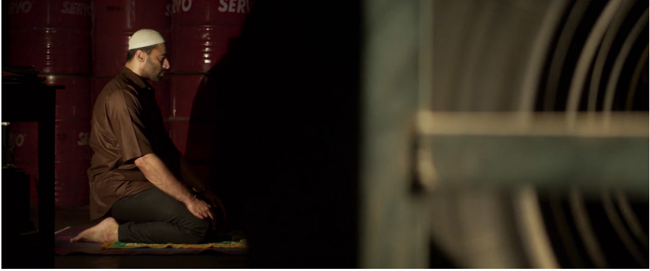
Şekil 14. Muhtar Gizlice Namaz Kılarken

Kaynak: Shetty, R. (Yönetmen), (2021), Sooryavanshi (Film), Hindistan: Reliance Entertainment