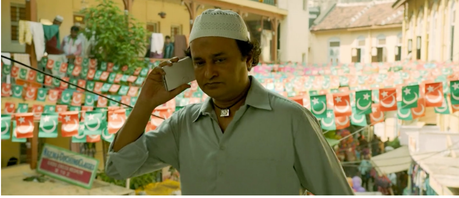
Şekil 4. Müslüman Mahallesi ve Tefvik Karakteri

Terörist örgüt, Delhi şehrindeki büyük bir alışveriş merkezinde bombalı bir saldırı planlamıştır. Bombayı yerleştiren teröristlere, eylemi başlatma talimatı başka terörist tarafından "Bismillah" kelimesi ile verilir. Eylem hazırlığına giren teröristler, kutsal bir görevi yerine getiriyorlarmış gibi birbirleriyle sıkıca sarılırlar. Talimatın "Bismillah" kelimesi kullanılarak verilmesi ve ardından teröristlerin birbirlerine sarılması, yapılacak bu bombalı eylemin sanki İslam inancının bir gereği olduğu algısını oluşturmaktadır.