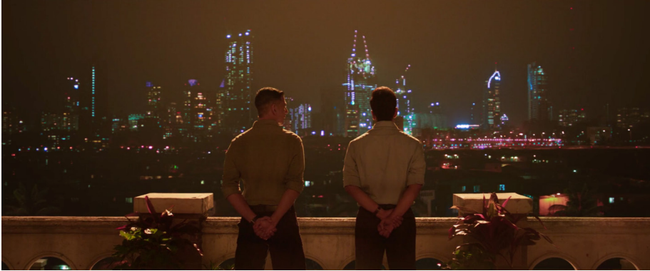
Şekil 17. Arka Planda Renkli Gökdelenler

Kaynak: Shetty, R. (Yönetmen), (2021), Sooryavanshi (Film), Hindistan: Reliance Entertainment