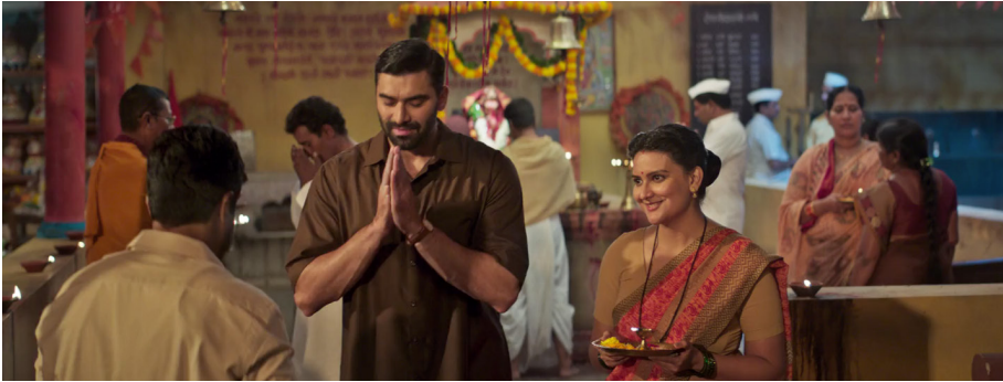
Şekil 13. Muhtar ve Eşi Hint Tapınağında

Kader Usmani, teröristler arasındaki faaliyetleri koordine eden dini bir liderdir. Soorya, Usmani’nin yönettiği bir derneğin Leşker isimli terör örgütüyle aynı kaynaktan fonlandığını tespit eder. Bu durum, filmin Hindistan Başbakanı Narendra Modi’nin söylemlerini doğrudan yansıttığını göstermektedir. Ayyub’a (2021) göre Modi hükümeti, yabancı fonlardan destek alarak ülkede terörü yaydıkları gerekçesiyle Müslüman ilahiyat fakülteleri ile çeşitli İslami kuruluşları yakın bir denetim altına almıştır.