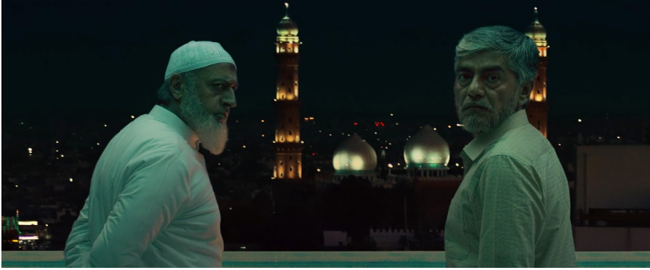
Şekil 16. Arka Planda Cami

Kaynak: Shetty, R. (Yönetmen), (2021), Sooryavanshi (Film), Hindistan: Reliance Entertainment