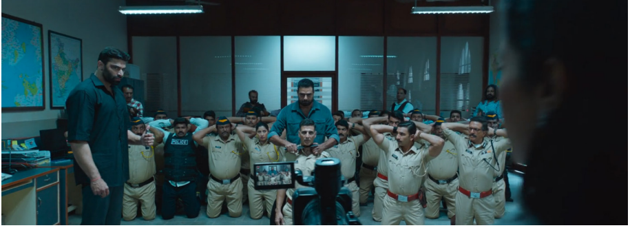
Şekil 20. Kamera Önünde İnfaz