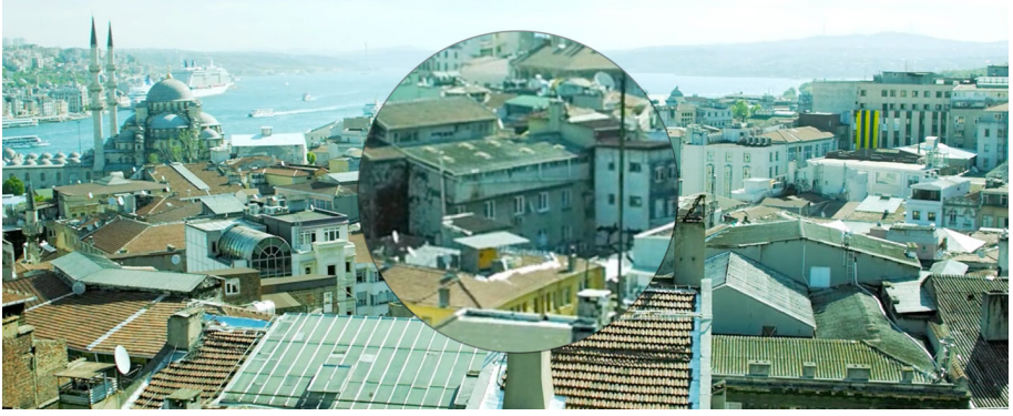
Şekil 2. İstanbul'da Terörist Karargâhı

Kaynak: Pandey, N. (Yönetmen), (2015), Baby (Film), Hindistan: Crouching Tiger