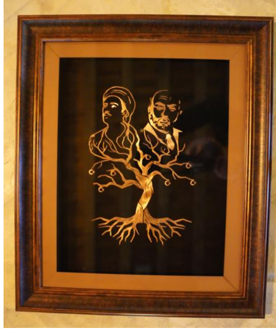
Görsel 7: Mehmet Akif Ersoy ve Yunus Emre portre tablosunun genel görünümü (Mardin Olgunlaşma Enst. Arşivi)

Tanımı: Bu tablo, Cumhurbaşkanlığına 2021 Senesi Mehmet Akif ve İstiklal Marşı Yılı ile Yunus Emre ve Türkçe Yılı ilan etmesi hasebiyle Mardin Olgunlaşma Enstitüsünde düzenlenen etkinlik kapsamında üretilmiştir. 70x40 cm ölçülerinde yapılan tablo, bakır malzemeye kıl testere kesimi sonucu oluşturulmuştur. Tabloda hayat ağacı üzerinde Yunus Emre ve Mehmet Akif Ersoy portreleri işlenmiştir. Ağacın dallarında ay ve yıldız sembollerine yer verilmiştir. Ağacın dallarında ay ve yıldızın olması, Akif ve Yunus'un fikirlerinin yeşermeye başladığı, meyve verdiğini anlatmak amacıyla yapılmıştır.