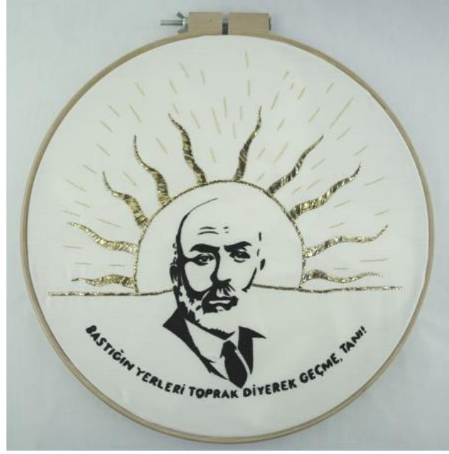
Görsel 8: Kasnak üzeri nakış işlemeli Akif portresinin genel görünümü