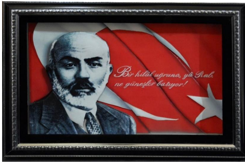
Görsel 3: Mehmet Akif Ersoy rölyef tablosu (Mardin Olgunlaşma Enst. Arşivi)

Tanımı: 70x50 cm ölçülerinde yapılan tablo, üç boyutlu rölyef tekniği ile yapılmıştır. Tabloda renkli resim, mukavva karton, silikon, boya kalemleri, çerçeve ve vernik kullanılmıştır. Tabloya uygulanan teknik kâğıt rölyef tekniğidir. Kâğıt rölyef, çalışmaların yapım tekniği olarak icra edilen sanatsal çalışmadır. Belirlenen sanat ürünlerin uzak veya yakın modellerin kesilip üst üste yapıştırılmasıyla oluşturulmaktadır. Tablonun merkezine Akif'in portresi yerleştirilerek arka zeminde Türk Bayrağı resmedilmiştir. Hilalin içine "Bir hilal uğruna ya Rab ne güneşler batıyor!" yazılmıştır. Dizede yer alan "hilâl" sözcüğüyle bayrağımız ve İslam dini kast edilmiştir. "Güneş" sözcüğü ise Türk askerini temsil etmektedir. Hilâlin yani bayrağımızın ve İslam dininin yücelmesi için güneşin batması, askerlerin şehadete ermesi ile mümkün olacağı bize anlatmaktadır.