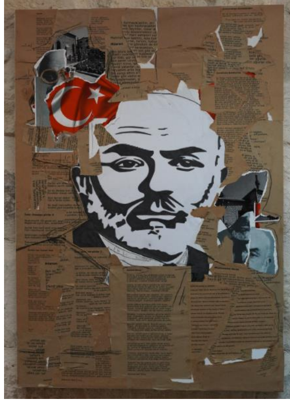
Görsel 9: Mehmet Akif Ersoy Kolaj Çalışması tablosu genel görünümü