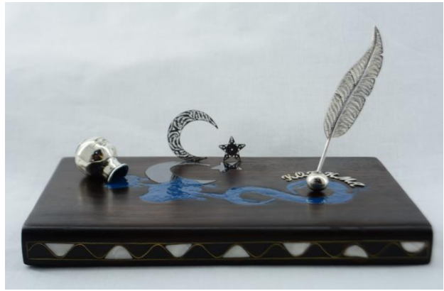
Görsel 4-5: Akif'in Kaleminden adlı çalışmanın genel görünümü