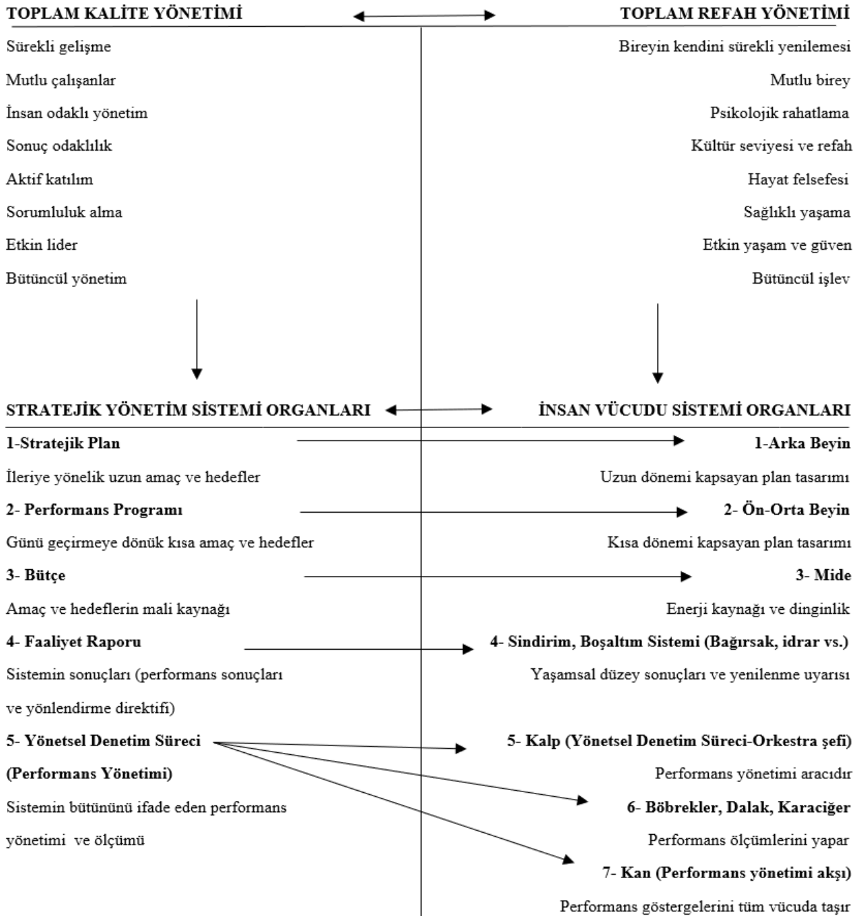
Şekil 1. Toplam kalite yönetimi ve toplam refah yönetimi sistemlerinin stratejik yönetim ve insan vücudu sistemi ile karşılaştırılması

[2] Ayrıntılı bilgi için bkz. A. Turan Öztürk, Postmodern Kamu Yönetiminde Ahlaki Davranışların Kurumsallaşması ve İyiliğin Küreselleşmesi Üzerine Düşünceler , (Eds. Bekir Parlak, Kadir Caner Doğan), Postmodern Kamu Yönetimi, Nobel Akademik Yayıncılık, Ankara, 2021, s.393.