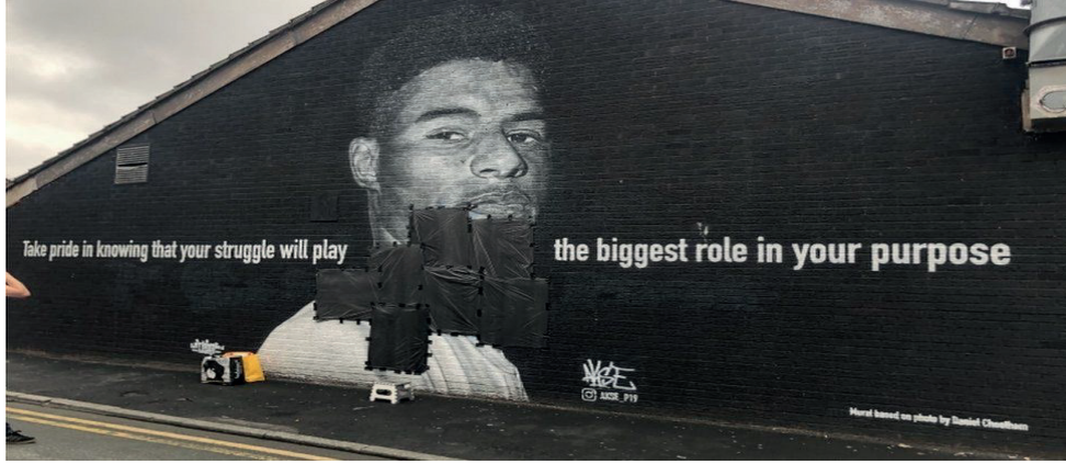
Şekil 2: Rashford'ın Resmine Düzenlenen Saldırı Sonrası Yapılan Sansür