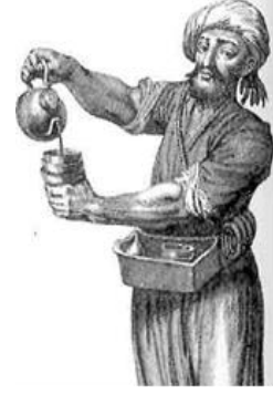
İstanbul sokaklarında kahve satıcısı, Hollanda gravürü, 17. yüzyıl.*