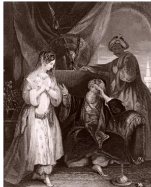
18. yüzyılda Avrupa'da sahne sanatları ve oyuncuların kostüm tasarımı Turquerie akımının etkileri Les Indes galantes 'de sahne örneđi.

Türköri imgelerini kullanan başka önemli bir isim de Louis Fuzelier'dir. Louis Fuzelier'nin 1735 tarihinde yazdığı Les Indes Galantes (Yürekli Hintliler) adlı ünlü balesi, aşk temasını uzak diyara ait egzotizm ile birleştirmiştir. Türklerin yüceltildiđi ilk eserlerden olan bu balede "Le Turc Généreux" (Gönlü Yüce Türk) adlı ikinci perdenin giriş bölümünde belirtilen olay yerinin, Türklerin bulunduğu bir bölge olduđu Fuzelier tarafından dile getirilmektedir: "Sahne, Hint Denizi'ndeki bir Türk adasının limanındadır." 7 (Fuzelier, 1735: 24) Bale sahnesinde ise adada yaşayan Osman Paşa'nın, tutsađı Fransız Emilie'ye olan aşkının hikâyesi anlatılmaktadır. Aşağıdaki resimde Emilie karakterinin üzerindeki giysilerin Turquerie akımına ait izleri görülmektedir.