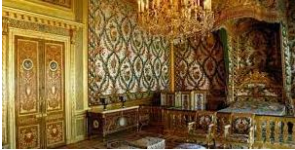
Marie Antoinette Fontainebleau řatosundaki Türk esintisiyle düzenlenen yatak odası (Resim 4)