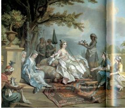
Sultan , Charles Van Loo, 18. yüzyıl. Chéret Müzesi, Nice. Charles Van Loo, Gobelins, 772'de duvar halısı.