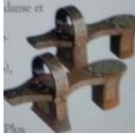
Bir çift nalın