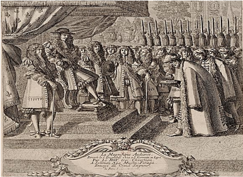
Fransa Kralı XIV. Louis tarafından Osmanlı Elçisi Süleyman Müteferrika'yı Saint-Germain-en-Laye'de huzuruna kabul edişi. 5 Aralık 1669. 4

Molière'in " Kibarlık Budalası " XVII. yüzyıl sonlarındaki diplomatik ve sosyal olayları komedi türünde en iyi yansıtan oyundur. Molière bu oyununda özellikle Fransa'nın Osmanlı Devleti'yle ilgili ilişkilerini eleştirir. Oyunda 1669 yılında Fransa, Paris'e elçi olarak gönderilen Müteferrika Süleyman Ağa'nın "Güneş Kral" olarak adlandırılan XIV. Louis'nin huzuruna çıkışı ele alınmaktadır. Kralın, elçinin karşılama töreni için yaptığı harcama dikkate değerdir. Taha Toros bu tarihi kabul hazırlığını şu şekilde anlatır: Kral'ın Türk elçisini karşılamak için giydiği elbise, dünya kurulalı beri hiçbir imparator tarafından giyilmemiş zenginlikteydi. Bu elbise, kıymetli taşlarla süslenmiş, mücevherat âbidesi gibiydi. Sarayın kuyumcusu Armesson, Le Journal d'olivier de yayınlanan "Le frère d'Armesson" adlı hâtıratında XIV. Louis' nin, Türk sefirini kabul merasiminde giymek üzere kendisine hazırlattığı bu özel elbise için 14 milyon frank sarf edildiğini ve görenlerin gözlerinin kamaştığını anlatmaktadır. (Toros, 1968: 11)