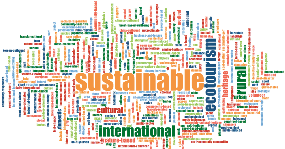
Şekil 10. Tüm Çalışmaların Kelime Bulutu Analizi

Tüm yıllar ve dergiler birlikte değerlendirildiğinde ise toplamda 404 farklı turizm çeşidiyle ilgili çalışma yapıldığı sonucuna varılmıştır (Bknz. Şekil 10). Tekrar sıklığına göre ilk 10’u oluşturan turizm çeşitleri Tablo 2’de sunulmuştur.