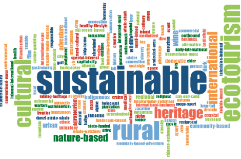
Şekil 4. 2002-2011 Yılları Aralığındaki Çalışmalar