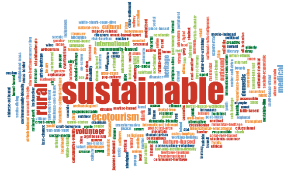
Şekil 5. 2012-2021 Yılları Aralığındaki Çalışmalar

1970’lerden başlayarak 1991 yılına kadar yapılan yayınlarda uluslararası turizm (international tourism) 31 tekrar ve %20,67’lik payla birinci gelmektedir. Toplamda 60 farklı turizm çeşidinin listelendiği zaman aralığında uluslararası turizmi 10 tekrarla iç turizm (domestic tourism) ve 8 tekrarla şehir turizmi (urban tourism) takip etmektedir (Bknz.Şekil 2). Şekil 3’de sunulduğu üzere, 1992-2001 yılları arasında yapılan yayınlarda ekoturizm (ecotourism) 39 tekrar ve %10,60’lık payla birinci gelmektedir. Toplamda 102 turizm çeşidinin listelendiği zaman aralığında 34 tekrarla uluslararası turizm ikinci, 31 tekrarla sürdürülebilir turizm (sustainable tourism) üçüncü gelmektedir. 2002-2011 yılları arasında yapılan yayınlarda ise sürdürülebilir turizm 50 tekrar ve %7,85’lik payla birinci gelmektedir. Toplamda 155 turizm çeşidinin listelendiği zaman aralığında 41 tekrarla ekoturizm ikinci, 40 tekrarla kırsal turizm (rural tourism) üçüncü gelmiştir (Bknz. Şekil 4). 2012-2021 yılları arasında yapılan yayınlarda da sürdürülebilir turizm 95 tekrar ve %7,96’lık payla birinci