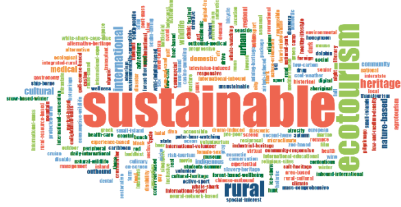
Şekil 9. Tourism Management

Annals of Tourism Research dergisinde toplamda 186 farklı turizm çeşidiyle ilgili çalışma yapıldığı ve en çok tekrarlanan turizm çeşidinin ise 48 tekrarla “uluslararası turizm” olduğu belirlenmiştir (Bknz.Şekil 6). Journal of Travel and Tourism Marketing dergisinde toplamda 120 farklı turizm çeşidiyle ilgili çalışma yapıldığı, en çok tekrarlanan turizm çeşidinin 19 tekrarla “sürdürülebilir turizm” olduğu tespit edilmiştir (Bknz. Şekil 7). Journal of Travel Research dergisinde toplamda 113 farklı turizm çeşidiyle ilgili çalışma yapıldığı tespit edilmiş, Şekil 8’ de görüldüğü gibi, en çok tekrarlanan turizm çeşidinin 29’ar tekrarla uluslararası ve sürdürülebilir turizm çeşitleri olduğu belirlenmiştir. Tourism Management dergisinde toplamda 241 farklı turizm çeşidiyle ilgili çalışma yapıldığı tespit edilmiş, en çok tekrarlanan turizm çeşidinin 85 tekrarla “sürdürülebilir turizm” olduğu belirlenmiştir (Bknz. Şekil 9).