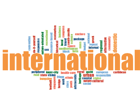
Şekil 2. 1991 ve Öncesi Çalışmalar

Analiz sürecinde belirlenen dergilerde (ATR, JTR, TM, JTTM) yer alan makaleler, onar yıllık olmak (1991 ve öncesi haricinde 3 ) üzere dört zaman diliminde değerlendirilmiştir.