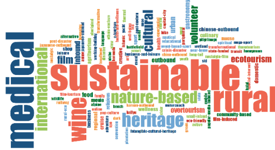
Şekil 7. Journal of Travel and Tourism Marketing