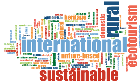
Şekil 8. Journal of Tourism Research