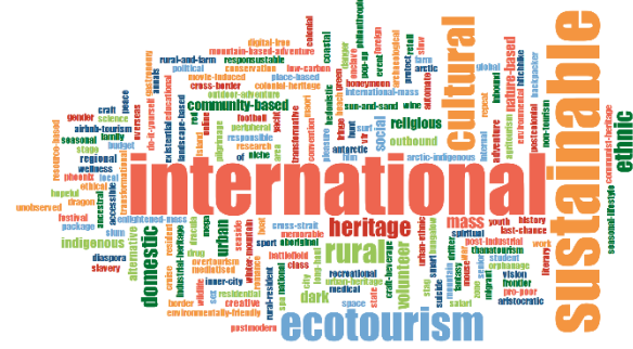
Şekil 6. Annals of Tourism Research

Dergi özelinde değerlendirildiğinde sürdürülebilir turizmin tüm dergilerde ağırlıklı olarak yer aldığı görülmektedir. Ortaya çıkan diğer bir sonuç da turizm türlerindeki sayısal artıştır. 1990'lar öncesindeki turizm türlerinin, 2010'lara gelindiğinde 4 katından fazla bir artış gösterdiği ortaya koyulmuştur.