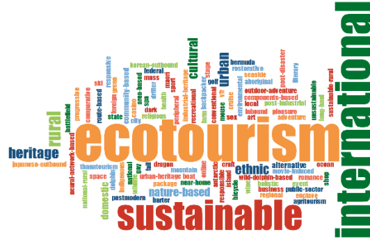
Şekil 3. 1992-2001 Yılları Aralığındaki Çalışmalar