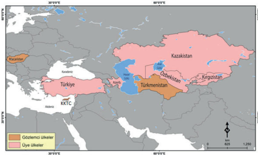
Türk Devletleri Teşkilatı Üyeleri ve Konumları