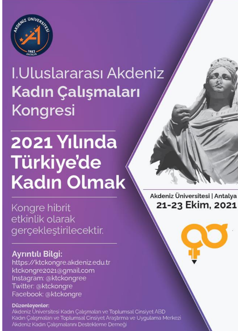
Görsel 6. I. Uluslararası Akdeniz Kadın Çalışmaları Kongresi Afışı