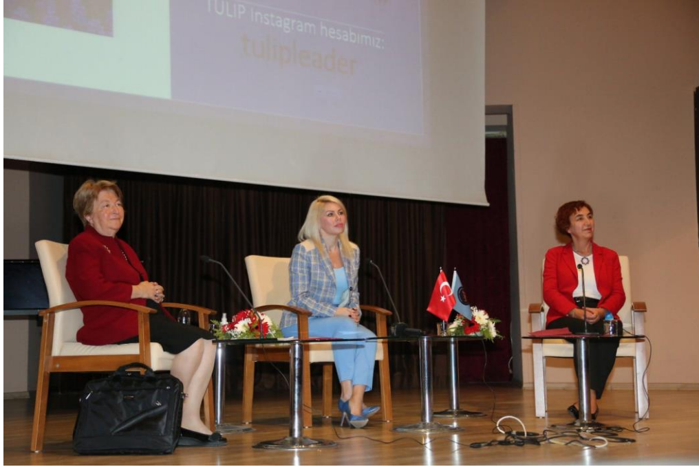
Görsel 1. Akademide Yöneten Kadınlar Paneli