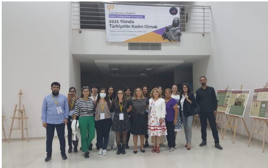
Görsel 4. Kongre Düzenleme Ekibi

Son olarak Kentleşme, Kırsal Alan, Göç ve Kadın oturumunda altı bildiri sunulmuştur. Suriyeli göçmen kadın olmak, kırsal alanda doğanın korunmasındaki kadının rolü, modern yaşama geçiş sürecinde mekan ve zaman bağlamında kadın, kadın çiftçilerin sosyo-ekonomik durumu, küresel gıda rejiminde feminist müdahaleler ve Çanakkale- Çamkalabak Köyü'nde kadınlarla gerçekleştirilen bir projenin sosyolojik anatomisi ele alınmıştır.