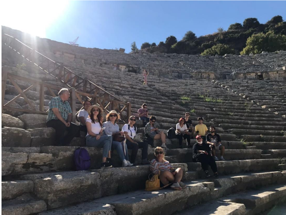
Görsel 5. Perge Antik Kent Gezisi

Kongreye kabul edilen tüm bildirimler sunulduktan sonra kongrede sosyal etkinlik olarak Perge antik kentine 23 Ekim 2021 Cumartesi günü bir gezi gerçekleştirilmiştir. Gezi için Perge antik kentinin seçilme nedeni kongre afişinde de yer alan Plancia Magna'dır. Adeta Perge'nin sembolü olan kentin ileri gelen ailelerinden birisinin kızı olan Plancia Magna Perge'nin gelişip kalkınmasına hayırseverliği ile önemli katkılar sunmuştur. Bu hizmetleri karşılığında Perge halkı onu "kentin kızı" unvanı ile onurlandırdığı gibi günümüzde belediye başkanlığına karşılık gelen kentin en önemli kamu görevi olan "Demiourgos" luk görevi verilmiştir. Yalnızca erkeklere açık, en yüksek kamu görevi olan "Demiourgos" luk göreviyle Plancia Magna Antik çağda yönetimde söz sahibi olan az sayıda kadından birisidir. Tarihte iz bırakan kadınlardan birisi olarak Plancia Magna'ya dikkat çekmek açısından Perge antik kentini ziyaret etmek anlamlı olmuştur.