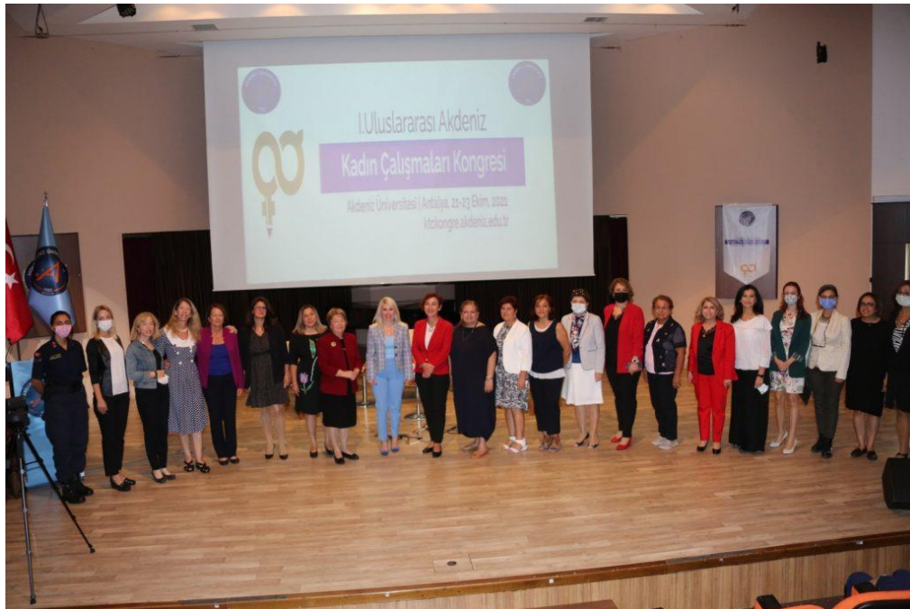
Görsel 2. Panel Katılımcıları ve Kadın Çalışmaları ve Toplumsal Cinsiyet Ana Bilim Dalı Öğretim Üyeleri

Kadına Yönelik Şiddet temasıyla gerçekleşen ilk oturumda, sosyal medyada yer alan şiddet, şiddetle mücadelede şiddeti önleme ve şiddetten korunma stratejileri, erkeklerin şiddet anlatıları ve video kulüp toplantıları üzerine güncel araştırmalar sunulurken konu dinleyicilerle tartışılmıştır.