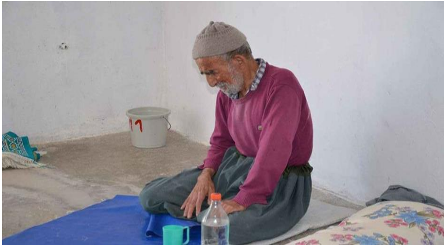
Görsel 3: "Kimsesiz yaşlı çift, 10 bin liralık elektrik faturası!", (Milli, 2020, 28 Ağustos)

bu alandaki buzdolabı, çeşitli bez eşyalar vb. yoksulluğun eğretilmesi olarak kullanılmaktadır. Buzdolabının ve diğer eşyaların, içinde bulunan ortamın duvarlarının ve zeminin eski bir görünümde olması yoksulluğa vurgu yapmaktadır. İçinde bulunulan bağlam açısından görselin duygusal işlevi yaşlı yoksulluğunun yaşlıların standart bir hayat şartlarından mahrum kalmalarına neden olduğuna işaret etmektedir. Zira günümüz şartlarında standart bir hayat barınılan ortamın nispeten sağlıklı, güvenilir, düzenli olmasını elzem kılmaktadır. Görselde oturma odası şeklinde algılanan mekânda buzdolabının olması bu alanın ayrı bir mutfağı olmadığı şeklinde okunabilir. Ayrıca ayakta duran kadının ayağının çıplak olması, ayağında çorap veya terlik olmaması da dikkat çekmektedir. Çeşitli nesnelerin duvara asılı ve karmaşık bir şekilde durması da yaşlı bireylerin sağlıklı bir ortamda yaşamadığını dolayısıyla da barınak sorunu yaşadığını vurgulamaktadır. Tüm bu unsurlar ilgili bireylerin standart bir hayat yaşamadıklarını göstermektedir. Görselin gönderimsel işlevi yoksulluğun yaşlıların yaşam şartlarını zorlaştırmakta olduğunu belirtmektedir. İlgili görselde yoksulluğun yaşlıların standart bir hayat yaşamalarına engel olduğuna vurgu yapılarak yaşlıların en azından standart bir yaşam sürmeleri gerektiği yönünde çağrıda bulunmaktadır. Bu şekilde yaşlı yoksulluğunun önlenmesine yönelik algı oluşturmak amaçlanmaktadır.