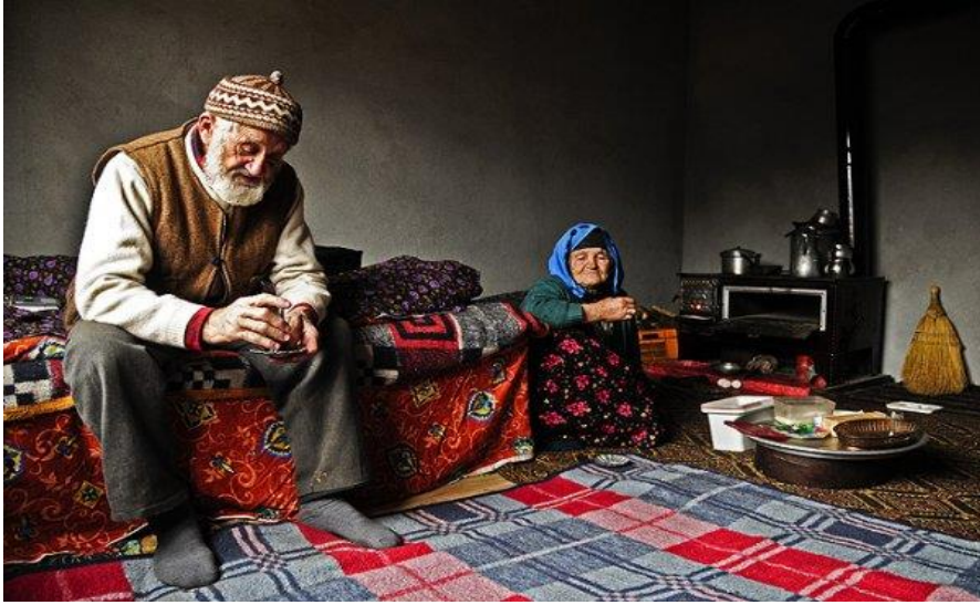
Görsel 5. "Yoksula yardımlı zengine gidiyor", (Adanapost, 2012, 21 Ağustos)

yardımlı yapan bir görevli olduğu anlaşılmaktadır. Yaşlı bireyin elindeki boş tabağın söz konusu yardımlı almak için kullanılacağını göstermektedir. Yaşlı kadının kıyafeti incelendiğinde sol ayağında çorap olmadığı, sağ ayağındaki çorabın ise birkaç yerden delinmiş olduğu görülmektedir. Bu durum derin bir yoksulluğa işaret etmektedir. Baston ve görevlinin yardımıyla yürümeye çalıştığı görülen yaşlı bireyin hayatının yoksullukla daha da zorlaştığına dikkat çekilmektedir. Bu bağlamda görselin duygusal işlevi yoksulluğun yaşlıların muhtaç bir hayat sürmelerine neden olduğu şeklindedir. Gönderimsel işlev bağlamında ise yoksulluğun yaşlıların gıda gibi temel ihtiyaçlara erişiminin dahi zorlaştırdığı mesajı verilmektedir. Bu bilgiler ışığında görsel aracılığıyla yoksul yaşlılara gıda gibi temel ihtiyaçlar yönünden yardımlı edilmesine yönelik çağrıda bulunularak yoksul yaşlılara yönelik sosyal yardımlı ve dayanışmanın önemine vurgu yapılmaktadır.