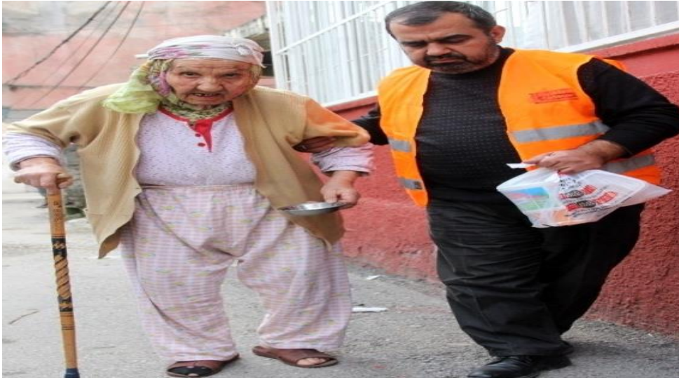
Görsel 4. "Her Gün 250 Yoksul Kadına Yemek", (Haberler.com, 2019, 29 Nisan)

Görselde dizlerinin üzerinde oturur şekilde görünen yaşlı birey, yoksulluk mağduru yaşlıların düzdeğişmeci olarak kullanılmaktadır. İçinde bulunulan ortam yoksulluğun eğretilmesi olarak ön plana çıkmaktadır. Yerdeki kova, bez parçası ve belli belirsiz nesnelere derin bir yoksulluğa işaret etmektedir. Bir bez parçası üzerinde çaresiz ve üzgün bir şekilde dizlerinin üzerine hafif sağa eğimli şekilde oturan yaşlı birey, yoksulluğun yaşlıları çaresiz bıraktığı ve psikolojileri üzerinde olumsuz etki yaptığını yönelik mesaj vermektedir. Bu mesaj görselin duygusal işlevini oluşturmaktadır. Psikolojik iyi halin sağlığın önemli bir bileşeni olduğu düşünüldüğünde yoksulluğun yaşlıların sağlığına yönelik bir tehdit oluşturduğu kabulü öne çıkmaktadır. Yoksulluğun kıyafet üzerinden de yansıtıldığı görselde yaşlı bireyin psikolojisinin ön planda olması bulunduğu ortamın da yoksulluğu yansıttığı dikkate alındığında görselin gönderimsel işlevi yoksulluğun yaşlıların üzerinde yalnızca maddi değil manevi sorunlara da yol açtığını vurgulamaları açısından önemlidir. Görselde yoksul yaşlıların maddi ve manevi desteğe ihtiyacı olduğu yönünde çağrıda bulunmaktadır.