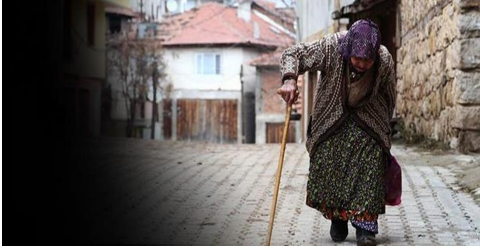
Görsel 1: “Yaşlılar yoksullaştı”, (Cumhuriyet, 2017, 16 Mart)