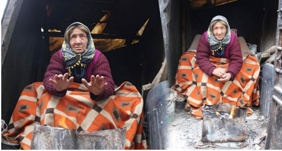
Görsel 6. "Yaşlı kadının yürek yakan fotoğrafı", (İhlas Haber Ajansı, 2015, 09 Şubat)