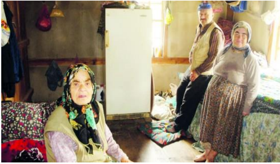
Görsel 2: “Bir yandan yaşlılık, diğer yandan yoksulluk bellerini büküyor. Tek odada yaşam mücadelesi”, (Açıksöz, 2015, 29 Nisan)

maddesi gibi zorunlu ihtiyaçların olduğunu düşündürmektedir. Bu bakımdan görselin duygusal işlevi yaşlı yoksulluğunun, yaşlıların yaşamlarını olumsuz yönde etkilediği düşüncesini ön plana çıkarmaktadır. Fotoğrafın sol tarafı karanlık görülmektedir. Bu durum, doğrudan yaşlı bireye ve içinde bulunduğu muhite odaklanılması amacına yöneliktir. Yaşlı bireyin hemen arkasında taşla örülmüş bir duvar, mütevazı bir müstakil ev ve üzerinde yürüdüğü kaldırım taşlarıyla döşenmiş bir yol görülmektedir. Söz konusu unsurların modern yapılardan uzak mütevazı bir şekilde görselde yer alması yoksulluğun vurgulanması amacına dönüktür. Tüm unsurlar bir arada değerlendirildiğinde görselin gönderimsel işlevinin yoksulluğun yaşlıların yaşam şartlarını zorlaştırdığı düşüncesi olduğu söylenebilir. Görsel aracılığıyla yoksulluğun yaşlıların yaşam şartları üzerindeki etkisine dikkat çekilerek yaşlı yoksulluğuyla mücadele edilmesine yönelik çağrıda bulunulmaktadır. Bu şekilde yaşlı yoksulluğunun önlenmesine yönelik bir algı oluşturulmaktadır.