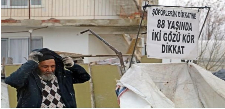
Görsel 7. "Gözleri görmeyen yaşlı adamın yürek burkan hikâyesi", (Yeni Akit, 2019, 31 Ocak)

yoksulluğun yaşlı bireyler üzerindeki etkilerine dikkat çekilerek yoksul yaşlı bireylere yönelik en azından barınma, ısınma gibi temel ihtiyaçlar yönünden yardımda bulunulması şeklinde çağrıda bulunmaktadır.