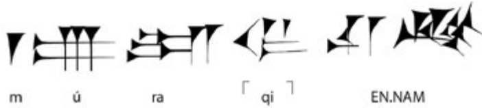
Fig. 8: CTU CB Ay-10