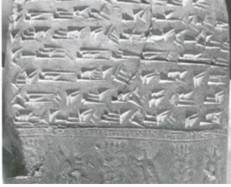
Fig.1: Üst Düzey Bir Ofise/Kâtibe Ait Karmir Blur'da Bulunan Bir Yazışma (CTU CT Kb-4) (Gönderilmiş)