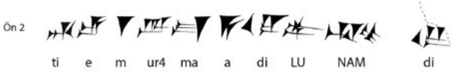
Fig. 7: CT Kb-7, Satır: 2

Karmir-Blur'da bulunan CT Kb-7 numaralı bir başka tabletin 2. satırında da benzer bir kullanım söz konusudur;