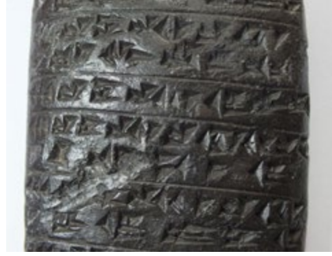
Fig.2: Acemi Bir Kâtip Tarafından Yazılmış Anzaf Tableti (CTU CT An-1) (Gönderilmeyen)