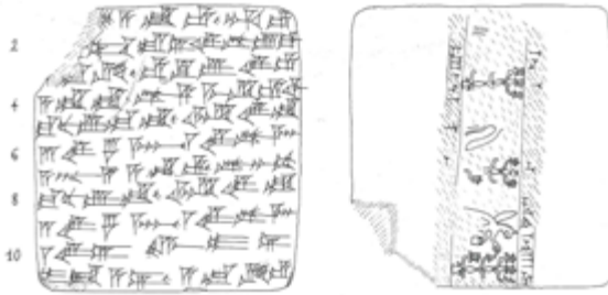
Fig. 4: Bastam’da Bulunmuş Olan ve Boş Kalan Arka Yüzeyi Dikey Olarak Mühürlenmiş Bir Urartu Tableti (CTU CT Ba-2)

Bürokratik belgelerde karşılaştığımız en yaygın yazışma biçimi ise silindir bir mühürle mühürlenmiş türden çivi yazılı tabletlerdir. Bu belgelerde metnin bitişi sonlandırmak ve onay maksadıyla, mühürlerin dikey veya yatay biçimde kullanılmış olduğunu görebilmekteyiz (Bkz. Fig. 4). Bu sınırlandırma, evraklarda sonradan eklenme yapılmasını da önlemek amacıyla günümüzde bile görülebilen bürokratik bir uygulamadır.