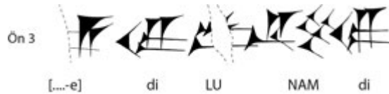
Fig. 6: CT Ba-3, Satır: 3

Yukarıda bahsettiğimiz Bastam ve Karmir-Blur'da ele geçen iki farklı tablette bahsi geçen LU NAM unvanının herhangi bir kısaltma olması da kanımızca söz konusu değildir. Bazı bullalar üzerinde yer alan determinatiflerde veya isimlerde kısaltmalar yapılabildiği bilinmesine rağmen EN.NAM ideogramının kısaltılmış olduğu görülmez. Bastam tabletinde 3. satırda isminin baş kısmı okunabilen "Šei[...]" isimli bu yöneticiye doğrudan hitap edildiği anlaşılmaktadır (CTU CT Ba-3). Aşağıda da görülebildiği üzere tabletin isim sonrasında unvan bulunan kısmında herhangi bir kırık olmadığı ve LU NAM determinatif ve ideogramının tam okunabilir olduğu görülebilmektedir. 2. sırada bulunan LU NA 4 DIB'dan önce gelen bu unvan, LU NAM'ın yani şehrin en üst düzey yetkilisinin konumunu yansıtır;