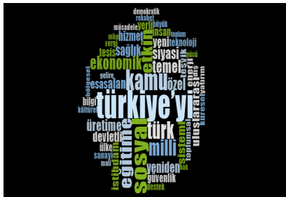
1 Kasım 2015 Seçim Beyannamesi