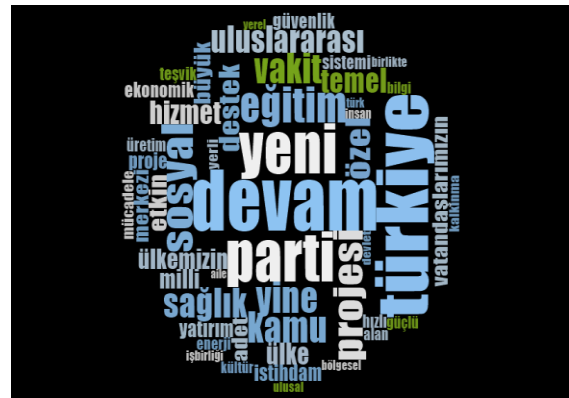
Şekil-1: Adalet ve Kalkınma Partisi'nin Seçim Beyannamelerinde En Sık Kullanılan 50 Kelimeye İlişkin Kelime Bulutları

AKP'nin seçim beyannamelerinde kullandığı kelimelerin (ilk 50 kelime) sıklıklarına göre oluşan Kelime Bulutları Şekil 1’de gösterilmiştir.