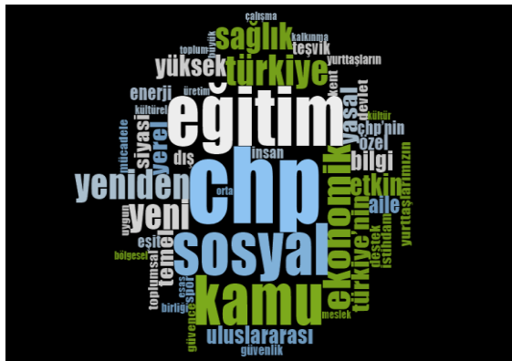
1 Kasım 2015 Seçim Beyannamesi