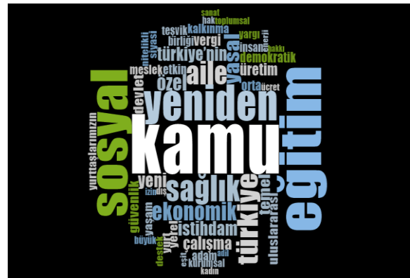
Şekil-2: Cumhuriyet Halk Partisi’nin Seçim Beyannamelerinde En Sık Kullanılan 50 Kelimeye İlişkin Kelime Bulutları