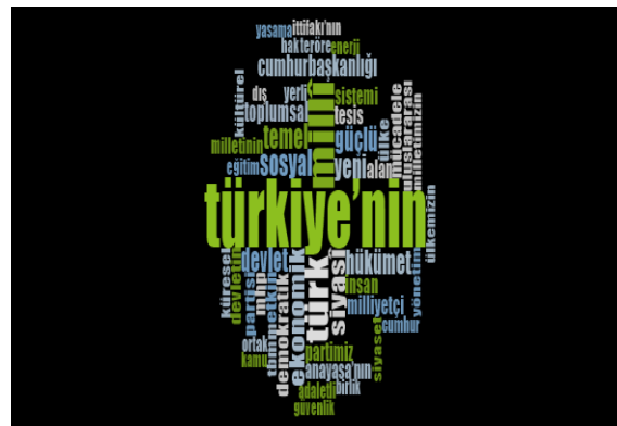
Şekil-3: Milliyetçi Hareket Partisi'nin Seçim Beyannamelerinde En Sık Kullanılan 50 Kelimeye İlişkin Kelime Bulutları